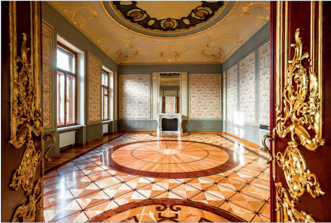
Леонтьевский пер., 10

ского законодательства в области охраны недвижимых объектов культурного наследия под контролем государственных органов по охране памятников.