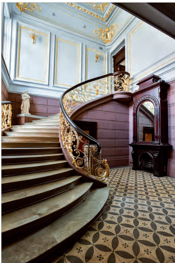
Ул. Пятницкая, 33-35

дению Дней исторического и культурного наследия. Возможность посещения москвичами уникальных исторических особняков реализуется в партнерстве с дипломатическими представительствами. Сотрудники ГлавУпДК организуют в рамках Дней исторического и культурного наследия экскурсии в особняки, чьи двери были десятилетиями закрыты для широкой публики.