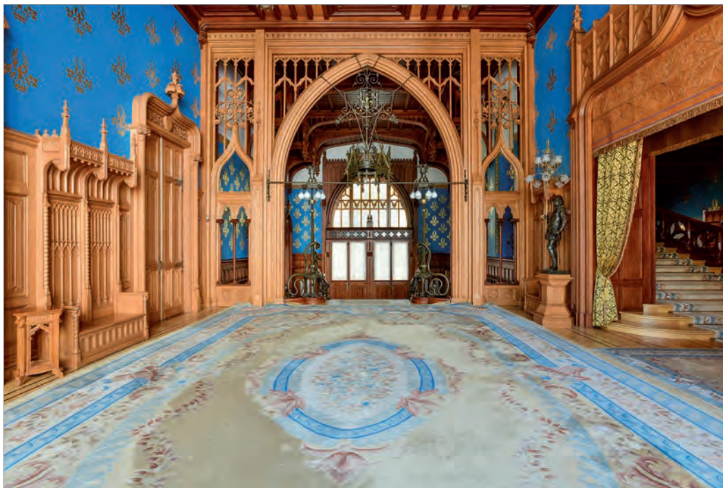
Ул. Спиридоновка, 17

В основном в них размещаются дипломатические миссии и представительства международных организаций. Среди этих зданий - шедевры всемирно признанных архитекторов - Федора Шехтеля, Льва Кекушева, Петра Бойцова, Вильяма Валькота - великолепные образцы стилей необарокко, неоклассицизма, неоготики, эклектики, а также периода расцвета русского модерна.