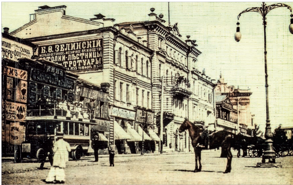
Харьков. Николаевская площадь. Городская управа

люционный комитет, провели «всеукраинский национальный съезд» и сформировали Центральную раду с сомнительной легитимностью, которая провозгласила себя высшим органом власти на Украине. Ее председателем был избран М.С.Грушевский, под руководством которого началась работа по разъяснению в массах преимуществ украинизации, в том числе в частях российской армии, дислоцированных в малороссийских губерниях. Один из министров правительства Украины при гетмане П.П.Скоропадском оценивал личность М.С.Грушевского следующим образом: «Растрепанный ученый, который променял науку на мелкую политику» 57 . Во время правления Грушевского была провозглашена культурно-национальная автономия в составе России и проводились меры государственного строительства. После октябрьской революции 1917 года этнократы, провозгласив «Украинскую Народную Республику», взяли курс на ее отделение от России.