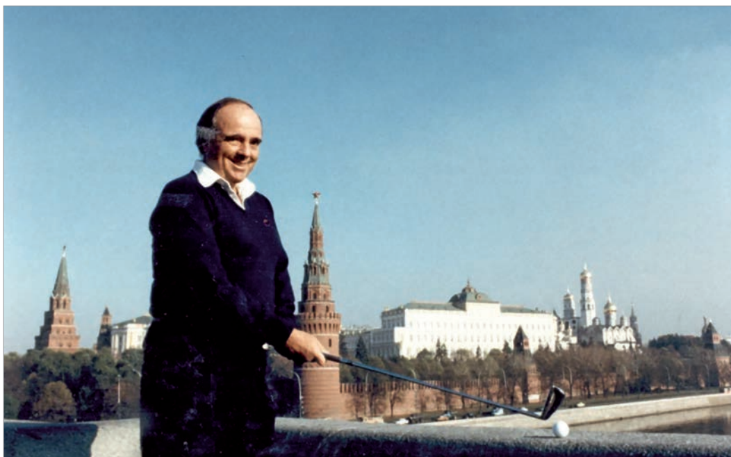
Роберт Трент Джонс-младший

Значительный опыт ГлавУпДК в строительстве и ведении хозяйственной деятельности позволил выполнить беспрецедентную задачу по созданию уникального даже по международным меркам поля для неизвестного тогда в России вида спорта.