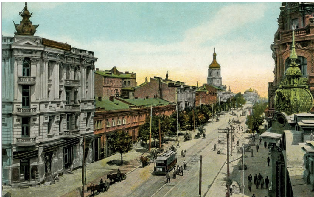
Киев, улица Большая Владимирская