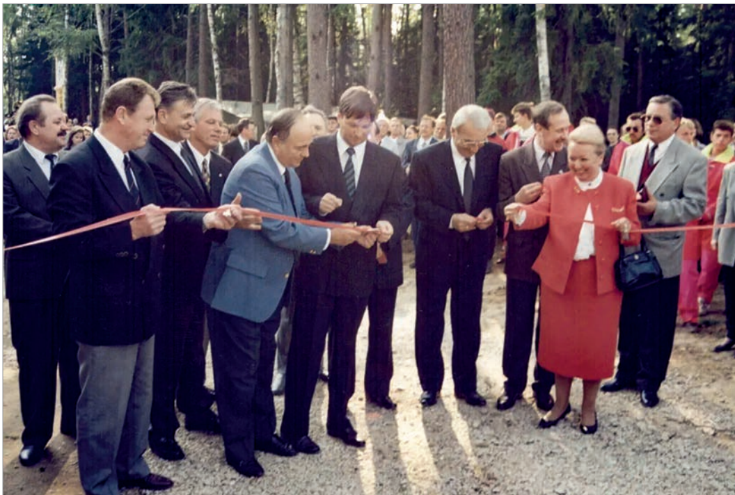
Церемония открытия гольф-поля

Сегодня гольф-клуб «Москоу Кантри Клуб» - привилегированный деловой и спортивный центр международного масштаба. Там проходят международные турниры по гольфу, встречи и конференции элит мирового и российского бизнес-сообщества. Курорт пользуется популярностью среди профессионалов и любителей гольфа.