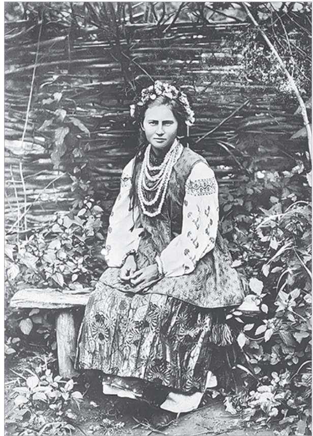
Девушка из Малороссии

Учитывая этот важный фактор, говорить о «целенаправленном подавлении» украинского печатного слова в то время было бы несправедливо. Печатное малороссийское слово имело значение лишь для крайне малой образованной части общества, и при этом специфического круга. По мере же повышения уровня грамотности