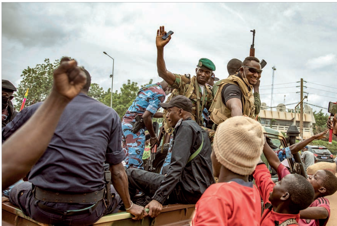
Единство армии и народа

свое согласие с операцией «Бархан» и тем самым выразить поддержку военному присутствию Франции в регионе только усилило недовольство и инициировало протестное движение, и путч в Мали со свержением Президента Кейты вполне может спровоцировать аналогичные события в регионе и дестабилизировать всю Западную Африку.