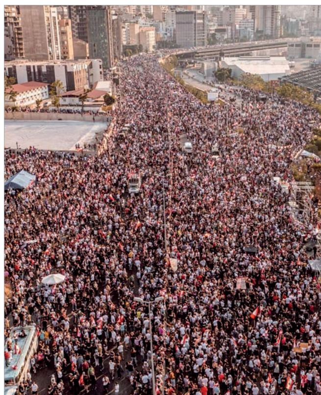
Бейрут: год спустя после взрыва

Деградирует и криминальная обстановка, активизировался вывоз за рубеж наркотиков, которые долгие годы производятся в долине Бекаа. Грузы ливанских наркоторговцев задерживались в Саудовской Аравии, ОАЭ и Греции. Между контрабандистами и подразделениями армии и внутренней безопасности вспыхивают перестрелки. Вообще, если в период «арабской весны» и в начале нынешнего кризиса, то есть с осени 2019 года, оружие применялось лишь в редких случаях и использовалось как средство устрашения, то в дальнейшем ведение огня на поражение посте-