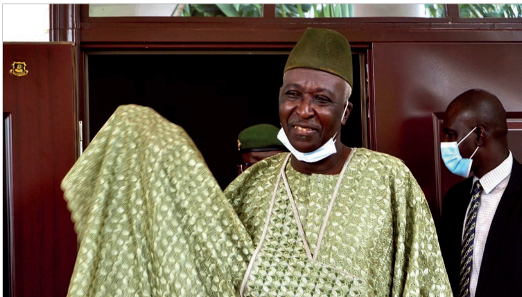
Временный президент Мали Ба Ндао

определен Ба Ндао, который с 2014 года и до момента путча занимал пост министра обороны, а ранее обучался в военном училище в СССР, где получил квалификацию пилота вертолета. Руководители М5-RFP поддержали данное назначение. Выбор Б.Ндао приветствовал также религиозно-политический лидер Мали Махмуд Дико - глава влиятельного оппозиционного «Движения 5 июня - Объединения патриотических сил». Председатель НКСН А.Гоита был назначен вице-президентом, а дипломат Моктар Уан - премьер-министром.