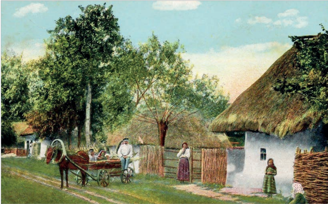
Деревня Жуки, Полтавщина

После защиты территориальной целостности Австрийской империи в 1849 году и спасения этого государства от пожара революции войсками Николая I Вена пошла на смягчение языковой политики в Галиции в пользу общерусского. Но уже в ходе Крымской войны (1853-1856 гг.) подходы австрийского императора Франца-Иосифа вновь изменились: прорусская идентичность русинов, или рутенов, как называли в Австро-Венгрии местное население Галиции (от латинского названия Киевской Руси - Ruthenia), стали пытаться трансформировать, ополячить в угоду польскоязычной знати, имевшей на этой территории большой вес. Польские националисты стали ситуативными союзниками австрийцев против местного русофильского населения в Галиции.