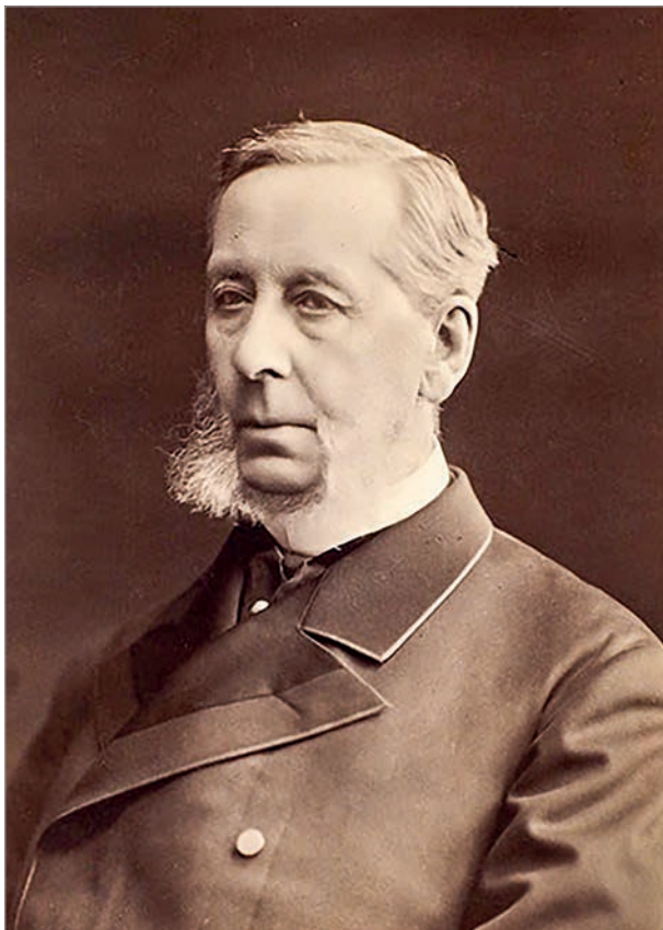
Министр внутренних дел Российской империи П.А.Валуев

Любопытно, что либерально настроенный русский писатель Н.Г.Чернышевский в 1861 году поддерживал упомянутый австрийский курс. Например, он жестко критиковал пророссийскую и антипольскую направленность русинской газеты «Слово», издававшейся во Львове. По его мнению, «поляки в течение 400 лет угнетали малорусскую народность в Галиции, а под австрийской властью она воскресла». Якобы «в землях, населенных малорусским племенем, натянутость отношений между малороссами и поляками основывалась не на различии национальностей или вероисповеданий; это просто была натянутость сословных отношений между поселянами и помещиками». При этом, как писал западник Чернышевский, «судьба остальной части малорусского племени (т. е. в Малороссии. - В.К.) устроена и обеспечена так превосходно, что об этой остальной части нам нечего заботиться, да и сама она не чувствует нужды иметь о себе никаких забот. Нашим русским малороссам даны все права и выгоды, каких только когда-либо желали они» 21 .