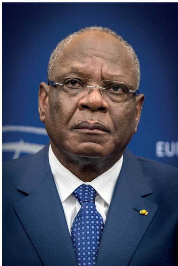
Президент Мали Ибрагим Бубакар Кейта (2013-2020 гг.)

Слабость государственной власти в Мали, помимо прочего, объяснялась криминализацией малийской бюрократии, чиновничьим произволом и коррупцией. Уже с первых месяцев правления Кейты стало понятно, что малийская государственность все также страдает от столь типичных для африканских государств недугов - взяточничества, клановости и nepотизма. Обеспечивая себе административные «тылы», президент интегрировал во властные структуры своего сына и родственников своей жены. В административной вертикали быстро продвигались чиновники из числа родоплеменной клиентелы президента. Пользуясь безнаказанностью, чиновники «приватизировали» власть и использовали ее для личного обогащения. Международная