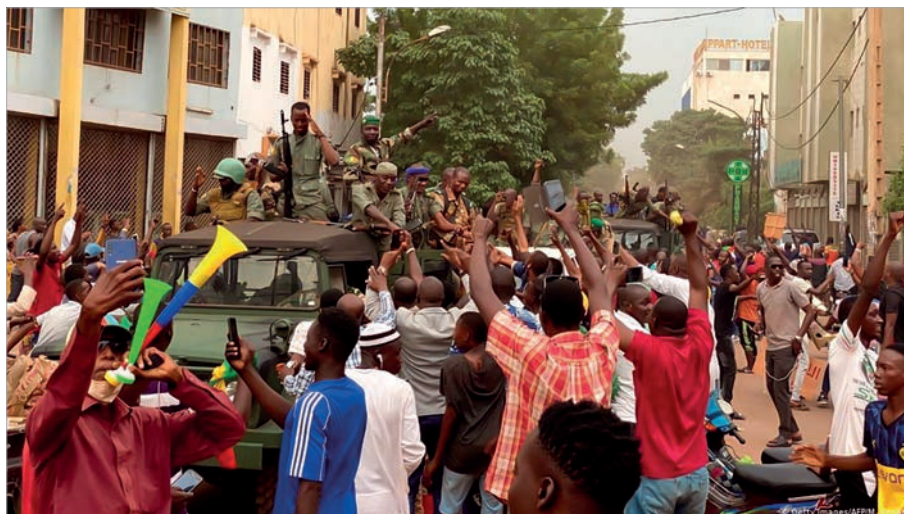
На улицах Бамако

что грядущий кризис может уничтожить «хрупкие режимы» в Сахеле и Центральной Африке. Они сочли, что коронавирус может стать «политическим вирусом, который... покажет неспособность этих государств защитить свое население».