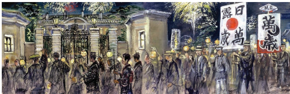
Шествие за дружбу с Россией перед зданием российского посольства в Токио в июле 1916 г.

Вполне естественно, что попытки определенных кругов сорвать советско-японские переговоры породили глубокое недовольство японской общественности. Правящая Либерально-демократическая партия не может игнорировать этого и пытается найти выход из создавшегося положения путем посылки в Москву премьер-министра Хатоямы для завершения переговоров. Японская общественность приветствует предстоящую поездку премьер-министра» 3 .