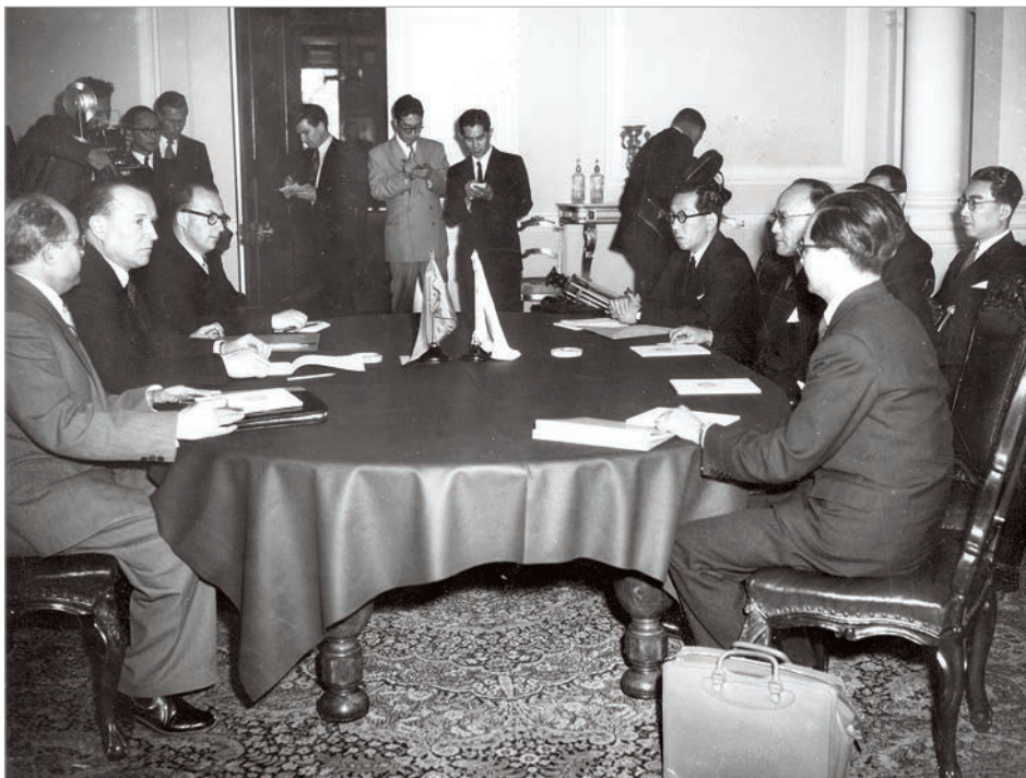
Переговоры между СССР и Японией

Токио был к этому времени заключен военно-политический договор. По воспоминаниям очевидцев, создавалось впечатление, что подобное неясное положение может сохраняться еще долгое время, поскольку «шаг навстречу» Советскому Союзу рассматривался как серьезный отход от союза с Вашингтоном и, чтобы сделать такой шаг, японскому политическому руководству требовалось проявить известное мужество. Тем не менее он был сделан в октябре 1956 года 2 .