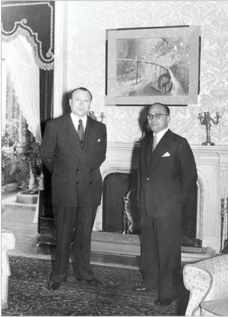
Руководители делегаций на советско-японских переговорах о нормализации отношений Я.А.Малик и С.Мацумото

сообщение о перерыве советско-японских переговоров «произвело на японский народ мрачное впечатление» 4 , а газета «Йомиури» от 21 марта, отражая эти настроения, советовала, чтобы «политические деятели в ближайшее время нашли путь к возобновлению переговоров» 5 .