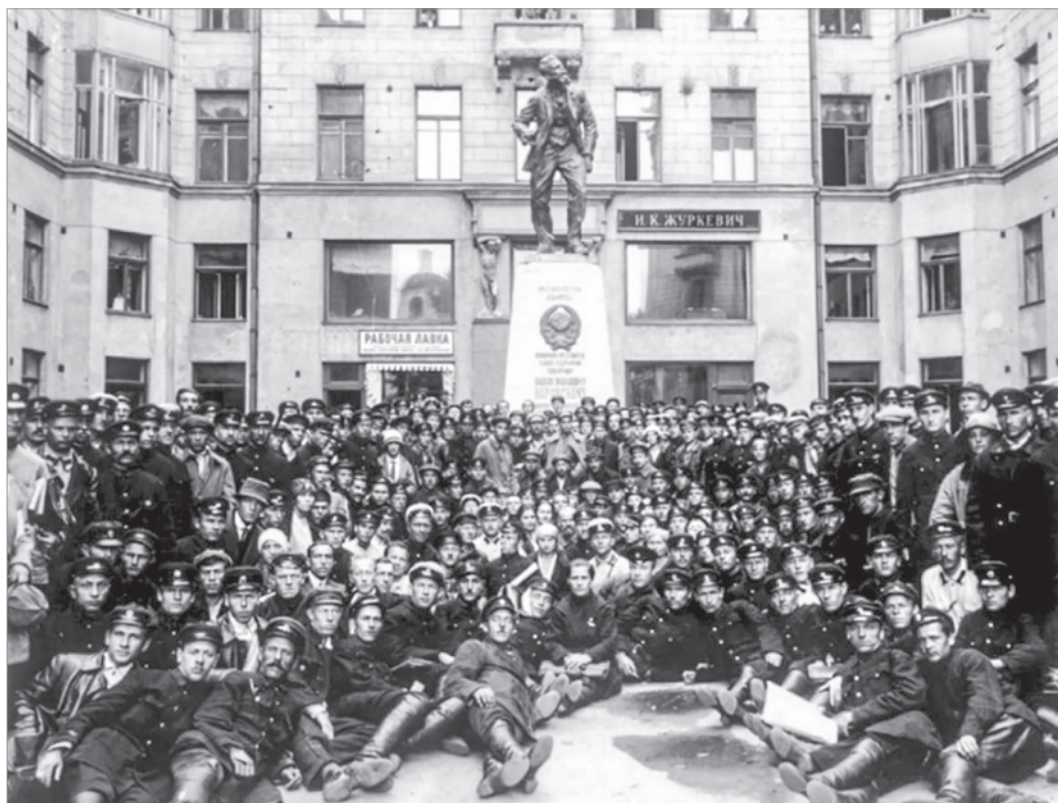
Сотрудники НКВД возле здания Наркомата

24 августа отмечается 102-я годовщина со Дня образования ГлавУпДК при МИД России. Уже более века Предприятие вносит неоценимый вклад в развитие международных связей нашей страны с зарубежными государствами, оказывая гостеприимный прием в Москве главам и сотрудникам дипломатических и других иностранных представительств, международных организаций, средств массовой информации, иностранных коммерческих компаний. Такой результат был бы невозможен без кропотливой работы и неустанной любви сотрудников к своему делу.