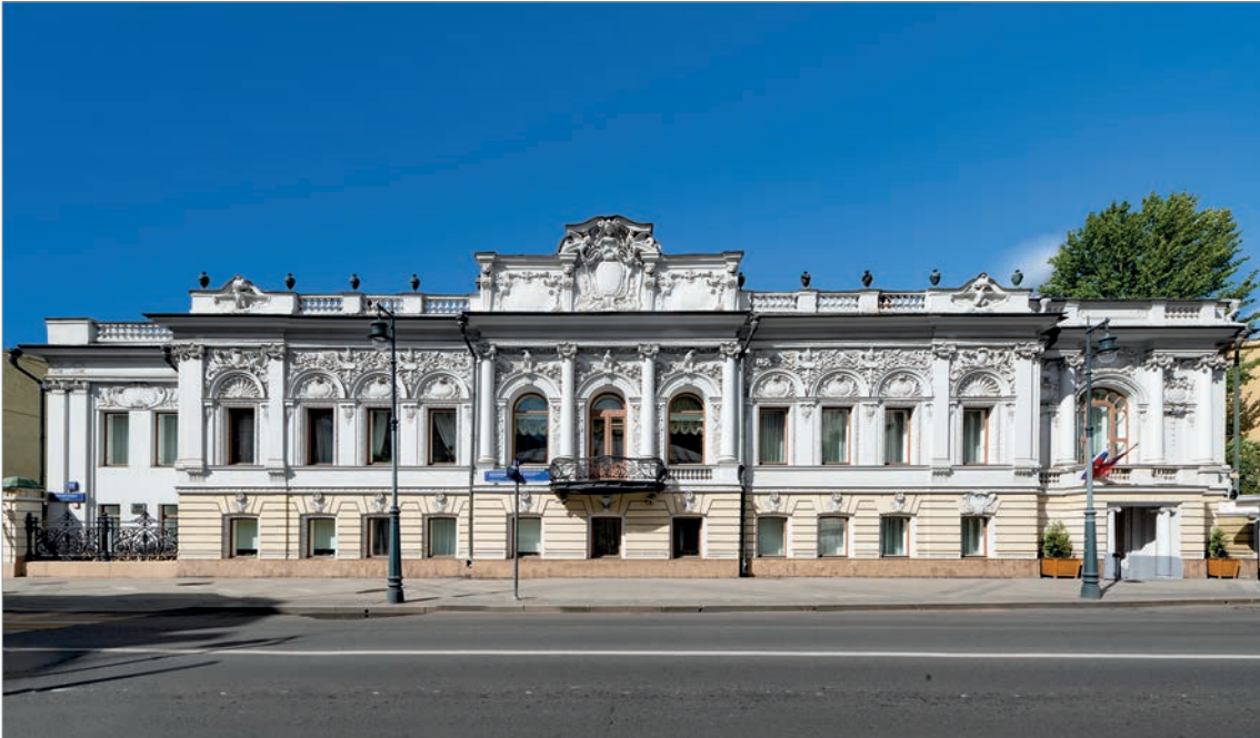
Обононяк генерала А.П.Ермолова - г. Москва, ул. Пречистенка, д. 20

Своей деятельностью ГлавУпДК вносит посильный вклад в сохранение исторического облика столицы, возвращая первоначальный вид старинным особнякам, Предприятие сохраняет московскую старину. В ведении ГлавУпДК более 130 памятников архитектуры, в которых в основном размещаются