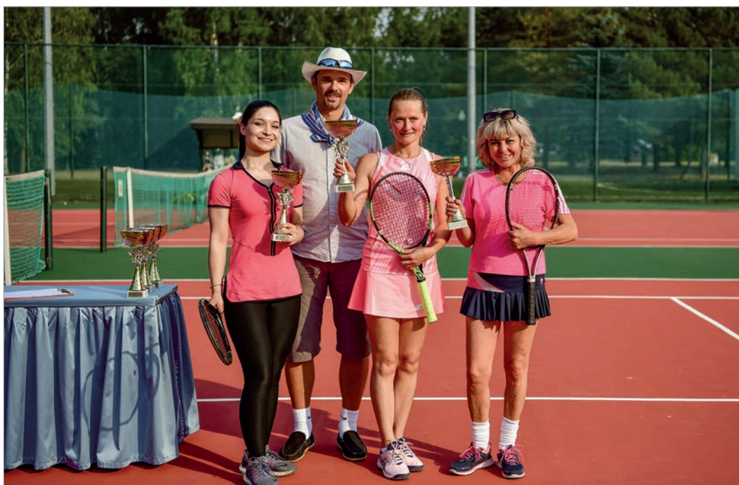
Летние дипломатические игры

Одна из значимых задач Предприятия - знакомство иностранцев с многообразием и богатством российской культуры. Сотрудники ГлавУпДК предпринимают максимум усилий по созданию для работников дипломатических и других иностранных представительств комфортных условий для работы и жизни в России как в плане обеспечения служебными и жилыми помещениями, так и в части оказания широкого комплекса разнообразных услуг.