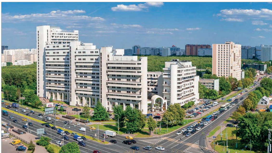
Многофункциональный комплекс «Парк Плейс Москоу»

Сегодня ГлавУпДК - крупнейший и самый опытный игрок на рынке аренды московской недвижимости. В ведении Предприятия находится более 1 млн кв. метров жилой и офисной недвижимости, в том числе около 7 тыс. квартир в престижных районах Москвы, четыре многофункциональных комплекса в престижных районах столицы: «Парк Плейс Москоу», «Добрыня», «Пять прудов», «Донской Посад». Услугами организации пользуются не только иностранные дипломаты, но и российские юридические, частные лица.