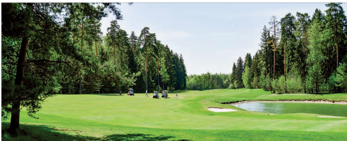
Гольф-клуб «Москоу Кантри Клуб»

Организация проводит мероприятия для зарубежных дипломатов и их семей, знакомит с русскими традициями, культурой, национальными особенностями. Это позволяет сблизить людей разных национальностей, служит