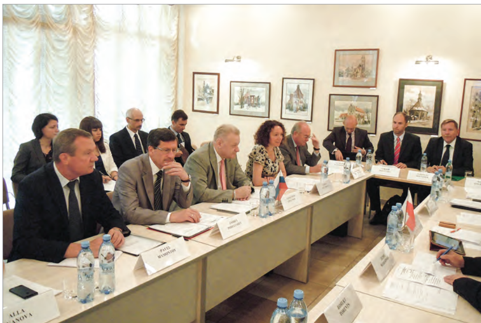
Российско-польские консультации по применению Соглашения между Правительством Российской Федерации и Правительством Республики Польша о порядке местного приграничного передвижения. Представительство МИД России в Калининграде. 8-9 июля 2013 г.

сийско-польского постоянного комитета по транспорту, Смешанной российско-литовской комиссии по рыбному хозяйству, Смешанной комиссии России и Евросоюза по рыболовству в Балтийском море, Смешанной норвежско-российской комиссии по рыболовству и др.