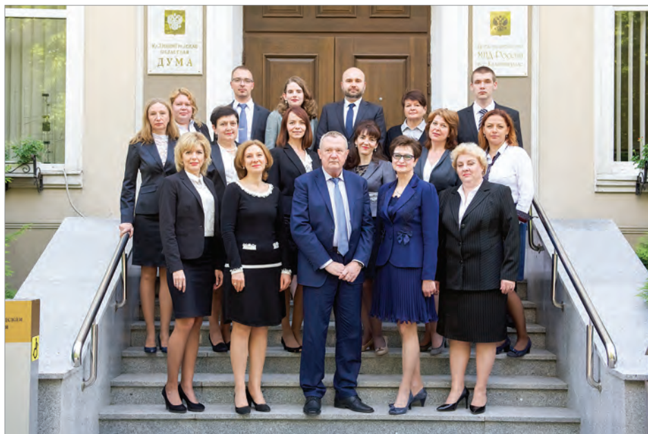
Коллектив сотрудников Представительства МИД России в Калининграде. Главный вход в здание. 9 июня 2017 г.