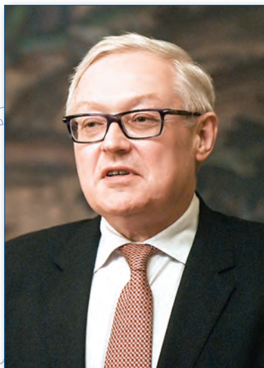
Сергей РЯБКОВ Заместитель министра иностраннных дел России