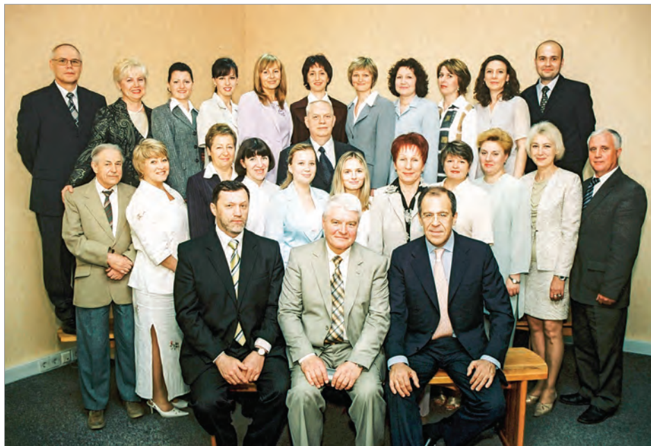
Министр иностранных дел России С.В.Лавров (справа), представитель МИД России в Калининграде С.В.Безбережьев (слева), глава администрации (губернатор) Калининградской области В.Г.Егоров (в центре) и коллектив сотрудников калининградского Представительства МИД России. 27 мая 2005 г.

представительства, в котором получили консультации несколько тысяч граждан России и иностранцев.