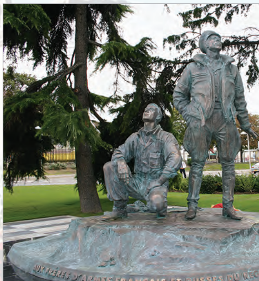
Памятник летчикам авиаполка «Нормандия - Неман» в пригороде Парижа Ле Бурже (Франция)