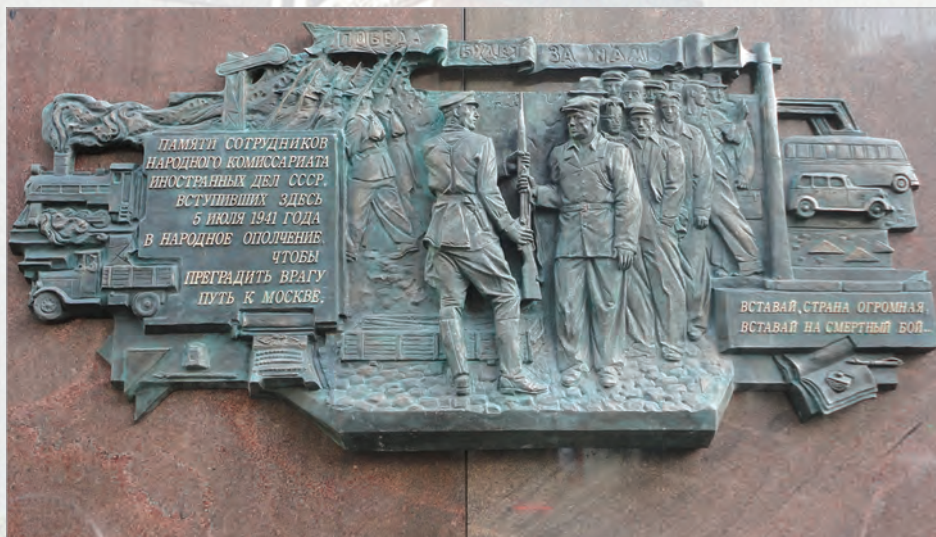
Мемориальная доска в честь сотрудников Народного комиссариата иностранных дел (НКВД) СССР - участников народного ополчения 1941 г.

Помню, как несколько лет назад во французском посольстве в Москве глава дипломатической миссии Жан-Морис Рипер вручал