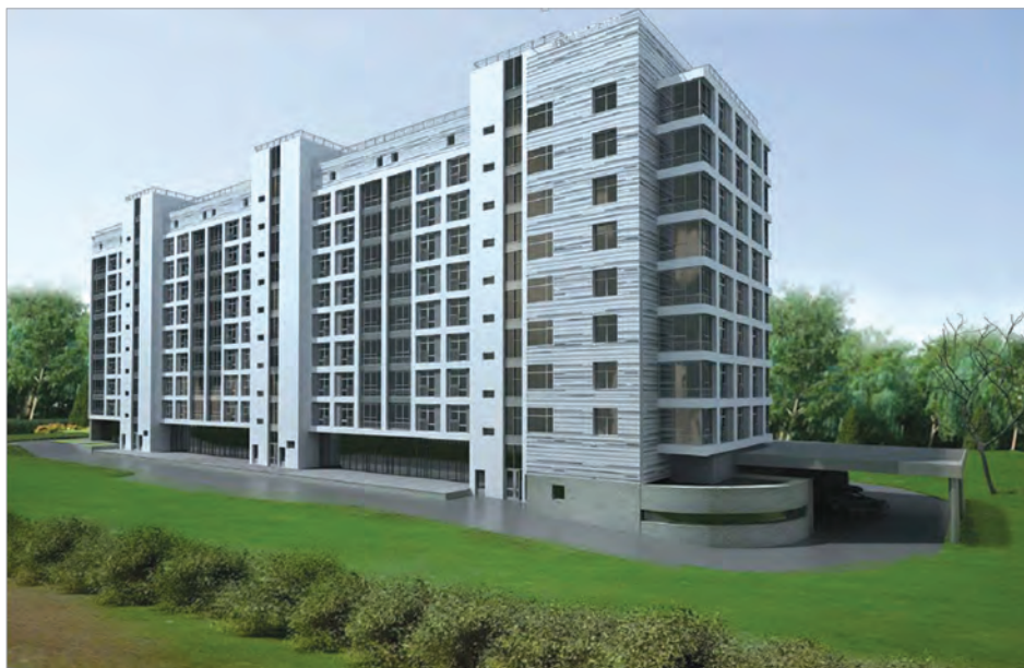
Строящийся объект на ул. Мосфильмовская, д. 42

В хозяйственном ведении ГлавУпДК при МИД России находятся 113 уникальных особняков в Москве, большинство из которых являются бесценными памятниками истории и культуры, имеющими статус объектов культурного наследия федерального и регионального значения. В большинстве исторических особняков размещаются посольства иностранных государств. В связи с этим ГлавУпДК при МИД России постоянно решает двойную задачу: обеспечить иностранным посольствам и дипломатам соответствующие их статусу условия для пребывания и деятельности в столице Российской Федерации, а также сохранить в надлежащем состоянии бесценные памятники истории и культуры.