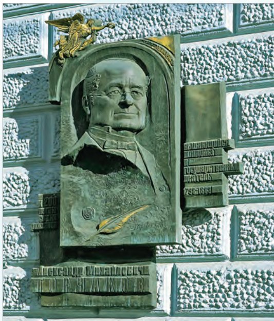
Мемориальная доска, посвященная А.М.Горчакову (1998 г.)

награды за особый вклад в развитие добрых связей между Россией и Францией. Знак отличия кавалера ордена Министерства культуры