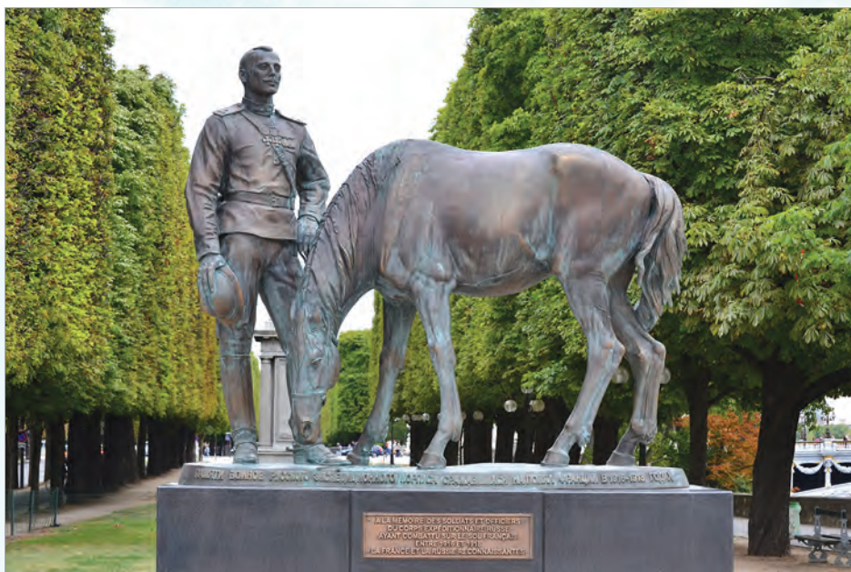
Памятник воинам Русского экспедиционного корпуса, сражавшимся во Франции в 1916-1918 гг.