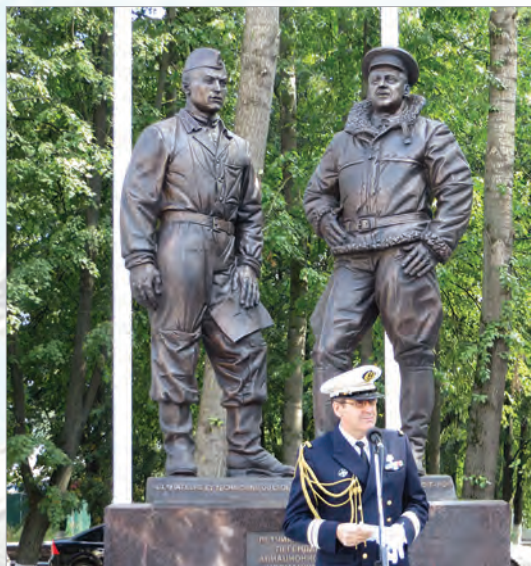
Памятник авиаэскадрилье «Нормандия - Неман» в Иванове

В этом смысле характерен открытый в сердце Парижа памятник В.Суровцева солдатам и офицерам Русского экспедиционного корпуса, направленного на помощь