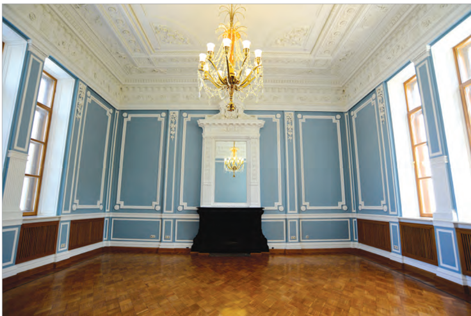
Леонтьевский пер., д. 4 после реставрации

Сложнейшие задачи пришлось выполнять Бюробину в годы Великой Отечественной войны. В октябре 1941 года, когда ударные части вермахта вышли на подступы к Москве, в столице было вве-