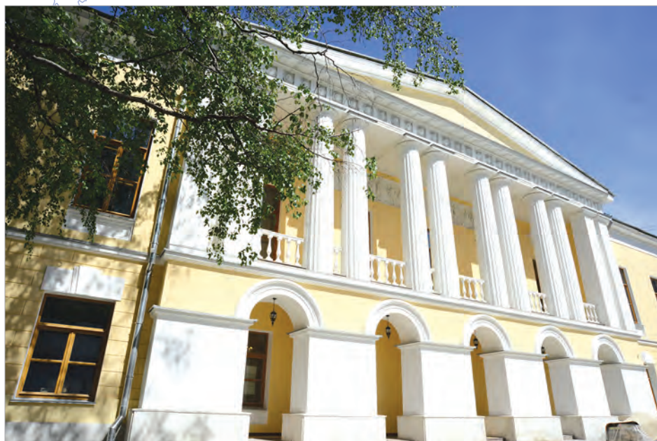
Леонтьевский пер., д. 4 после реставрации

В нынешнем году Главному управлению по обслуживанию дипломатического корпуса при Министерстве иностранных дел Российской Федерации исполняется 95 лет. Все это время ГлавУпДК при МИД России с честью выполняет возложенную на него задачу по размещению и обслуживанию иностранных дипломатических представительств в соответствии с международными обязательства-