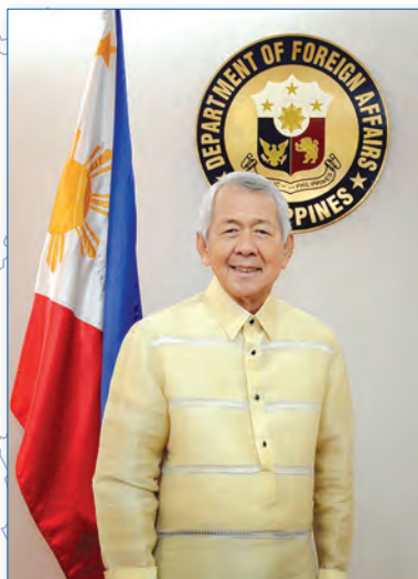
Перфекто Р. ЯСАЙ-мл.

Министр иностранных дел Республики Филиппины