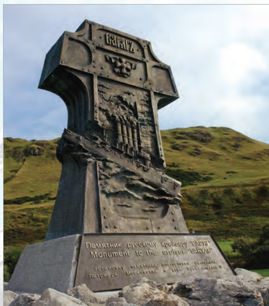
Памятник крейсеру «Варяг» (Шотландия)