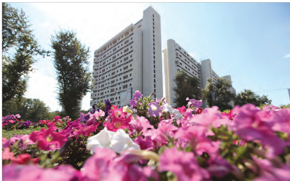
Построенный в 1992 г. Главным управлением первый в Москве МФК - «Парк Плейс Москоу», Ленинский пр., д.113/1

Управление по обслуживанию дипломатического корпуса (УпДК)», а 17 сентября утверждается «Положение об УпДК при МИД СССР». В распоряжение УпДК были переданы 47 зданий зарубежных посольств и миссий, которые раньше арендовались у Мосгорисполкома.