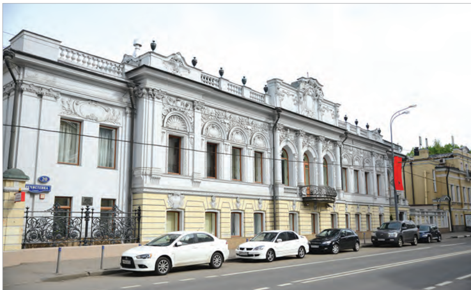
Офис ГлавУпДК при МИД России, ул. Пречистенка, д.20

14 июля 1947 года И.В.Сталин подписал постановление Совмина СССР «О реорганизации Бюро по обслуживанию иностранцев в