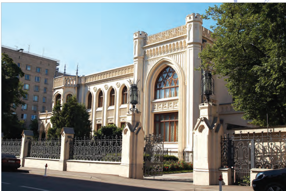
Дом приемов МИД России, ул. Спиридоновка, д.17

Россия никогда не была страной, закрытой для иностранцев. Само географическое положение России в центре евразийского материка определило ее открытость внешнему миру и готовность приветствовать пришедших с добром гостей из ближних и дальних стран. Неудивительно, что забота об удобстве и безопасности по-