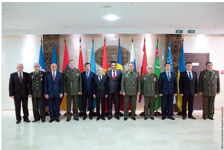
Главы делегаций на 64-м заседании Совета министров обороны СНГ

Несколько позже, рассказывая аккредитованным журналистам о российско-белорусском военном сотрудничестве, С.Шойгу сообщил, что военная делегация во главе с главнокомандующим Военно-воздушными силами Вооруженных сил РФ прибудет в Белоруссию для подбора аэродрома, на котором будет действовать российская авиабаза.