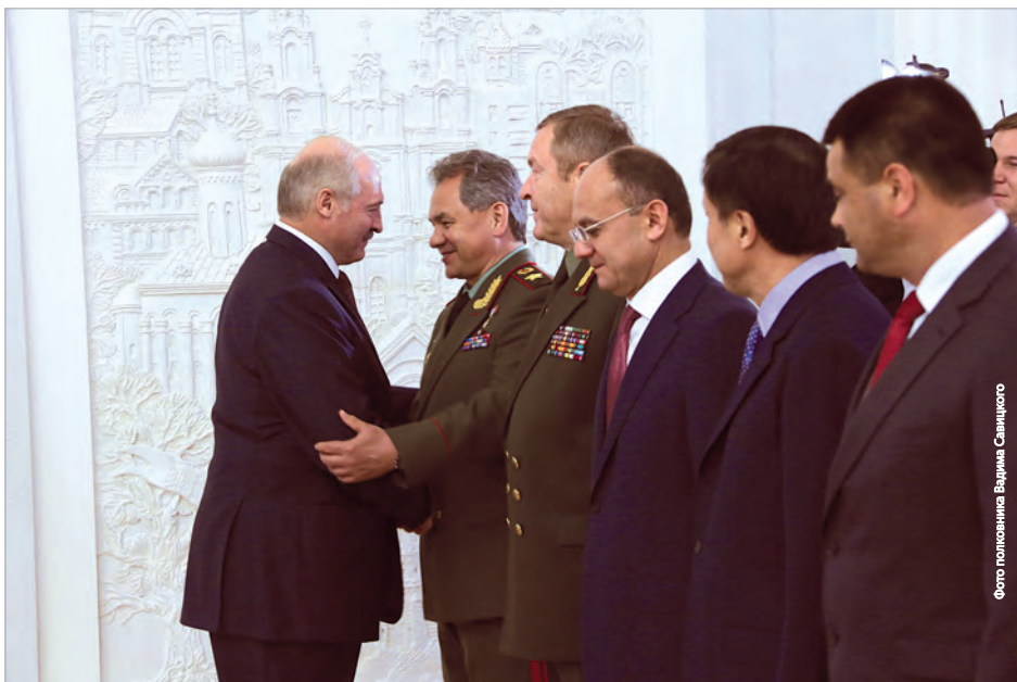
Встреча в резиденции Президента Республики Беларусь

Глава российского оборонного ведомства также отметил, что это будет совместная база Республики Беларусь и Российской Федерации.