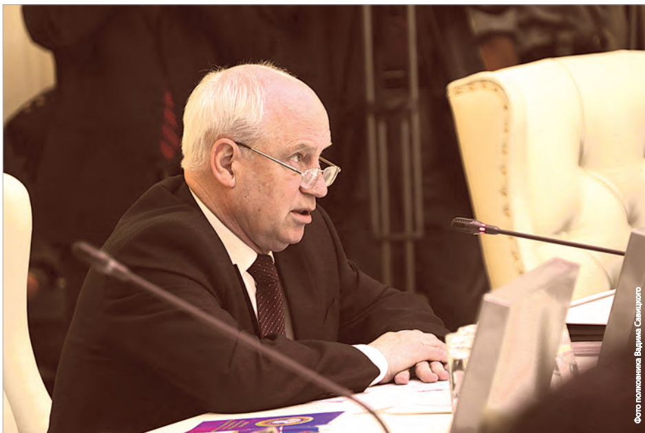
Обращение председателя Исполнительного комитета - исполнительного секретаря СНГ Сергея Лебедева к участникам многосторонней встречи

за состоянием боеприпасов, существовавшая в Вооруженных силах СССР, нарушена. В связи с этим актуальным является обмен информацией о номенклатуре боеприпасов, которые подлежат утилизации.