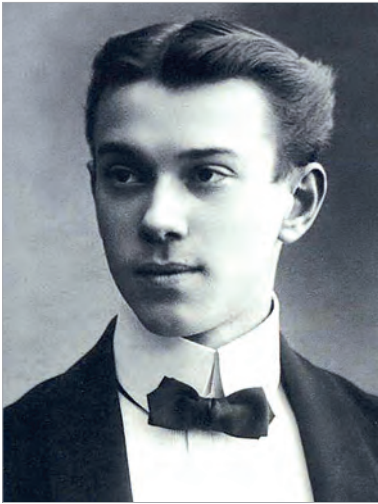
Нижинский Вацлав Фомич

часть его - современный рамплис-саж... в самых интересных моментах, в самых живых местах сцены Стравинский пишет не музыку, а нечто, что могло бы блестяще иллюстрировать момент. Но раз он в самых ответственных местах не может сочинить музыку, а затыкает их чем попало, то он музыкальный банкрот».