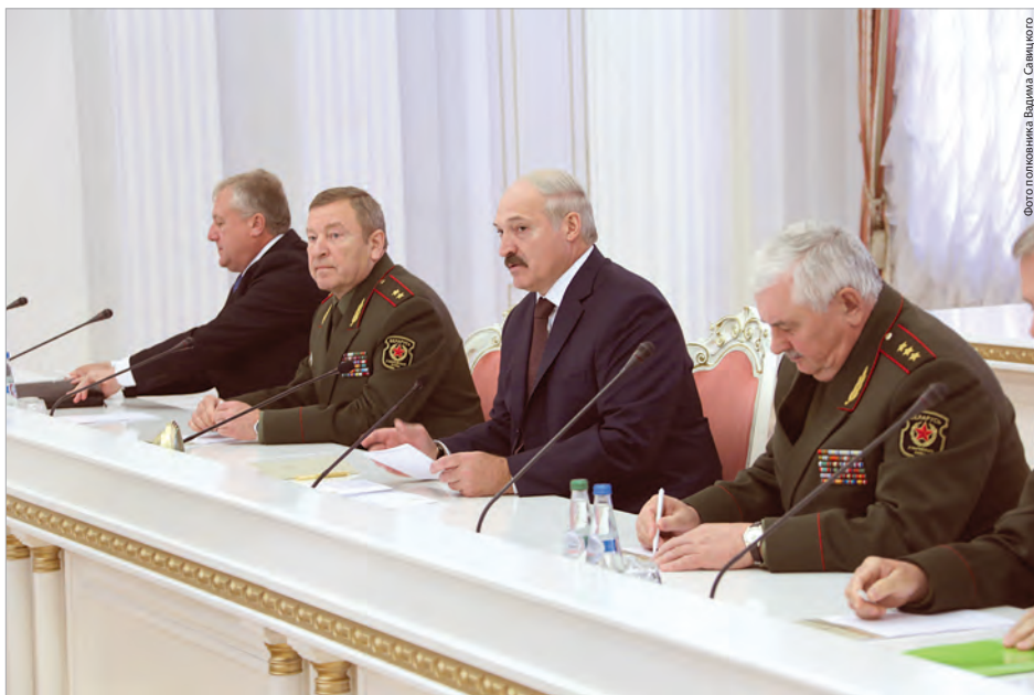
Выступление председателя Совета глав государств СНГ, Президента Республики Беларусь Александра Лукашенко

В следующем году будут организованы командно-штабные тренировки с органами управления и дежурными силами Объединенной системы противовоздушной обороны (ОС ПВО) СНГ, с оперативно-прогностическими органами гидрометеорологических служб вооруженных сил государств - участников (ВС ГУ) СНГ, по связи и использованию каналов взаимосвязи между министерствами обороны стран Содружества, а также совместная тренировка войск по восстановлению имитостойкого режима работы опознавания Единой системы государственного радиолокационного опознавания «Пароль».