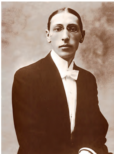
Стравинский Игорь Федорович

Стравинский прожил долгую и бурную жизнь. За 88 лет, отпущенных ему судьбой, он объездил весь мир, видел и знал многое и многих. Его интересы не ограничивались только музыкой. Философия и религия, эстетика и психология, математика и история искусств - все попадало в поле его зрения, он во всем стремился разобраться как специалист. Его не страшили далекие путешествия,