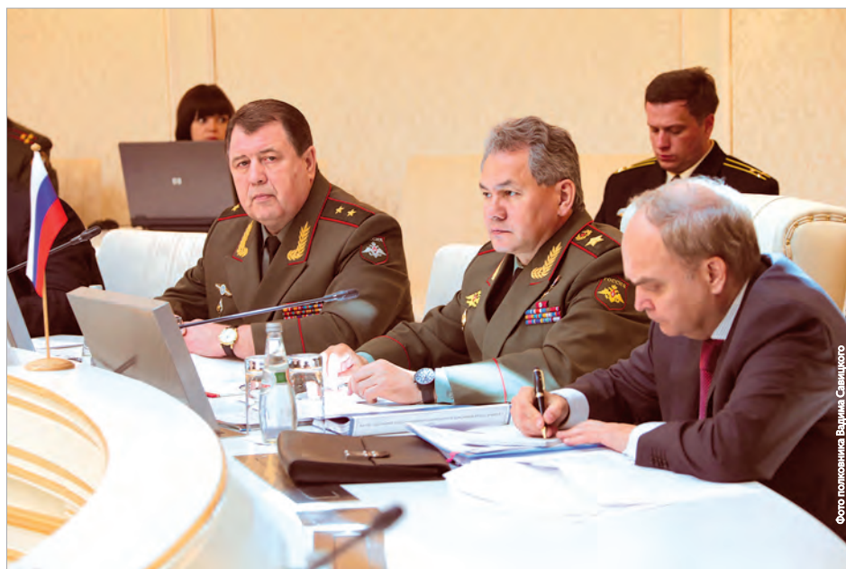
Заседание состоялось под председательством министра обороны России генерала армии Сергея Шойгу

Как прокомментировал секретарь Совета министров обороны СНГ Александр Синайский, контроль за безопасным содержанием и использованием боеприпасов остается одной из важных тем для обсуждения. Это связано с накоплением в советский период на объектах хранения современных государств СНГ значительных запасов боеприпасов, которые частично или полностью выслужили установленные сроки службы. В настоящее время единая система контроля