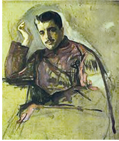
Дягилев Сергей Павлович

сам же отвечал: «На это можно ответить, что художественные произведения возникают по воле или согласно вдохновению их авторов, а вдохновенность «Петрушки» настолько ясна, что Париж, чуткий ко всему подлинному, просто принял «эти потешные сцены» потому, что не принять нечто столь яркое, но жизненное - просто не в его обычаях. Правда, многие как-то опешили, но опешенность переходит в энтузиазм - на этом слове я настаиваю».