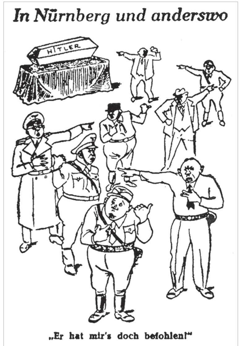
На австрийской карикатуре 1946 г. написано: «В Нюрнберге и других местах. «Однако приказывал мне он!»

Образованное при участии советских оккупационных властей временное правительство новой Австрии во главе с канцлером К.Реннером продолжило процесс денацификации под контролем союзников. Уже 8 мая 1945 года был принят австрийский закон о запрете НСДАП и всех связанных с ней структур (Verbotsgesetz). Все лица, состоявшие в них в период с 1933 по 1945 год, подлежали регистрации. Они также лишались избирательных прав. Позднее, 26 июня 1945 года, вышел дополнительный закон о военных преступниках (Kriegsverbrechergesetz), который предусматривал уголовное преследование лиц за унижение человеческого достоинства, доносы и другие преступления национал-социалистов.