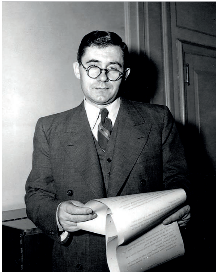
Посол СССР в США А.А.Громыко. 1943 г.

В 1943-1952 годах подготавливалась и осуществлялась первая послевоенная трансформация международных отношений. Вторая мировая война изменила соотношение сил в мире. Западные партнеры не были заинтересованы в усилении СССР. Непродолжительные попытки Ф.Д.Рузвельта наладить более тесные отношения с Советским Союзом, по всей видимости, основывались на предположении об ограниченности потенциала той или иной страны, важности определить общие правила игры. Однако любые масштабные цели в рамках тогдашней трансформации могли осуществляться только на основе частичного видоизменения доминировавших идеологических систем, что не являлось целью ни одного из партнеров. Знаменитое сталинское «[в]опрос о границах, или скорее о гарантиях безопасности наших границ на том или ином участке нашей страны, будем решать силой» [26, с. 157] из майской шифротелеграммы 1942 года наркому В.М.Молотову пусть и не ограничивало ва-