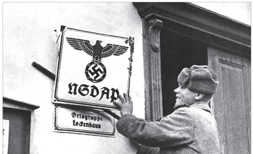
Красноармеец наводит порядок в Вене в апреле 1945 г.

В австрийских СМИ, особенно в связи с годовщинами окончания Второй мировой войны, регулярно появляются публикации, так или иначе подсвечивающие преступления нацизма. Австрийские политики различных уровней и политиче-