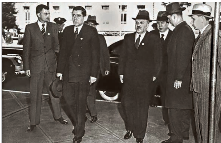
А.А. Громыко и В.М. Молотов на конференции по созданию ООН. Сан-Франциско, США. 1945 г.