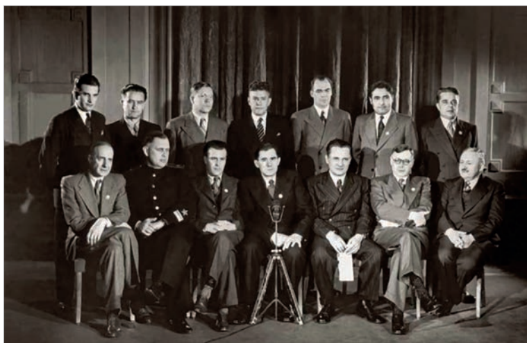
Делегация СССР на конференции по созданию ООН в Сан-Франциско с советниками и экспертами, июнь 1945 г.