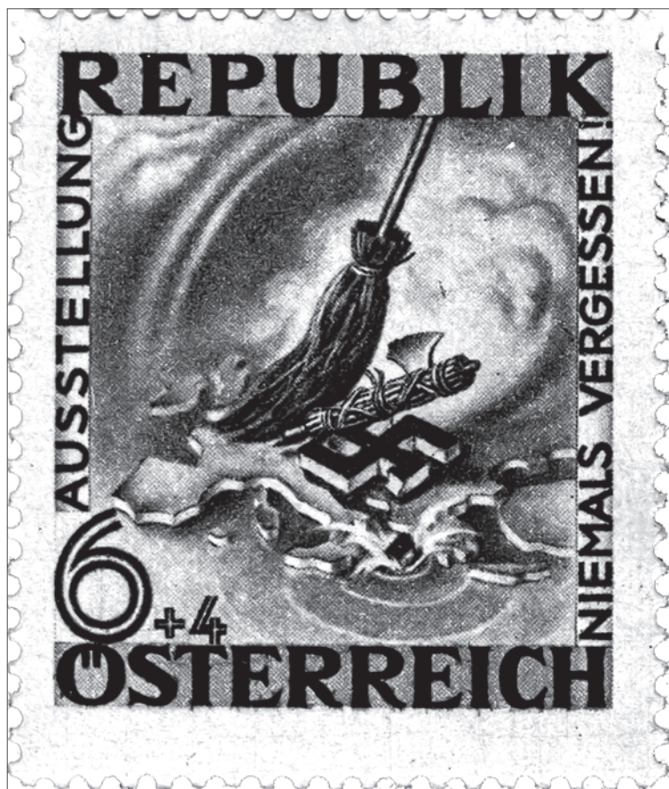
Австрийская почтовая марка 1946 г.

определенных кругах трансформировался в дремучую русофобию). В конечном счете это обстоятельство продлевало режим оккупации страны из-за высокого уровня взаимного недоверия.