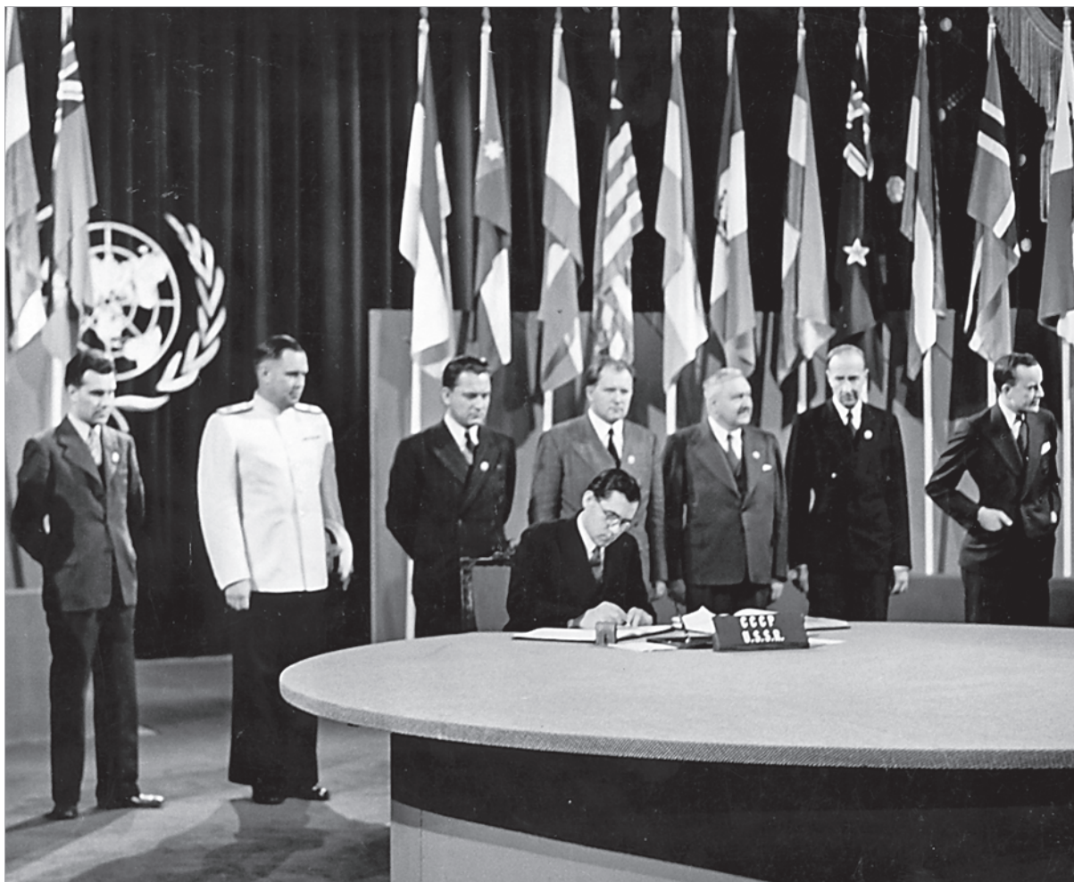
А.А.Громыко подписывает Устав ООН. 1945 г.

риативность и не запрещало тактические ходы, но по-иному расставляло приоритеты, объективно возводя безопасность, сохранение достижений социализма в стратегическую цель. В этой связи предложения американской стороны в незначительной степени соответствовали советскому стратегическому подходу.