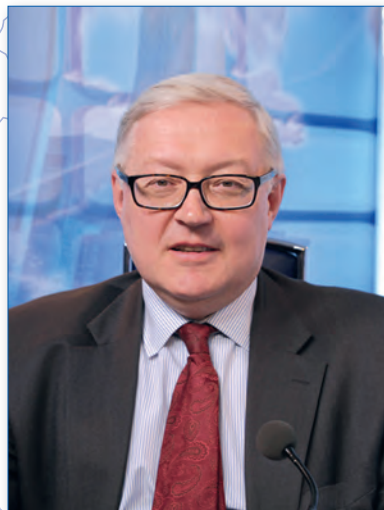
Сергей РЯБКОВ Заместитель министра иностраннх дел России