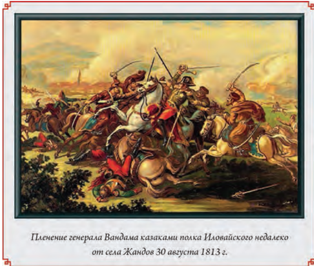
Пленение генерала Вандама казаками полка Иловайского недалеко от села Жандов 30 августа 1813 г.

Около полуночи Закржов был окружен целым батальоном казаков, которые вошли