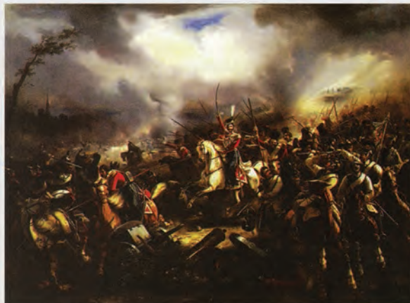
Казаки атамана М.И.Платова в Битве народов под Лейпцигом, 1813 год. Музей истории Донского казачества в Новочеркасске

Во время Заграничного похода русской армии 1813-1814 годов на территории Чехии произошло сражение под Кульмом, которому уделено в книге большое внимание. Эта битва повлияла на всю дальнейшую кампанию, практически навсегда развеяв надежды Наполеона на реванш после его неудачного похода в 1812 году в Россию и изменение хода событий в свою пользу. Именно казакам принадлежит заслуга в пленении наполеоновского генерала Вандама и разгроме его корпуса. «Вандам пытался перейти Ждирецкий ручей в местах с высокими и болотистыми берегами. Лошади взбирались по крутым склонам с большим трудом. В момент, когда Вандам перешел ручей и собирался начать подъем по склону горы, казаки и окружили его. На невысоких степных