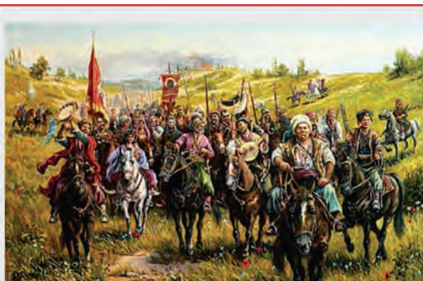
Казачи. Первая четверть XVIII века.

Особенно это проявилось в так называемый межвоенный период - в 1920-1930-х годах. Проповедовались часто взаимоисключающие идеи,