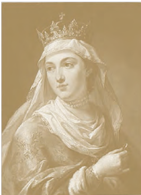
Ядвига Анжуйская. Портрет работы М.Бачиарелли. XVIII в.

Несомненный интерес представляет статья историка-медиевиста из Белоруссии В.А.Воронина о взаимоотношениях православных и католиков в Великом княжестве