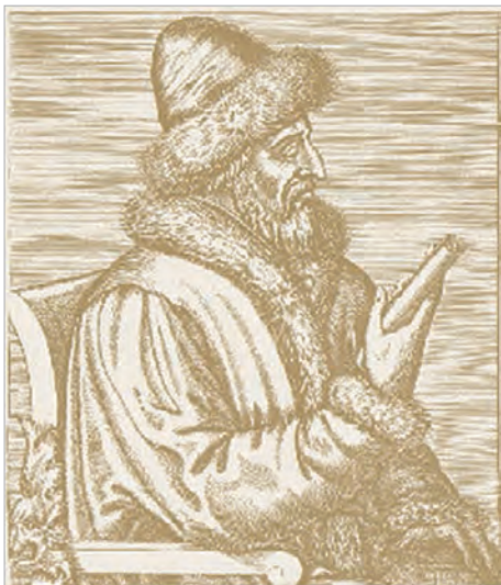
Иван III. Европейская гравюра XVI в.

доминиканских монастырей были православными. И вряд ли можно всерьез вести речь о каком-то принуждении их к постройке в своих вотчинах католических монашеских обителей. Судя по всему, это были их вполне добровольные и обдуманые действия. Как видно, у этих православных не было какой-то антипатии или тем более агрессии по отношению к католикам. Более того, есть немало вполне однозначных примеров того, что православная знать Великого княжества Литовского проявляла немалый и вполне искренний интерес к западному христианству», - утверждает белорусский ученый (с. 138). В.А.Воронин в своей работе приходит и к такому заключению: «Православные и католики в Великом княжестве Литовском довольно широко смотрели на проблему взаимоотношений между восточной и западной церквями, а также между их верующими. Они были очень далеки от черно-белого видения этих взаимоотношений. Контакты между конфессиями в нашей части Европы никогда не прерывались, а