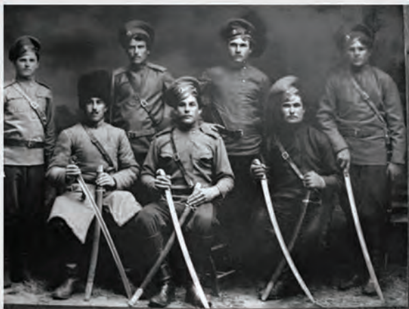
Донские казаки в униформе 1914–1920 гг.