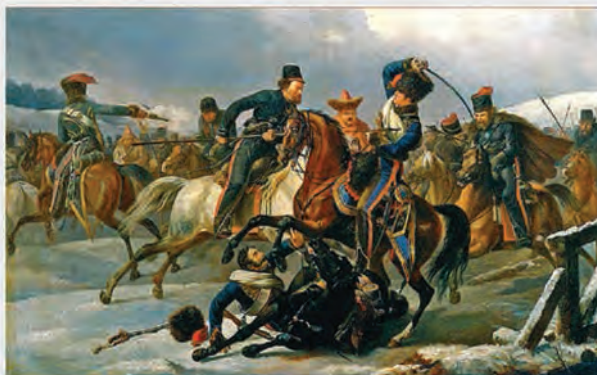
Бой казаков с французскими конными егерями

Авторы не оставили без внимания и «темные» пятна в истории казаков - их сотрудничество с гитлеровскими окку-