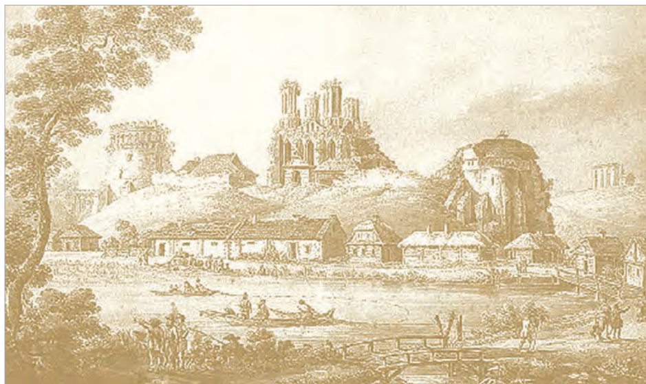
Острожский замок на старинной гравюре

Процесс ассимиляции выходцев из Московского княжества в Литве изучил белорусский