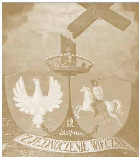
Плакат в память о Кревской унии. 1861 г.