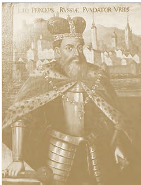
Князь Даниил Галицкий на фоне Львова. Портрет XVII в.

ходятся в крупнейших книгохранилищах и государственных архивах и доступны пока только посетителям десятка крупнейших российских библиотек. Есть проблема, которой следует уделить особое внимание. Дело в том, что в Интернете присутствие России достаточно фрагментарно. Отсутствуют ключевые документы по истории на русском языке. Этот пробел, как подчеркнул М.В.Баранов, и намерен восполнить «Руниверс».