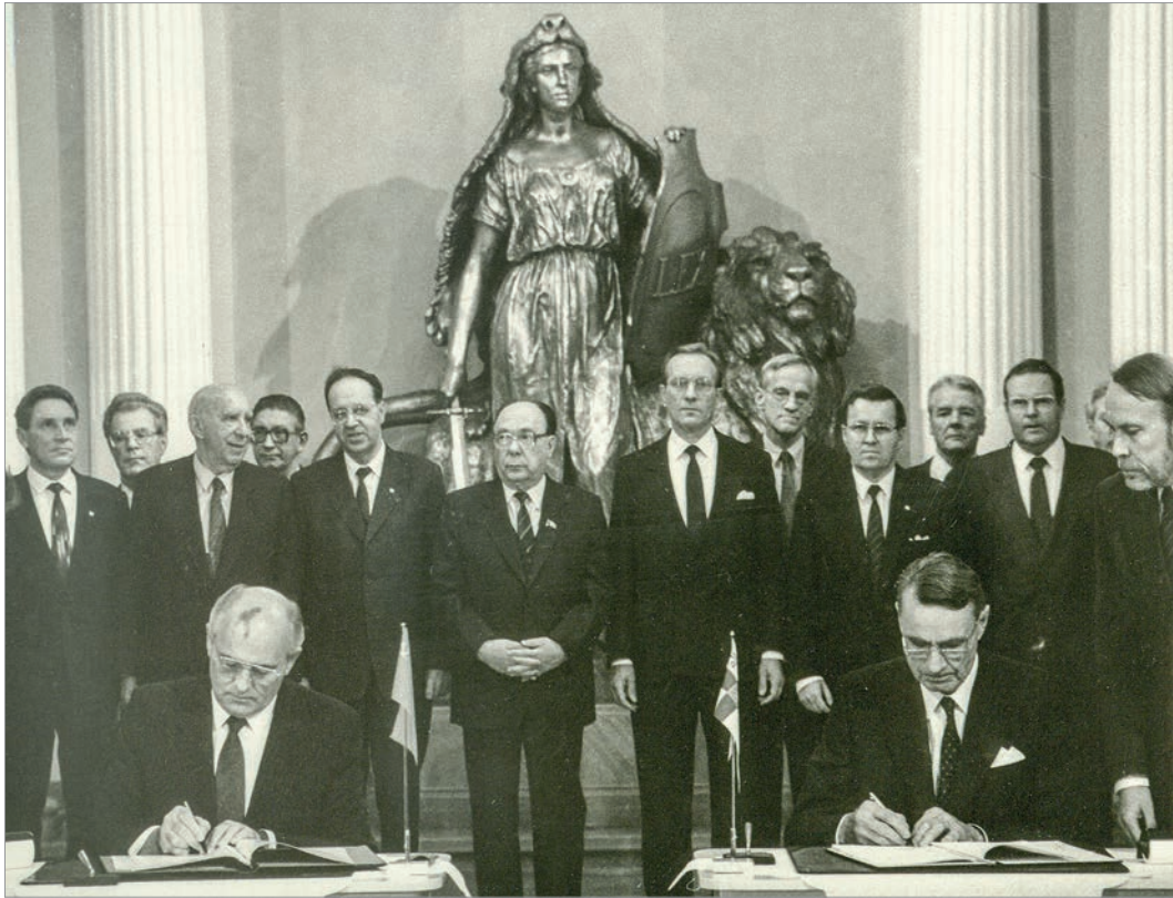
Подписание советско-финляндской декларации «Новое мышление в действии» Генеральным секретарем ЦК КПСС М.С.Горбачевым и Президентом Финляндии М.Койвисто. На втором плане (второй слева) - первый заместитель министра иностраннных дел СССР А.Г.Ковалев. г. Хельсинки, 26 октября 1989 г.

Вокруг него собирались поэты, писатели, композиторы, певцы, актеры, режиссеры - великие и знаменитые. Он с желанием выступал защитником и адвокатом Театра на Таганке, «Современника», Чингиза Айтматова, Солженицына. Дружил с Рождественским, Паулсом. Песни на его стихи исполняли Пугачева и Леонтьев.