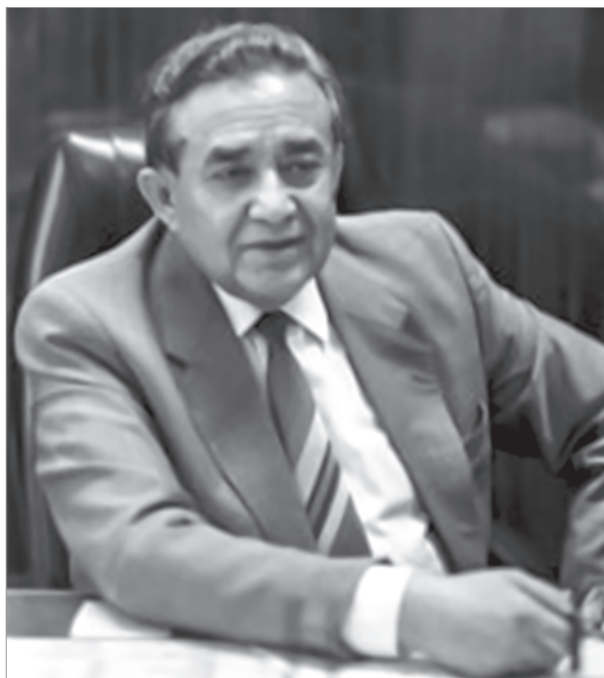
Сарвар Алимджанович Азимов

В республике же он член ЦК Компартии, депутат Верховного Совета. Наконец сбылась его заветная мечта - он удостоен высокой чести депутата Верховного Совета СССР, делегата XXVI съезда КПСС. По случаю 60-летия со дня рождения в 1983 году он получил в дополнение к «Заслуженному деятелю науки» (по случаю 50-летия) звание «Народного писателя Узбекистана». В том же году ему была присуждена Международная литературная премия «Лотос» Ассоциации писателей стран Азии и Африки, в которой он, будучи председателем советского комитета, являлся заместителем генерального секретаря.