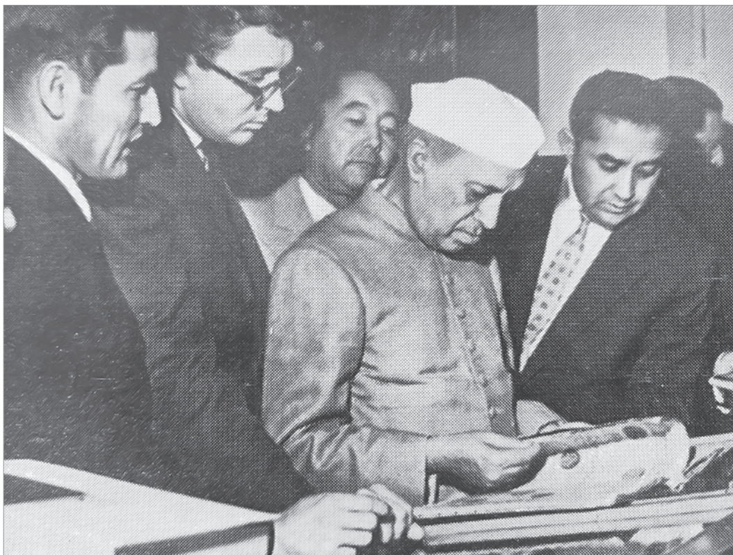
С премьер-министром Индии Джавахарлалом Неру. Ташкент, 1962 г.

К 100-ЛЕТИЮ САРВАРА АЛИМДЖАНОВИЧА АЗИМОВА