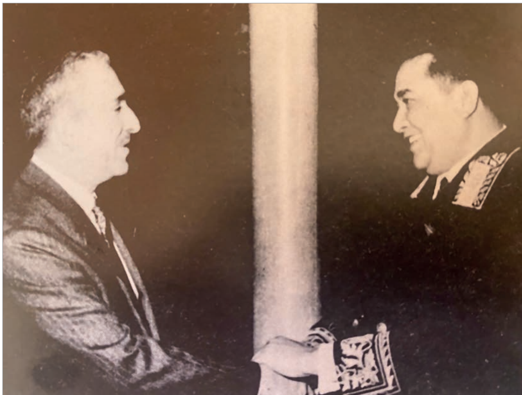
С премьер-министром Ливана Рашидом Караме. Бейрут, 1972 г.

К 100-ЛЕТИЮ САРВАРА АЛИМДЖАНОВИЧА АЗИМОВА