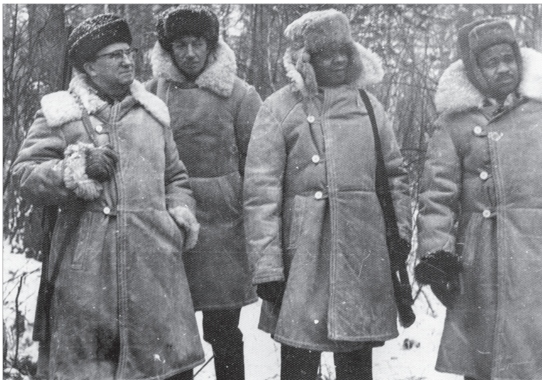
Дипломаты во время охоты в Завидове. 1966 г.

Более 30 лет комплекс вел успешную деятельность, а в середине 1990-х годов было принято решение о его расширении и реконструкции.