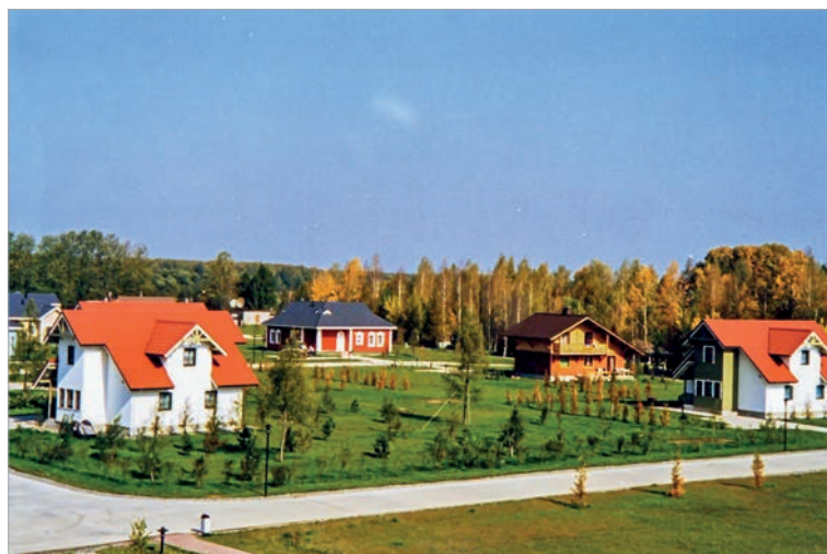
«Завидово». 1990-е гг.

«Завидово» предлагает востребованные гостями услуги. Работает бассейн с эффектом водопада, где вода плавно переливается из яруса в ярус. Широко известен банный комплекс на берегу Шоши с традиционной русской баней, финской сауной и уникальной процедурой «Конек-горбунок». Работает SPA с косметологическими процедурами, массажами, обертываниями и релакс-программами.