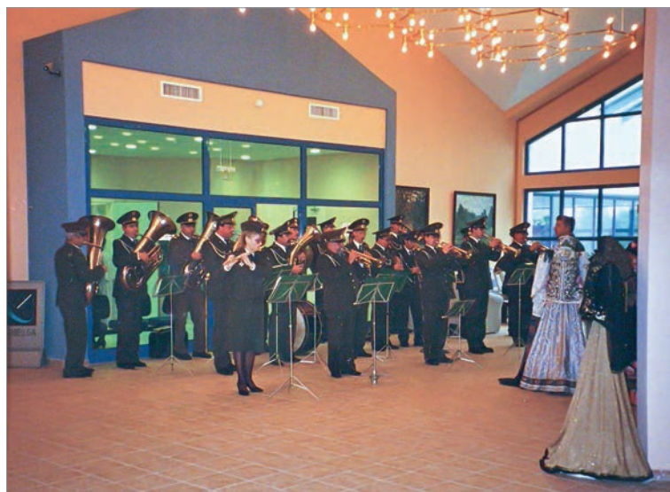
Торжественное открытие гостиницы. Сентябрь 1997 г.