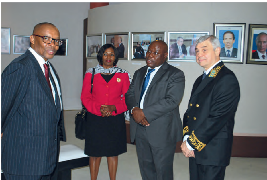
И.о. мининдел, министр обороны, юстиции и безопасности Ш.Кгати, ректор Ботсванского университета Т.Фако и посол Кении с послом РФ В.И. Сибилёвым на открытии выставки

отношений двух стран с использованием копий архивных документов и фотоматериалов, предоставленных Историко-документальным департаментом МИД России. На открытии выставки присутствовали и. о. министра иностранных дел и международного сотрудничества, министр обороны, юстиции и безопасности Ботсваны Ш.Кгати, министр образования Ю.Доу, представители МИД и других министерств и ведомств страны, дипкорпуса, местных СМИ, выпускники советских и российских вузов, соотечественники.