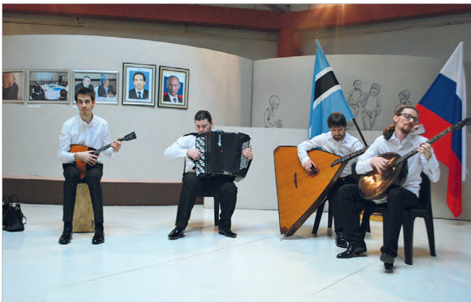
Выступление фольклорного ансамбля «Квнтет четырех» на открытии выставки

также посетили и «несторы» государственной и внешней политики Ботсваны, стоявшие у истоков установления наших дипотношений, - второй президент Ботсваны К.Масире и вышеупомянутая бывшая мининдел Республики Ботсвана Г.Чиепе. С их стороны был проявлен самый живой интерес к экспонатам с «их историческим участием» и выражена искренняя благодарность посольству за организацию выставки.