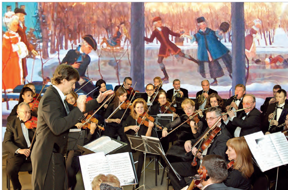
Симфонический оркестр радио «Орфей»

Востребованы и записи концертов Государственной академической симфонической капеллы России. Концерты цикла «Туманный Альбион» под управлением народного артиста СССР Геннадия Рождественского неоднократно транслировались в Швеции, Великобритании, Австрии, Испании, Хорватии, Эстонии, Республике Корея. Оперу Н.А.Римского-Корсакова «Ночь перед Рождеством» под управлением художественного руководителя капеллы народного артиста