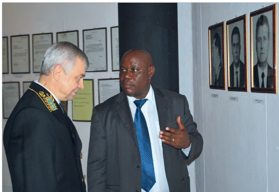
И.о. мининдел, министр обороны, юстиции и безопасности Ш.Кгати и посол России в Ботсване В.И.Сибилёв на открытии выставки. 5 марта 2015 г.

Примечателен и символичен тот факт, что по приглашению российского посла выставку, открытую для посетителей в течение двух недель,