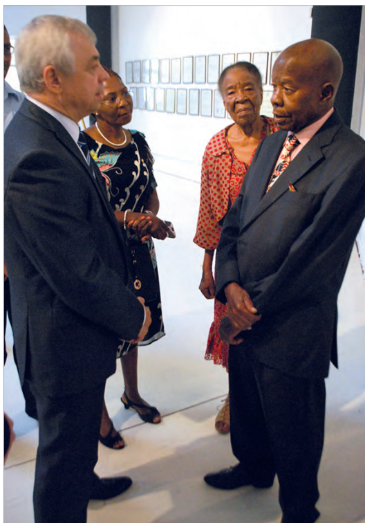
С «несторами» государственной и внешней политики Ботсваны - вторым президентом К.Масире и бывшим мининдел Г.Чиепе

Исторически так сложилось, что Ботсвана - с 1885 года территория, объявленная английским правительством по просьбе местных вождей протекторатом под названием Бечуаналенд, существовавшим вплоть до обретения независимости страны в сентябре 1966 года, - ориентирована на Великобританию. Разветвленные политические и