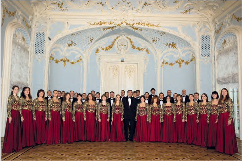
Академический Большой хор «Мастера хорового пения»

ских солистов и музыкальных коллективов, а другие радиостанции берут для трансляции понравившиеся им передачи.