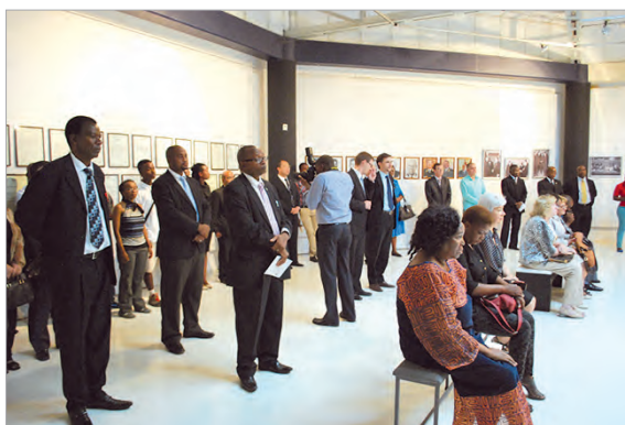
Открытие выставки, посвященной 45-летию установления дипотношений между Россией и Ботсваной, в Национальном музее Ботсваны. 5 марта 2015 г.

5 марта в городском Национальном музее посольство во взаимодействии с местным МИД и Министерством по делам молодежи, спорта и культуры Ботсваны подготовило и устроило выставку, посвященную истории и современному этапу развития