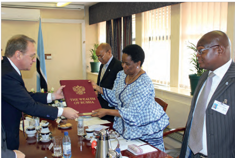
Заместитель министра иностранных дел России М.Л.Богданов вручает министру иностранных дел и международного сотрудничества Ботсваны П.Венсон-Моитои книгу «Богатство России»

щивать положительную динамику в торгово-экономической, гуманитарной и других сферах.