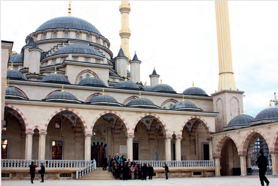
Мечеть «Сердце Чечни»

налистов, которые смело откликаются на все неудобные вопросы, периодически задают их Кадырову, и читатель, и зритель всегда получает ответы на них.