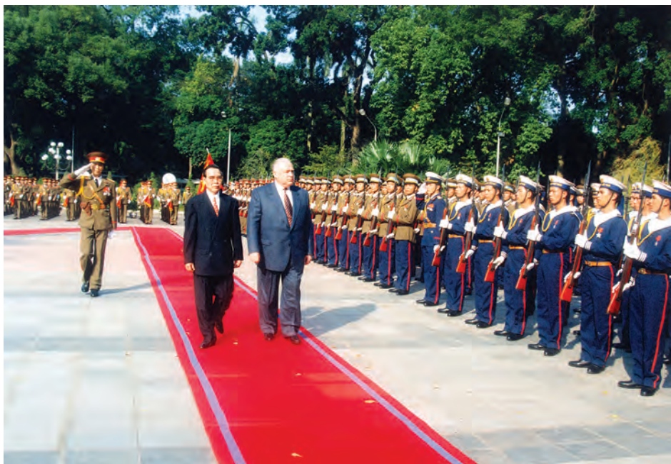
Официальный визит председателя правительства России в СРВ, 24 ноября 1997 г., г. Ханой

отношения с Североатлантическим альянсом. Непосредственно в день назначения, 14 апреля, НАТО нанесло удар по колонне албанских беженцев в Косове - погибло несколько десятков человек.