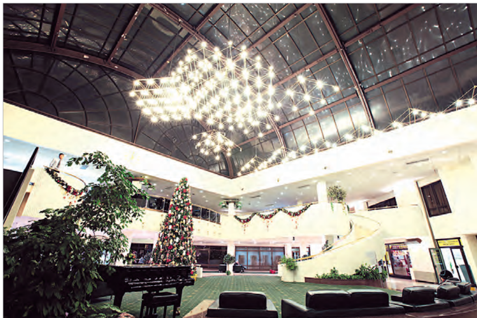
Атриум в МФК «Парк Плейс Москоу»

у комплекса удобное месторасположение на Ленинском проспекте, можно легко выехать на МКАД и быстро доехать до центра.