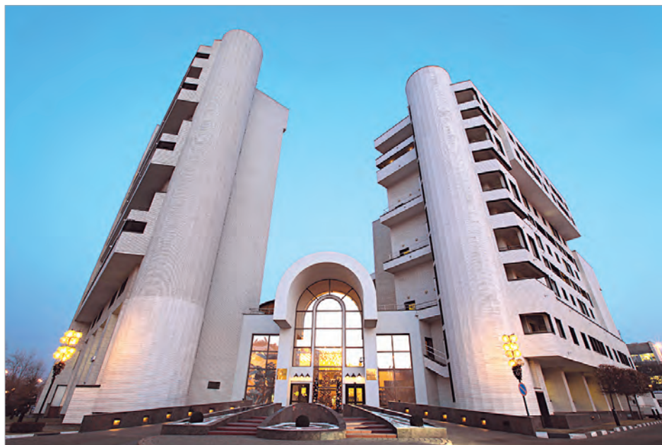
Многофункциональный комплекс «Парк Плейс Москоу» (Ленинский проспект, д. 113/1)

Особенностью данного комплекса являются двух- и трехуровневые квартиры. Такие уникальные планировки найти в Москве нелегко, тем более для аренды. Всего здесь около 200 квартир и 100 офисов, которые представляют собой помещения свободной