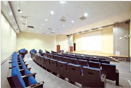
Конференц-зал в МФК «Добрыня» (4-й Добрынинский пер., д. 8)

Каждый год ГлавУпДК расширяет фонд недвижимости за счет строительства зданий более высокого класса - современных многофункциональных комплексов (МФК), которые представляют уникальный формат: аренду офисных и жилых помещений в одном здании.