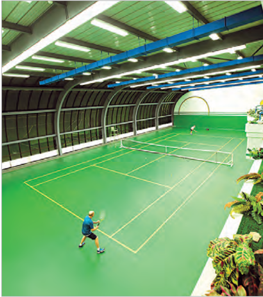
Ресторан и теннисный корт в МФК «Парк Плейс Москоу»

том: в многофункциональном комплексе не нужно никуда ездить. Дом, работа и фитнес-зал находятся в одном месте.