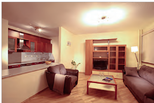
Квартира в МФК «Парк Плейс Москоу»

енный в Москве в 1992 году. Он был создан по западному образцу, еще на этапе проектирования для консультаций привлекались иностранные специалисты - до этого подобных проектов не было. Об этом говорит и внешний вид двух башен комплекса: они выполнены в редком для Москвы стиле неоконструктивизма. Здесь можно взять в долгосрочную аренду и квартиры, и офисы. Изначально арендаторами были в основном иностранные компании. А это, в свою очередь, говорит о том, что сервис здесь находится на высоком уровне, что характерно для всех объектов недвижимости ГлавУпДК.