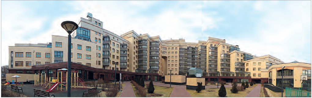
Многофункциональный комплекс «Пять прудов» (ул. Новаторов, д. 1)

и ночи. Большинство объектов оснащено автоматизированными системами управления инженерным оборудованием, современными телекоммуникационными сетями.