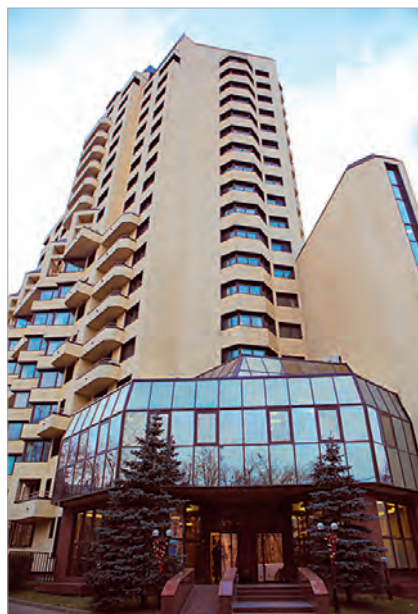
Многофункциональный комплекс «Донской посад» (ул. Стасовой, д. 4)

За прошедшие годы у этого многофункционального комплекса сложилась определенная репутация, что очень ценно прежде всего для самих арендаторов. Сегодня здесь созданы все условия для того, чтобы можно было жить в