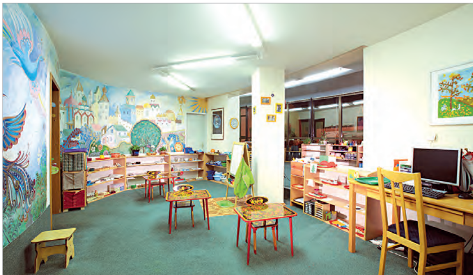
Детский сад МФК «Парк Плейс Москоу»

комфорте и безопасности, заниматься спортом и обучением детей, не выходя за пределы самого здания.