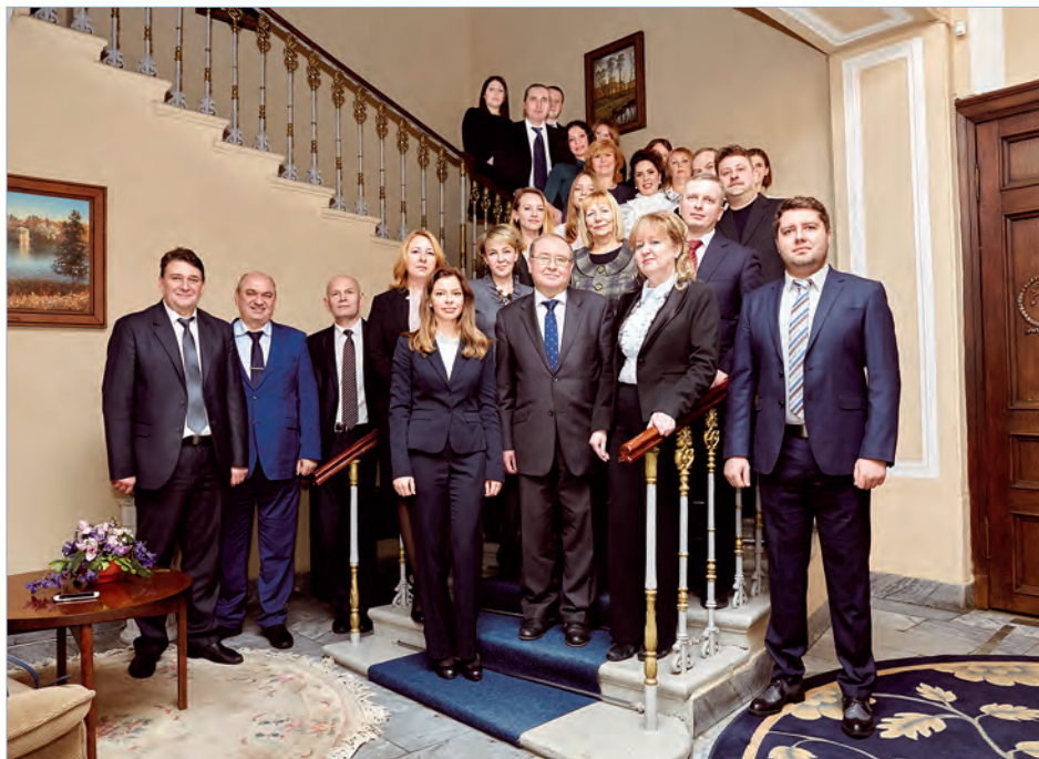
Коллектив сотрудников Представительства МИД (2017 г.)

О роли территориального органа в налаживании международных связей и консульских традициях в городе на Неве опубликована статья