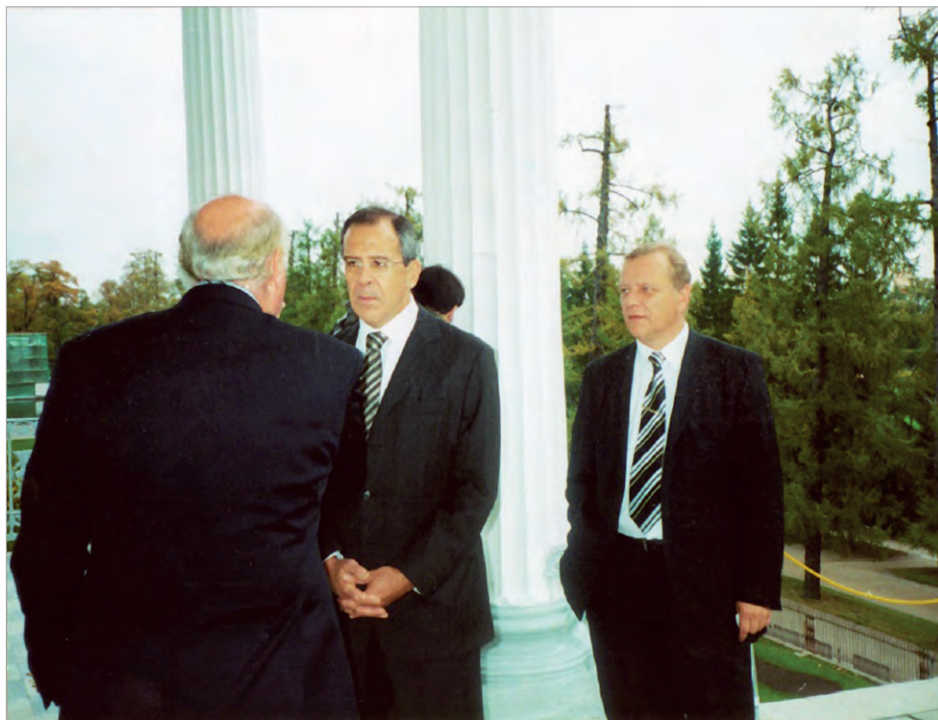
Один из визитов министра иностранных дел РФ С.В.Лаврова в Петербурге (крайний справа - представитель МИД В.В.Завалов)

Важным титульным событием конца 1980-х стало переименование Дипломатического агентства в Представительство МИД СССР в Ленинграде. Распад Советского Союза в декабре 1991 года, ликвидация союзного МИД напрямую затронули не только название учреждения (теперь оно стало Представительством Российской Федерации - до сен-