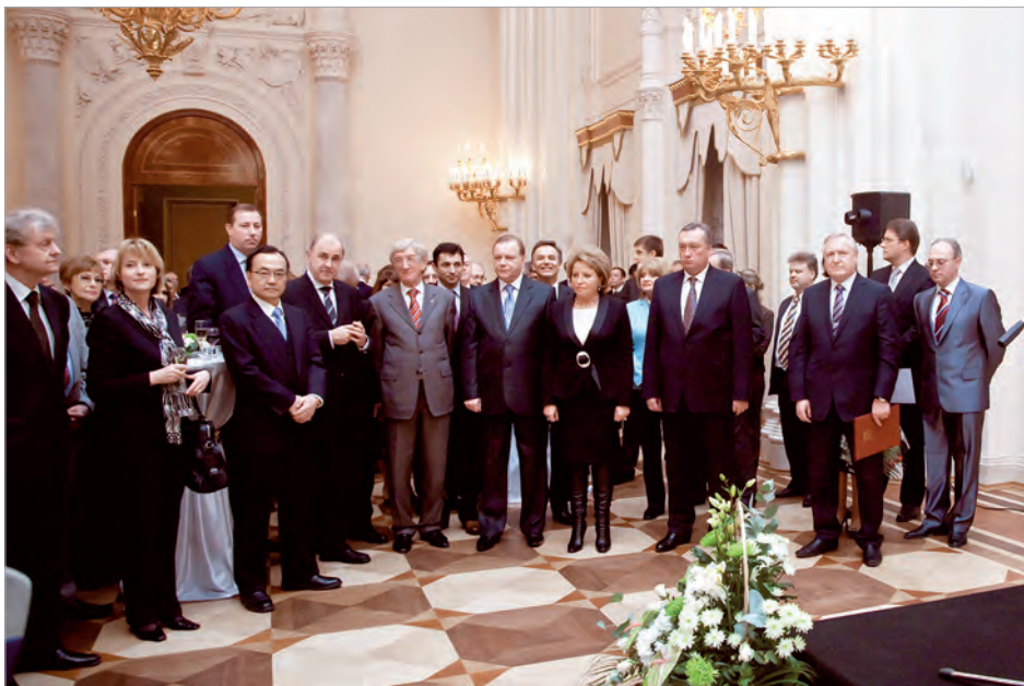
Прием по случаю Дня дипломатического работника в Петербурге (2010 г.)

Постепенно, помимо протокольных и паспортно-визовых вопросов, Дипагентство освоило весь спектр консульских тем. Велась активная переписка с различными организациями многих городов по поводу наследственных прав советских и иностранных граждан, получения для граждан государств, представленных консульствами, документов ЗАГС, а также по вопросам возмещения убытков вследствие ДТП. Осуществлялось плотное взаимодействие с «Инюрколлегией». Появились решения по вопросам истребования и легализации.