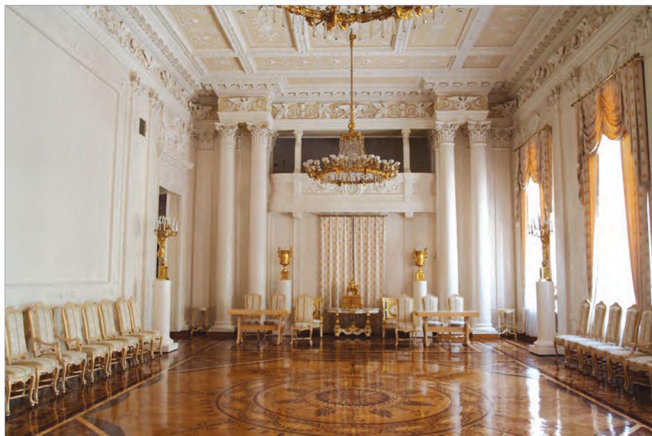
Дом приемов МИД России, Белый зал

В июле 1947 года Бюробин был преобразован в Управление по обслуживанию дипломатического корпуса МИД СССР (УпДК).