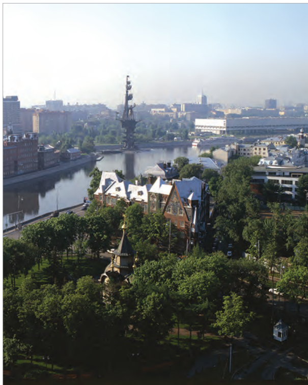
Курсовой переулок, д. 1 (вид сверху)