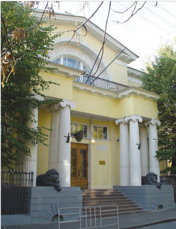
Хлебный переулок, д. 15

Бюробин успешно развивался и работал в разные исторические периоды, и неизменно главная его цель состояла в создании наиболее комфортных условий для работы иностранных граждан, по долгу службы оказавшихся в нашей стране.