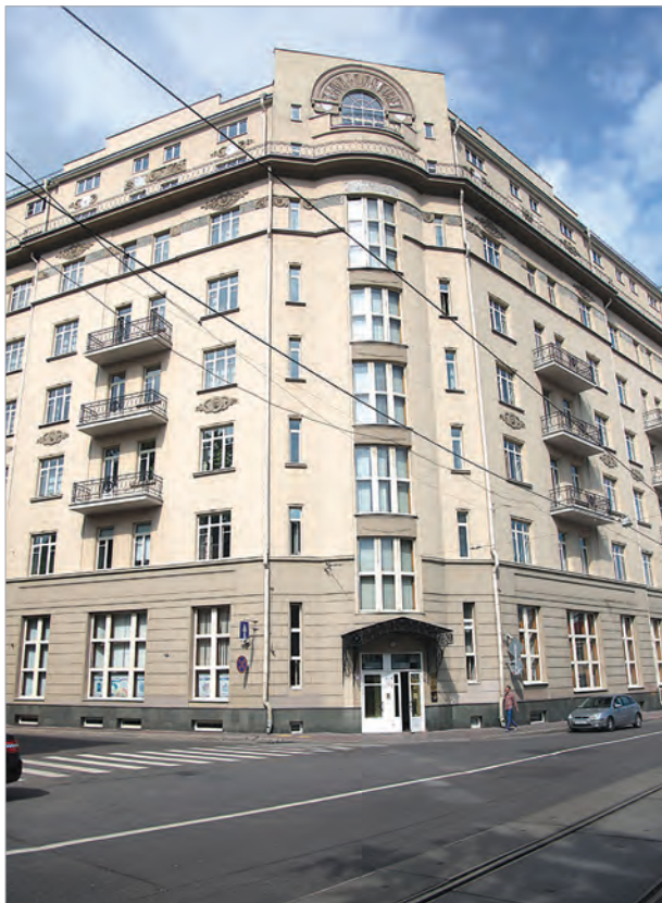
Покровский бульвар, д. 4, стр. 17

нейших российских купцов и промышленников - Рябушинских, Морозовых, Второвых, Игумновых, - сегодня эти особняки являются историко-архитектурными памятниками, сохранившими дух прошлых эпох в виде великолепных фасадов, интерьеров, предметов мебели и другой обстановки.