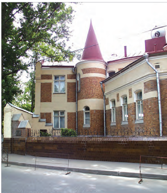
Ермолаевский переулок, д. 28

Услугами ГлавУпДК пользуются более 180 посольств и представительств международных организаций, свыше 140 корпунктов зарубежных СМИ, почти 2 тыс. российских и иностранных компаний.