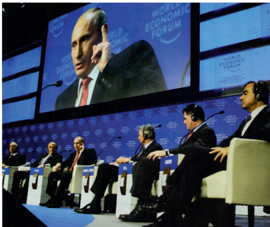
Глава правительства РФ В.В.Путин выступает с докладом на Всемирном экономическом форуме в Давосе (январь 2009 г.).

ных дел, известные политики и губернаторы. Сохранялась надежда на участие Президента России. Пожалуй, наибольшую отдачу с точки зрения российских интересов дал Давос-99. Делегацию возглавлял незадолго до того назначенный главой правительства Е.М.Примаков.