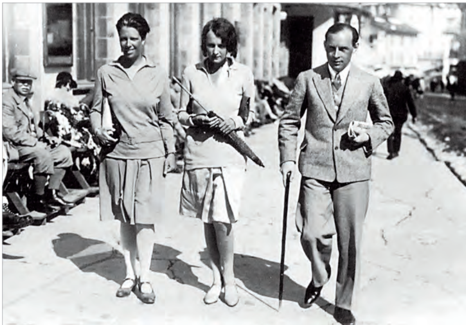
Писатель Эрих Мария Ремарк в Давосе. 1921 г.

было получать из первых рук информацию о том, что происходит в огромной стране, планах и делах ее руководителей, увидеть проблемы и перспективы. Для России ВЭФ - кладезь информации, площадка диалога с ключевыми деятелями экономики, финансов и политики современного мира.