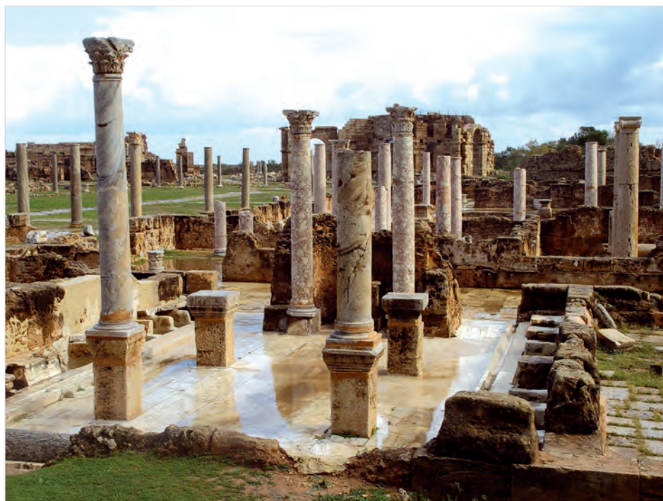
Древний античный город Лептис Магна

Стоит отметить, что мародеры грабят не только исламские святыни, но и места поклонения христианских верующих. Они ограбили право-