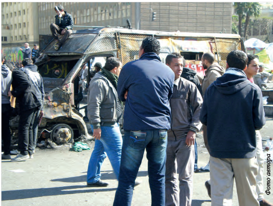
Сожженный полицейский фургон стоит посреди площади Тахрир как символ революционной победы

ся тысячи человек, недовольные политикой исламистских властей. Люди требовали свержения Президента Мухаммеда Мурси и правления «Братьев-мусульман». На прилегающих улицах вспыхнули стычки, а потом и настоящие бои демонстрантов с силовиками. Демонстрантам удалось захватить полицейский фургон и притащить его на Тахрир. Тут он до сих пор и стоит посреди площади, как монумент.