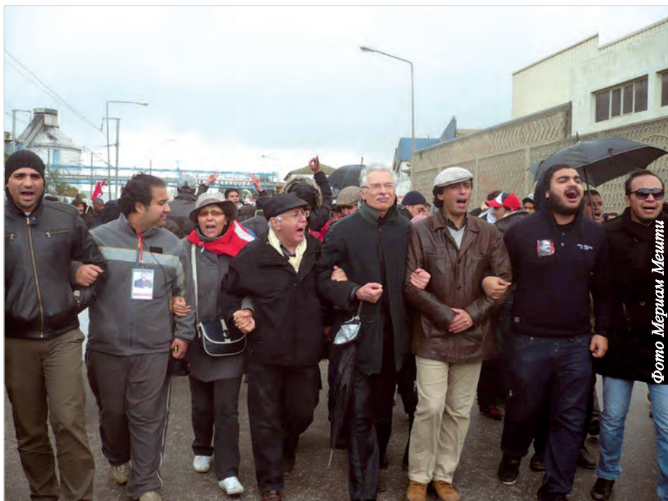
Тунисцы негодуют: «У нас украли Революцию».

толчок к распространению протестных движений в других арабских странах, получившее с чьей-то легкой руки название «арабская весна». Так что Сиди Бузид - ни дать ни взять - «колыбель революции»!