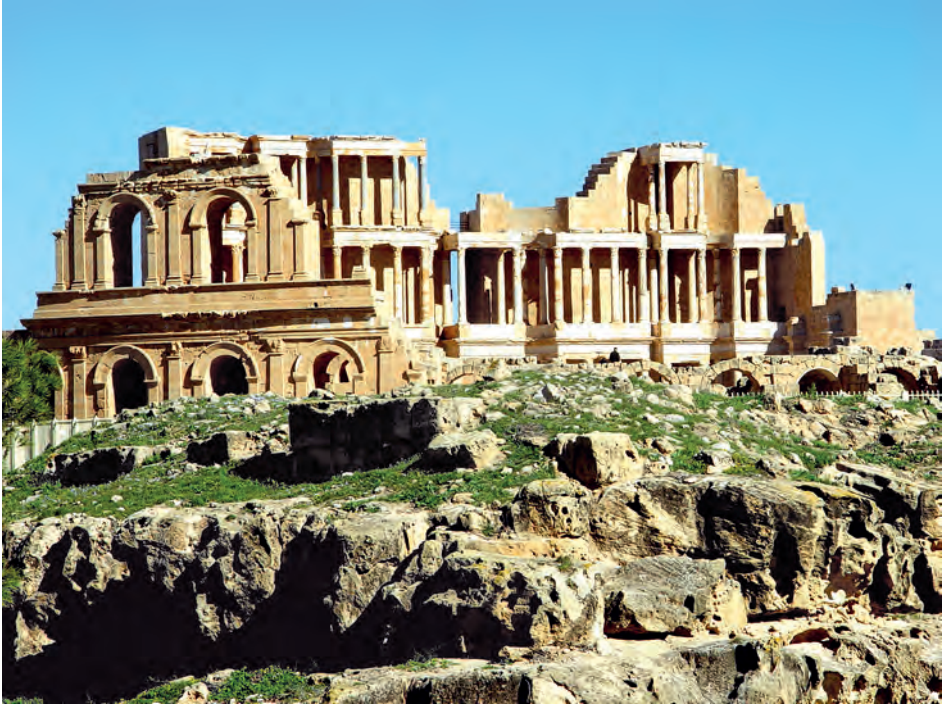
Древний античный город Сабрата

В Музее Джамахирии хранились экспонаты мирового значения - памятники времен палеолита и неолита, эпохи Древнего Рима, произведения искусства ранней христианской Византийской империи и исламского периода.