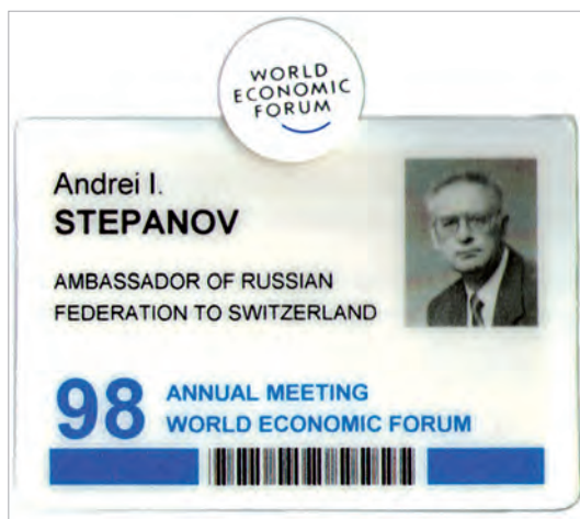
Бейдж посла РФ - участника Давосского форума 1998 г.

На волне бурного международного развития во второй половине прошлого столетия появился интеллектуальный, экономический и политический феномен нового формата - Всемирный экономический форум. Он сконцентрировал свое внимание на проблематике глобализации, путях выхода мировой экономики из затяжного кризиса, которому не видно конца, ее стабилизации. При этом ВЭФ подключился к обсуждению политических и дипломатических аспектов современного мира.