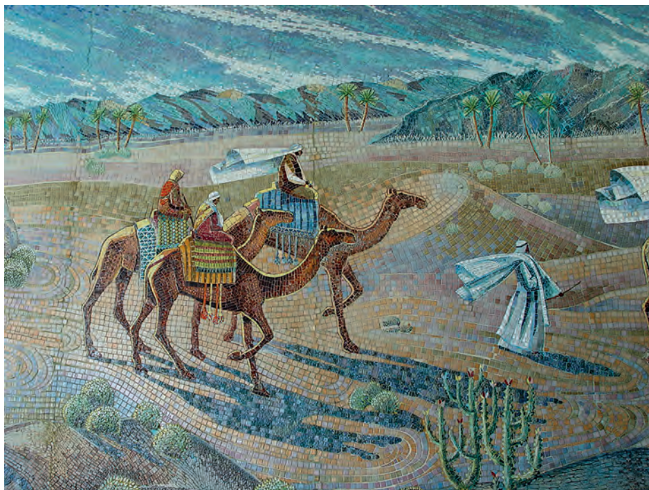
Из Каирского национального музея

дентных по масштабу кража культурных и исторических ценностей в мире. Исчезли 7,7 тыс. золотых, серебряных и бронзовых монет, многие из которых отчеканены еще во времена Александра Македонского. Кроме того, воры похитили древние статуэтки и другие предметы из бронзы, слоновой кости и стекла. Исчезли браслеты, медальоны, ожерелья, серьги, кольца и другие украшения из драгоценных камней античной эпохи.