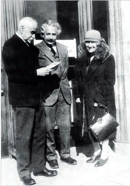
Альберт Эйнштейн открывает в Давосе первые курсы высшего образования. 1928 г.

дународного влияния и авторитета России. Задача расширения российского участия во Всемирном экономическом форуме в Давосе стала в 1990-х годах одной из ведущих на швейцарском направлении.