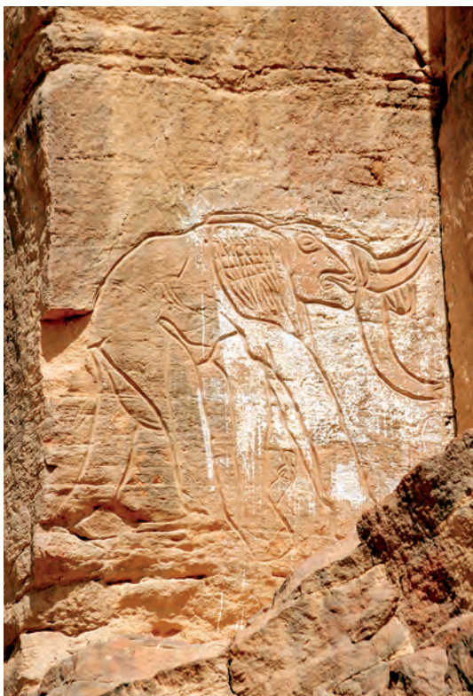
Под открытым небом, наскальный рисунок - слон

Во время подписания Пакта в Овальном зале Белого дома Президент США Франклин Рузвельт сказал: «Предлагая этот Пакт для подписания народам всего мира, мы стремимся к всемирному применению одного из важнейших принципов сохранения современной цивилизации. Этот договор заключает в себе духовное значение гораздо более глубокое, нежели выражено в самом тексте» 2 .