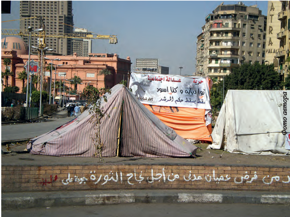
Палаточный лагерь на площади Тахрир в Каире существует уже два года

гражданских прав. Сейчас - свобода слова, демонстраций, демократия», «В результате революции мы получили очень важные права и свободы. Мы строим свою демократию. Нужен общегипетский, общенациональный президент. Если будет демократия, то мы быстро восстановим экономику».