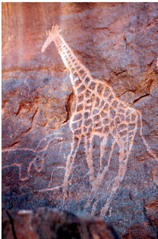
Под открытым небом, наскальный рисунок- жираф

Пакт Рериха - Договор об охране художественных и научных учреждений и исторических памятников был подписан в Вашингтоне 15 апреля 1935 года представителями 21 государства.