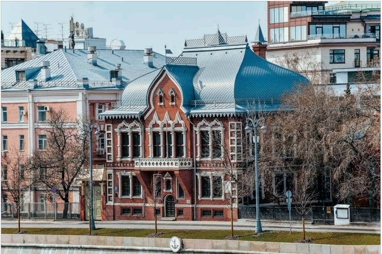
Год постройки: 1899-1901 гг. Архитектор: В.М.Васнецов

Седьмая глава этой серии рассказывает о здании по адресу: г. Москва, Пречистенская набережная, д. 29 - Цветковская галерея.