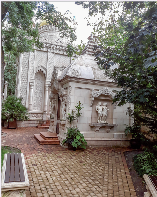
Дом Востока и индийская Ратха