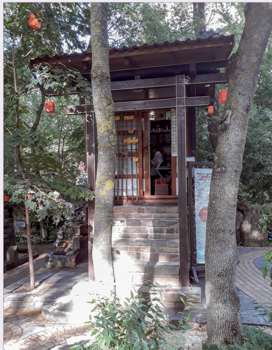
Японская часовня Синто

Дом Востока - синтез исламской и восточной многоликости. Фасад знаменует величественность дворца, минареты сим-