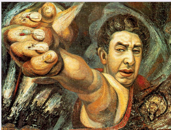
Д.А.Сикейрос. Автопортрет. Пироксилин. 1943.