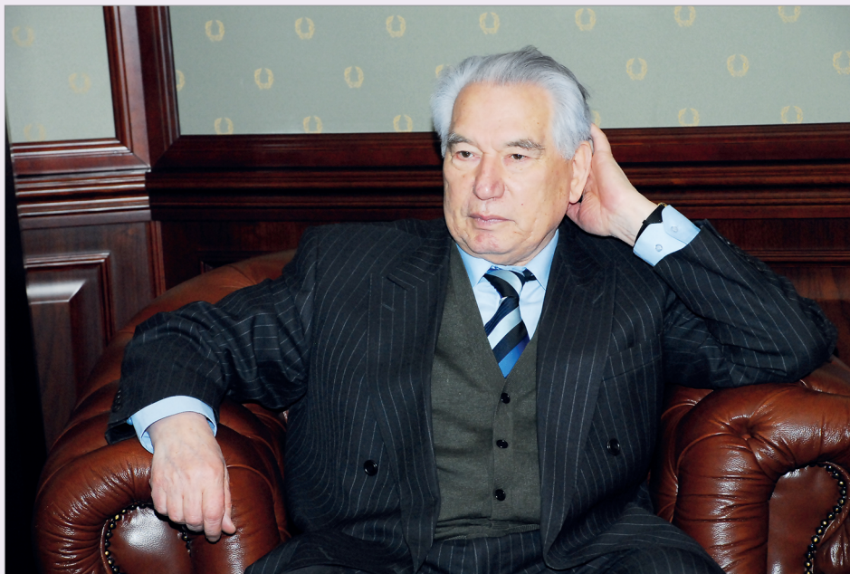
Чингиз Торекулович Айтматов

риторический. И ответ на него следует искать прежде всего в перестроечной философии М.С.Горбачева и его ближайшего окружения, в том числе занимавшего пост министра иностранных дел Э.А.Шеварднадзе. Сформировавшаяся к тому времени внешнеполитическая концепция, получившая название «новое политическое мышление», предполагала отказ от противостояния двух политических систем, признавала целостность и неделимость мира, объявляла приоритет общечеловеческих ценностей над классовыми и идеологическими догматами в международных отношениях.