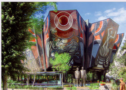
Д.А.Сикейрос. Мари человечества

Н едавно в России и во многих других странах мира вспоминали и отмечали столетие Октябрьской революции. Не стала исключением и Мексика, от жителей которой в посольство поступило множество приглашений от университетов и научных организаций с просьбой выступить с лекциями и докладами на тему революции, а также посодествовать с организацией выставок исторических