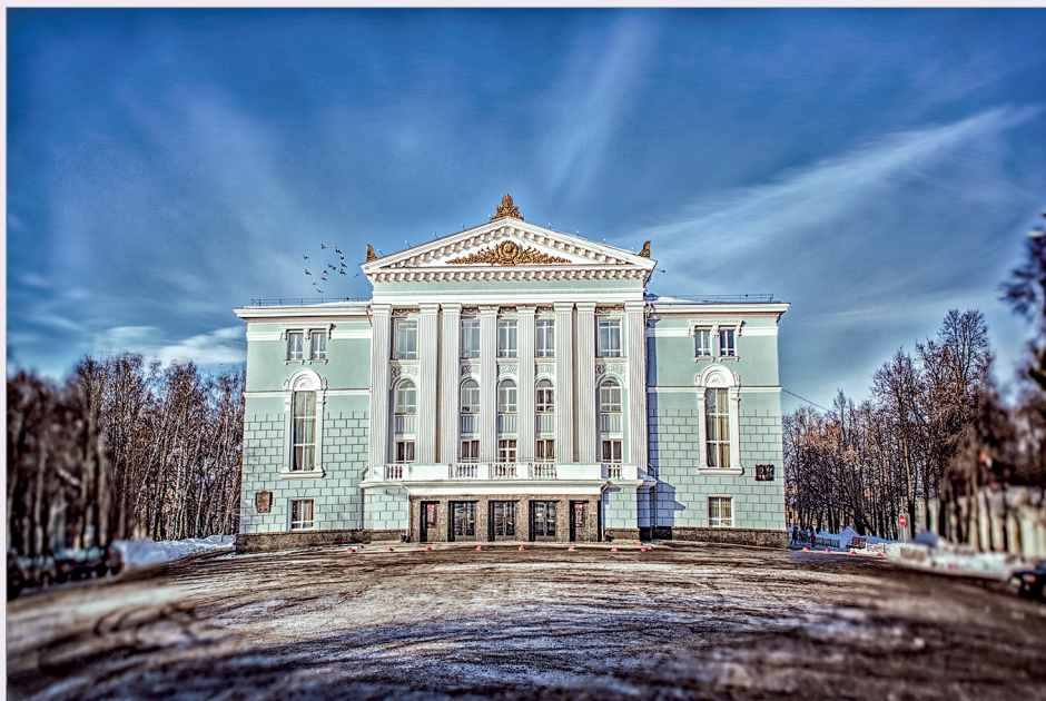
Пермский театр оперы и балета им. П.И.Чайковского.

В этом году оркестр из Перми вновь гастролировал на Зальцбургском фестивале, где представил вниманию ценителей академической музыки все симфонии Бетховена. Помимо гастрольной деятельности и новых постановок театра, в Перми ежегодно проходит международный «Дягилевский фестиваль», а раз в два года конкурс артистов балета им. Екатерины Максимовой «Арабеск».