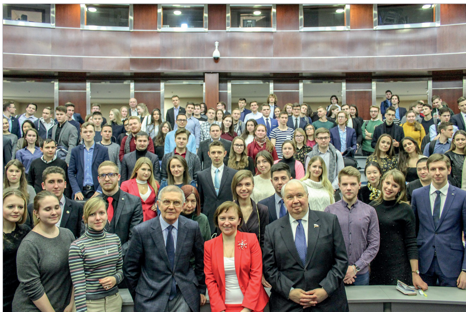
Выступление С.И.Кисляка в Дипломатическом клубе МГИМО им. А.Г.Карлова

трудных жизненных ситуациях. Также фонд занимается продвижением международного сотрудничества в области науки и образования.