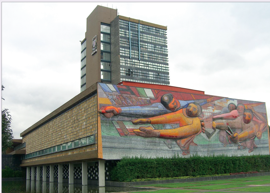
Д.А.Сикейрос. Университет Мехико. Здание ректората

обществе рождались и новые формы искусства, вдохновленные в том числе Русской революцией.