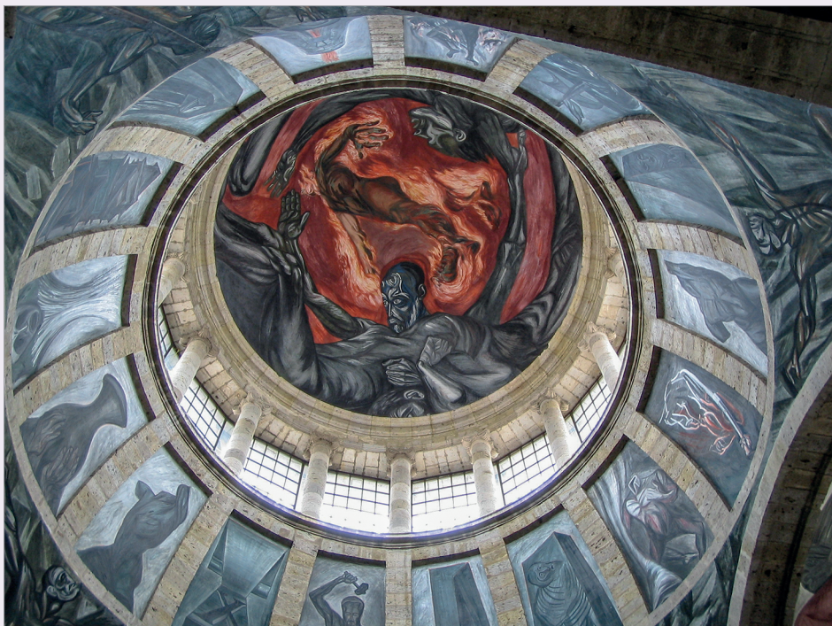
Х.К.Ороско. Роспись в часовне госпиталя «Осписио-Кабаньяс», Гвадалахара

Последнее прибежище Троцкого на юге Мехико сохранилось до сих пор, сейчас там располагается дом-музей его имени, где ему суждено было погибнуть от рук Рамона Меркадера летом 1940 года. Это случилось со второй попытки, первая же состоялась несколькими месяцами ранее, и в ней как раз и принял участие идеологический оппонент Риверы - Давид Сикейрос, никогда не порывавший со сталинизмом. После войны и сам Ривера вернется в лоно Коммунистической партии Мексики, а в 1956 году по приглашению советского руководства во второй раз посетит Москву. Любопытно, что и его супруга Фрида Кало, чей гроб в 1954 году будет обернут алым полотнищем с серпом и молотом 5 , оставит после себя незаконченный портрет Сталина («Автопортрет со Сталиным»), а не Троцкого.