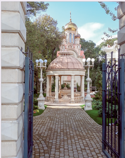
Средневековая беседка и православная часовня