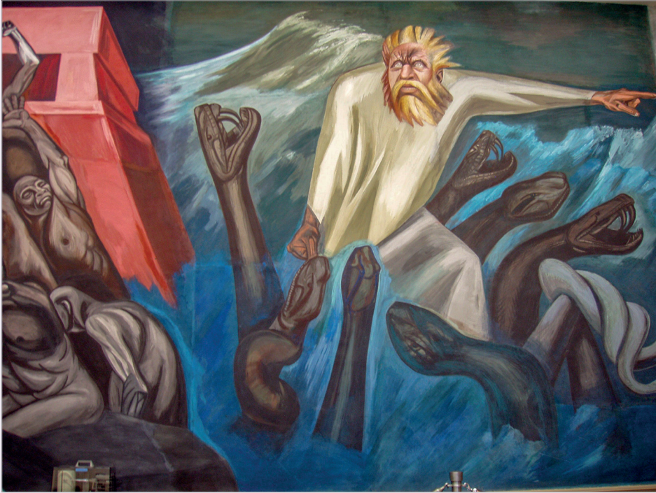
Х.К.Ороско. Деталь фрески «Американская цивилизация» в библиотеке Дартмутского колледжа, ГанOVER (США)

роль признается за людьми из народа, рабочими и крестьянами - именно они становились героями новых произведений. Но при этом художественный язык Сикейроса в силу большего символизма сложнее для понимания, если говорить о неподготовленном зрителе.