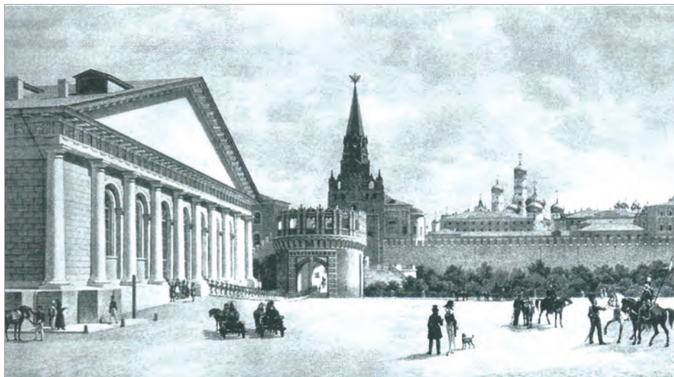
Вид Манежа со стороны Воздвиженки. Литография К.Ф.Хайцмана с рисунка Э.Гертнера. Середина XIX в.