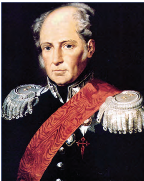
Автор проекта инженер Августин де Бетанкур