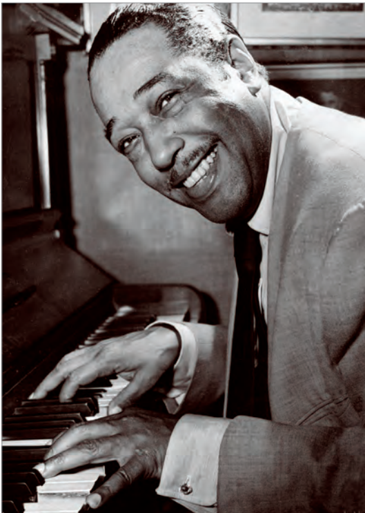
Дюк Эллингтон - пианист и композитор, создававший свои уникальные творения в непосредственном контакте с основанным им оркестром, с которым выступал перед восторженной аудиторией в СССР в 1971 г.

Причем, если М.Дэвис, Ч.Кория и Х.Хэнкок вышли, так сказать, из «чистого» классического джаза, то другие названные выше музыканты имели в своем арсенале не только джазовый, но и роковый опыт. Конечно, таким «многостаночникам» было проще осуществить величайший синтез в музыкальной культуре.