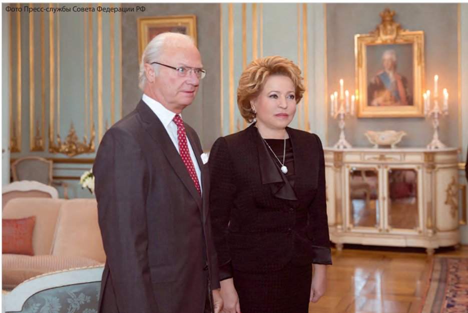
В.И.Матвиенко и король Швеции Карл XVI Густав

ширения и диверсификации российско-шведского сотрудничества. Россия крайне заинтересована в таком развитии событий», - отметила глава российской делегации.