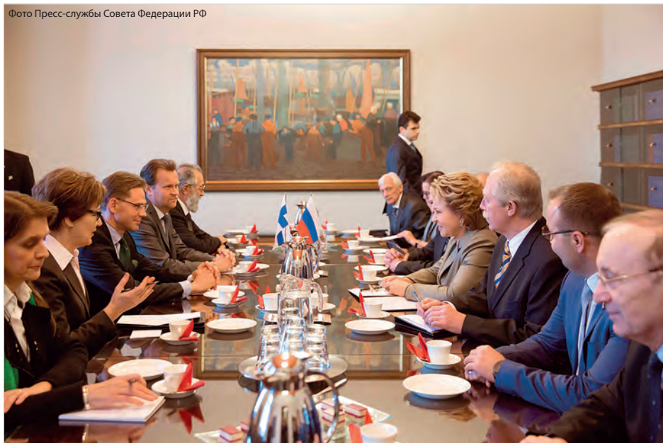
На переговорах в Хельсинки

личительными особенностями наших двусторонних контактов. Убедиться в этом могли все, кто наблюдал за ходом встреч и переговоров российских парламентариев с их норвежскими коллегами.