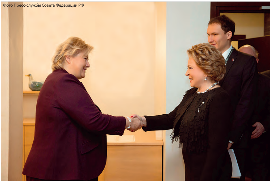
В.И.Матвиенко и премьер-министр Норвегии Эрна Солберг

ботам и добыче углеводородов арктического шельфа в норвежской части Баренцева моря. Отдельно была подчеркнута важность дальнейшего взаимодействия в вопросах ядерной безопасности и охраны окружающей среды в районах Крайнего Севера и Арктики.