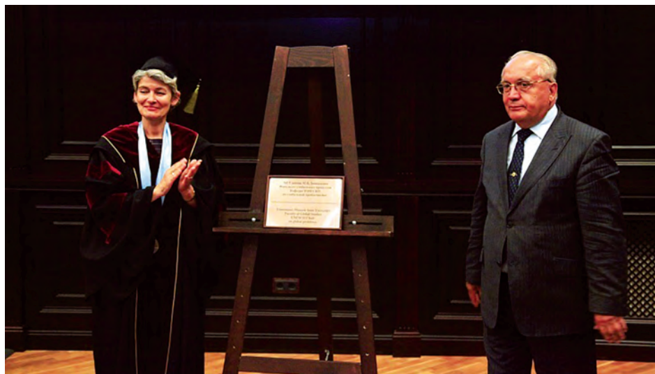
И.Бокова и В.Садовничий символически открывают кафедру ЮНЕСКО

этой инновационной программы совершенно нового института кафедр и сетей ЮНЕСКО. Программа была призвана стать действенным инструментом повышения потенциала общества посредством продвижения, обмена, более эффективного использования и расширения познаний и научно-образовательного опыта современного мира, выступив в качестве нового элемента стратегии развития.