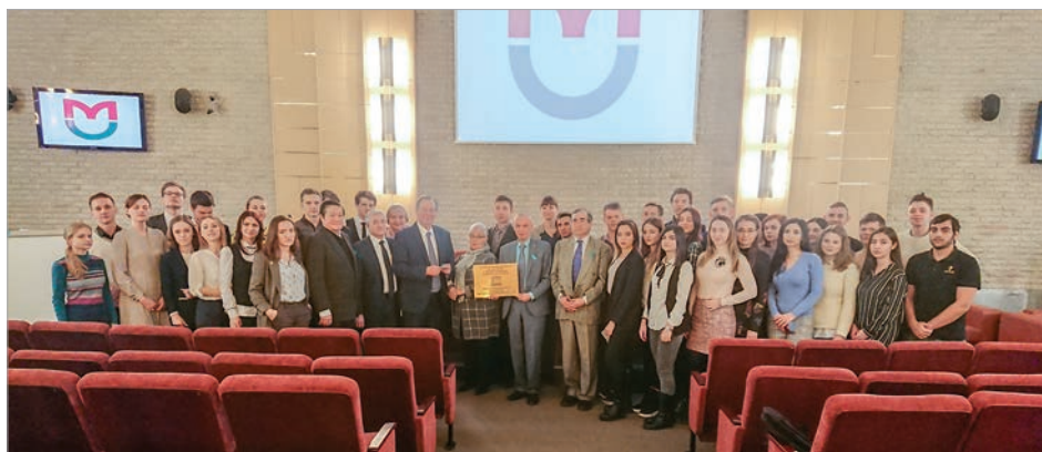
Сетевая секция по биоэтике кафедры ЮНЕСКО по изучению глобальных проблем открыта

Это также привело к развитию образовательной деятельности и исследовательской программы.