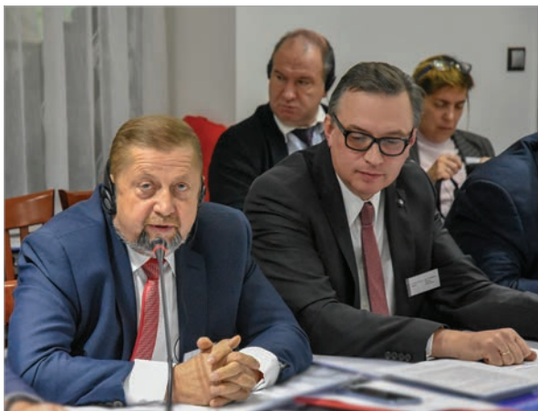
Судья Верховного суда Словакии Штефан Гарабин (кандидат в президенты Словацкой Республики)

По словам Штефана Гарабина, политики в Брюсселе ограничивают государственный суверенитет стран ЕС. «Мы не хотим участвовать в приеме мигрантов, которых нам навязывают, мы не хотим, чтобы растворились наши культурные и моральные ценности. Я выдвинул свою кандидатуру на президентские выборы. Как только это произошло, те силы, которые не хотят верховенства права в стране, начали атаку против меня. Кроме постоянных нападок на меня лично, так называемые «мейнстримовые» медиа стали площадкой для политиков, оказывающих влияние на Верховный суд. И я стал мишенью для прессы. Например, мой ролик, в котором я первым раскритиковал миграционную политику. На «Фейсбуке» это видео было заблокировано на следующий день без указания причин. Они даже не обосно-