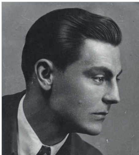
Барон Эдуард Фальц-Фейн