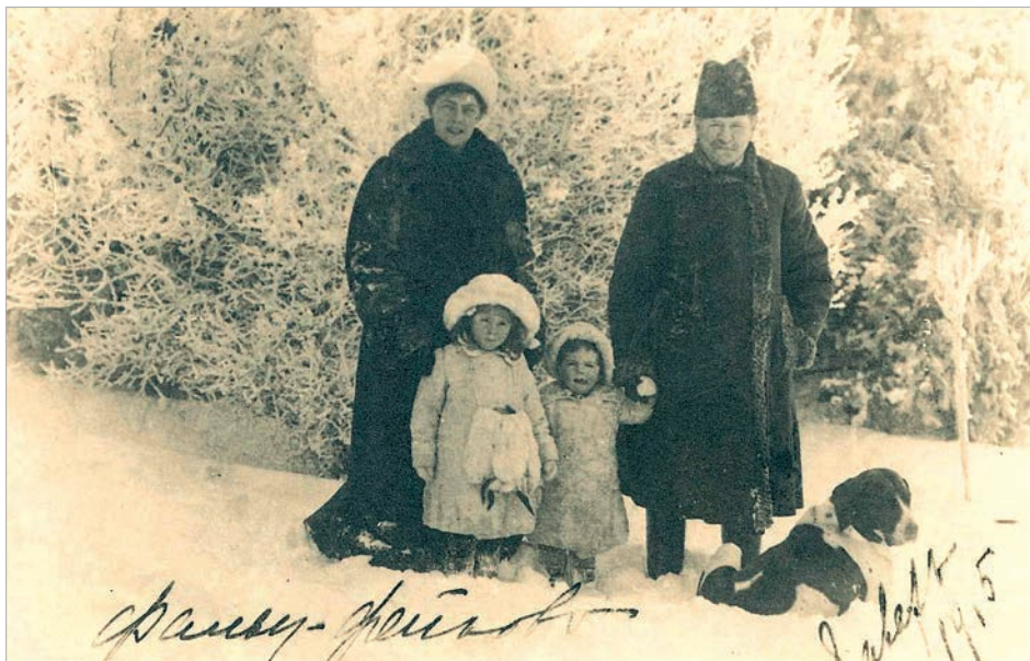
Вся семья вместе на Рождество 1916 г. в имени Гавриловке (Фальц-Фейново)

С парой сапог за плечами пришли немецкие колонисты из родной тесноты в широкие российские пределы. Екатерина Великая позвала их обживать новые, завоеванные Потемкиным безводные южные степи. Явились они в Россию с пустыми руками, но с собой принесли и насадили высокую культуру земледелия и скотоводства и показали пример добросовестной и блестяще организованной работы.