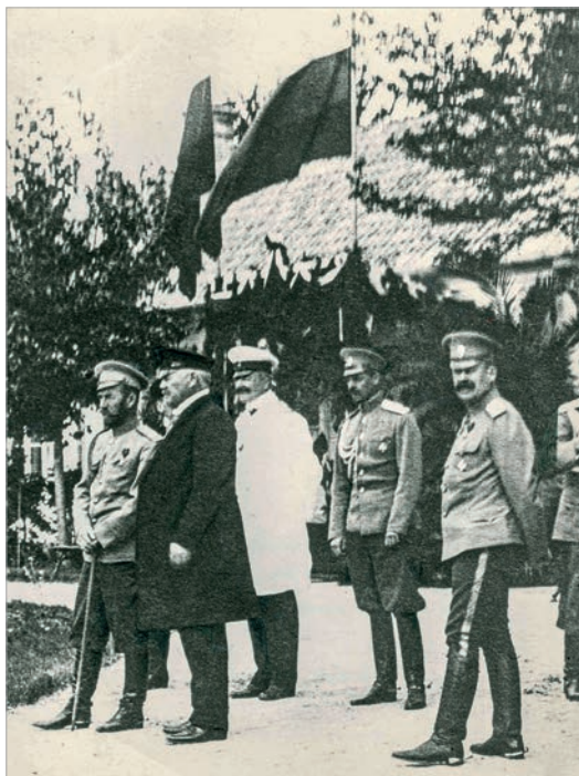
Приезд Николая Второго в имение «Аскания-Нова». По левую руку от царя - основатель заповедника Фридрих Фальц-Фейн. 28 апреля 1914 г.

который не привык терять времени даром. С юмором, добродушно так пристыдил бездеятельность канцелярии Советского фонда культуры, что нельзя было не подивиться его дипломатическим способностям. Он говорил о том, что все беженцы, с которыми он предварительно связался и договорился о передаче семейных реликвий в Россию, до сих пор не получили никакого запроса от Советского фонда культуры: «Ждут Набоковы, Трубецкие, Васильчиковы. Я их всех подкрутил, а от вас ни слуху - ни духу. Опять они меня ругают: «Мы на родине - враги народа. А ты ходишь на их красный ковер,