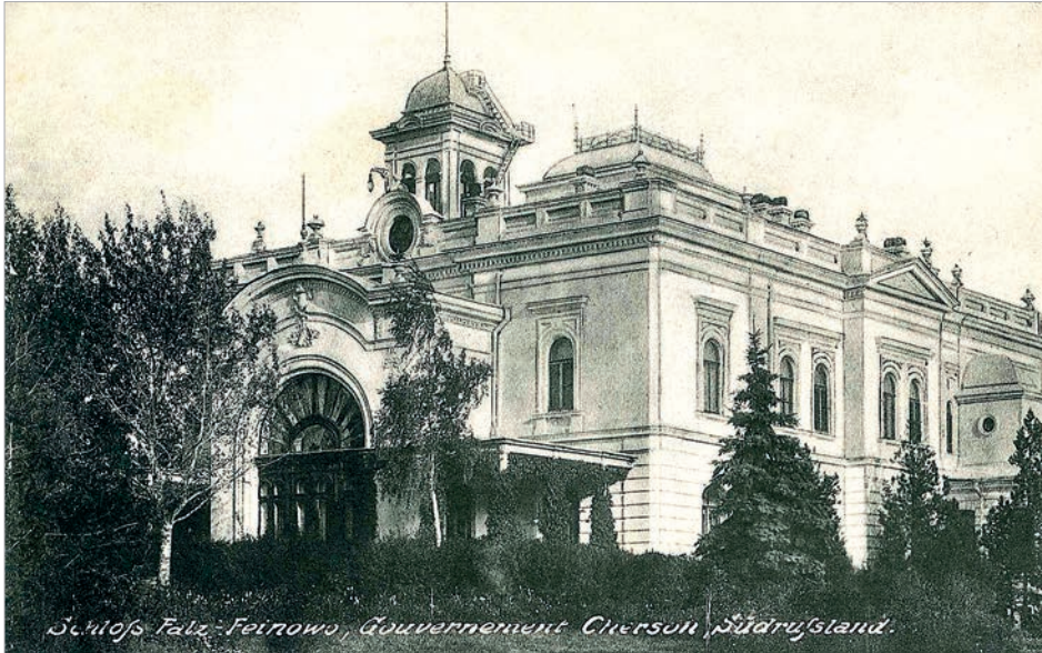
Дворец в Гавриловке (Фальц-Фейново). Там, в угловой комнате на втором этаже, 14 сентября 1912 г. в час дня родился Эду

эмиграция уже сходила с исторического подиума и, как барон однажды заметил, Москва вовремя позвала эмигрантов: «Меня поймали за хвост».