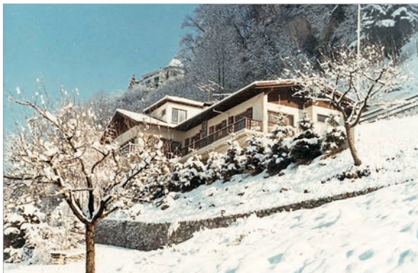
Вилла «Аскания-Нова» на Рождество

И речь его была необычайной. Говорил экспромтом, без бумажки. При внешней мягкости манер чувствовалась настойчивая деловитость человека,