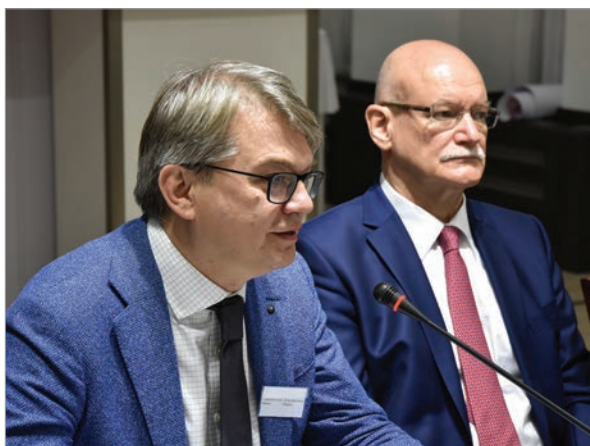
Представитель ЮНЕСКО Мариус Лукошюнас, и посол РФ в Словакии Алексей Федотов

Примеров, к сожалению, более чем достаточно. Здесь и арест журналиста Кирилла Вышинского, арестованного украинскими властями исключительно за то, что честно выполнял свой журналистский долг. Во Франции дошли до того, что на прошлой неделе российских журналистов не пускали на встречу с министром иностранных дел России Сергеем Лавровым и его французским коллегой. Во многих странах Запада, которые называют себя образцами свободы печати, в ход идут специальные бюрократические препятствия в работе неудобных им журналистов. Надо понимать, что эта неприемлемая практика в отношении российских журналистов становится общепринятой и может коснуться любого журналиста, не только российского. Примеры есть. Так происходит и на Украине, и в странах Евросоюза, и США», - подчеркнул Алексей Федотов в своем вступительном слове.