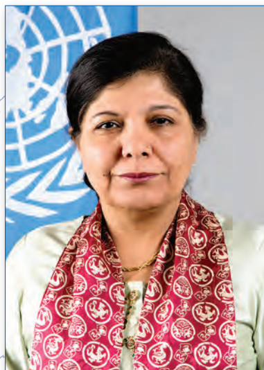
Д-р Шамшад АХТАР Исполнительный секретарь (в ранге заместителя Генсека ООН) Экономической и социальной комиссии ООН для Азии и Тихого океана (ЭСКАТО)