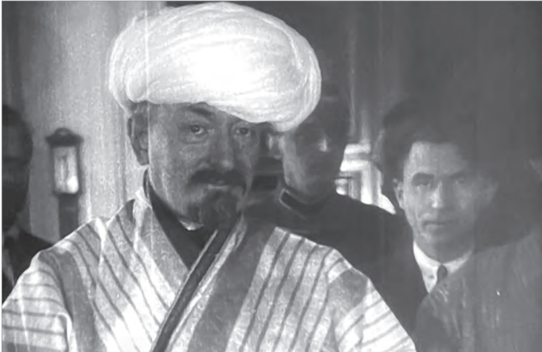
Г.В.Чичерин в чалме и халате, подаренных ему бухарской делегацией. 9 февраля 1924 г.

годаря стараниям Чичерина наркомат переехал в здание на углу Кузнецкого моста и Большой Лубянки, которое занимал более 30 лет. Ныне о нахождении здесь НКВД напоминает установленный памятник трагически погибшему в 1923 году советскому дипломату Вацлаву Воровскому. Его возвели в 1924 году на средства, собранные среди сотрудников наркомата.