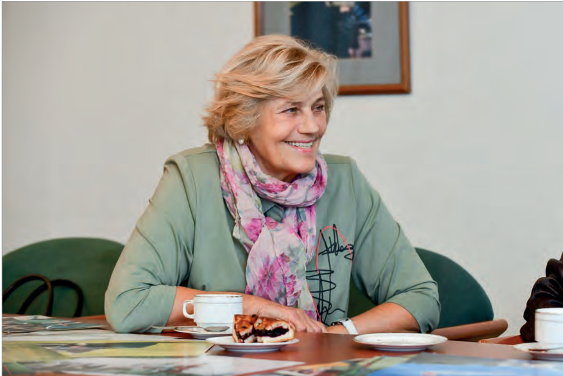
Заслуженный мастер спорта СССР, олимпийская чемпионка и чемпионка мира по конькобежному спорту Людмила Титова

за рубежом, где нас принимали очень тепло и радушно. Эта поездка оставила неизгладимые впечатления - жители европейских городов встречали нас исключительно гостеприимно, с интересом знакомились как с членами команды «Метелица», так и с марками автомобилей, на которых мы передвигались.