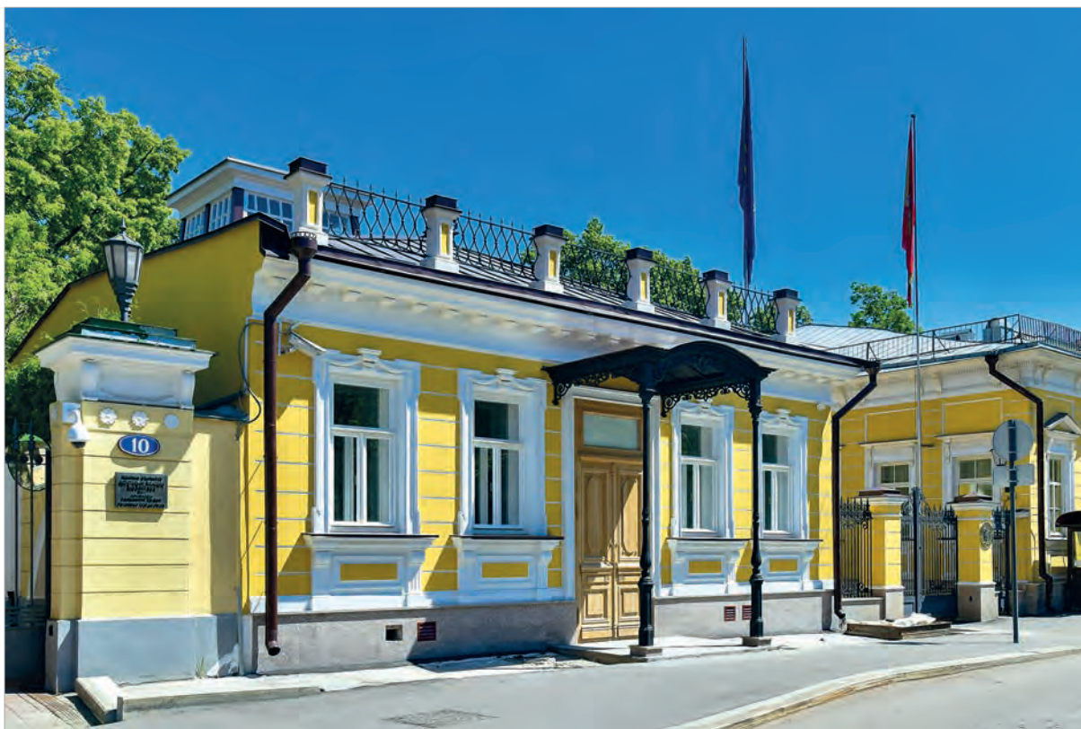
Городская усадьба А.Г.Щепочкиной - Н.А.Львова. Годы постройки: 1821 г. Объект культурного наследия регионального значения.

Пятая глава этой серии рассказывает о здании по адресу: г. Москва, Спасо-Сковский пер., д. 8, с. 1, 2 и, в частности, о недавно завершённых работах по реставрации флигеля этого очаровательного особняка.