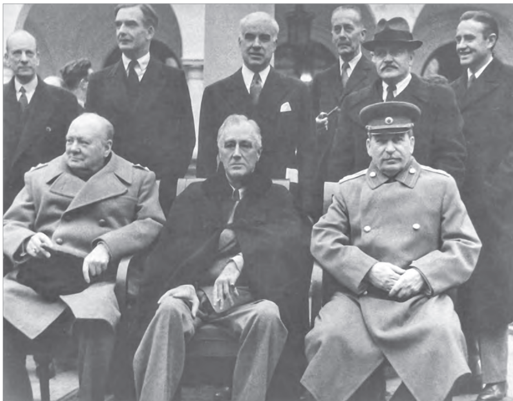
«Большая тройка». Ялта. А.Гарриман - в третьем ряду, крайний справа. Февраль 1945 г.

АВЕРЕЛЛА ГАРРИМАН. ОЛИГАРХ НА ДИПЛОМАТИЧЕСКОЙ СЛУЖБЕ