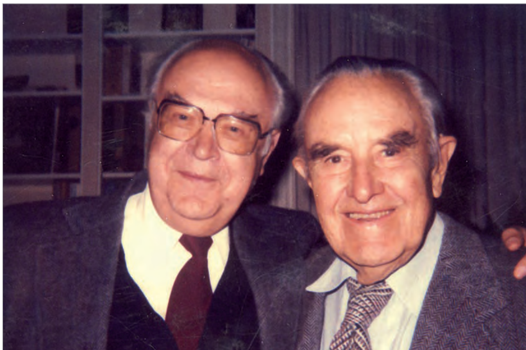
Встреча посла СССР в США А.Ф.Добрынина с А.Гарриманом по случаю его 90-летия. Ноябрь 1981 г.

АВЕРЕЛЛ ГАРРИМАН. ОЛИГАРХ НА ДИПЛОМАТИЧЕСКОЙ СЛУЖБЕ