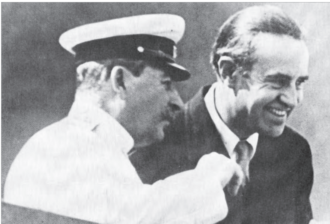
И.В.Сталин и А.Гарриман на трибуне Мавзолея Ленина. Август 1945 г.

назначения. Гарриман выдохнул с облегчением. Больше всего он боялся, что администрация в Вашингтоне, желавшая уже любым способом прекратить войну, пошла бы на уступки и приняла все условия Советов. Но этого не случилось.