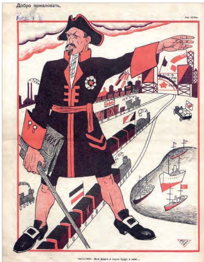
Г.В.Чичерин в образе Петра I. Подпись под иллюстрацией: «Чичерин: Все флаги в гости будут к нам...» (журнал «Красный перец», №11. 1923)

торговых и хозяйственных отношений, стороны взаимно отказывались от претензий друг к другу. Блестящий эрудит и полиглот Чичерин подписал написанный на немецком языке Рапальский договор без участия переводчиков. Точно так же он быстренько перевел вслух свое выступление на конференции не знавшему французского языка премьер-министру Англии Ллойд Джорджу. В этом выступлении Чичерин заявил, в частности, о возможности мирного экономического сосуществования между двумя системами - капиталистической и социалистической.