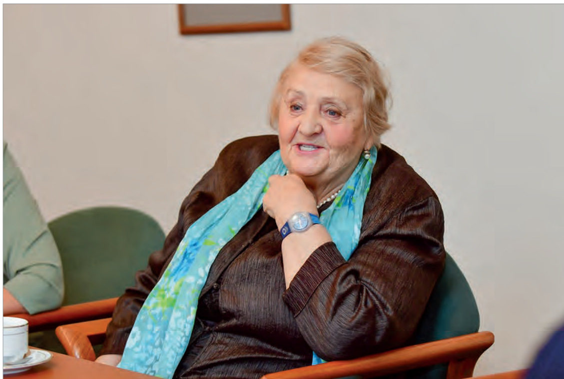
Трехкратная советская олимпийская чемпионка и девятикратная чемпионка мира по фехтованию на рапирах, президент Российского союза спортсменов Галина Горохова

тель. А по завершению Игр многие уезжают домой с решительным настроением готовиться и тренироваться, чтобы достойно представить свою страну в следующем году.