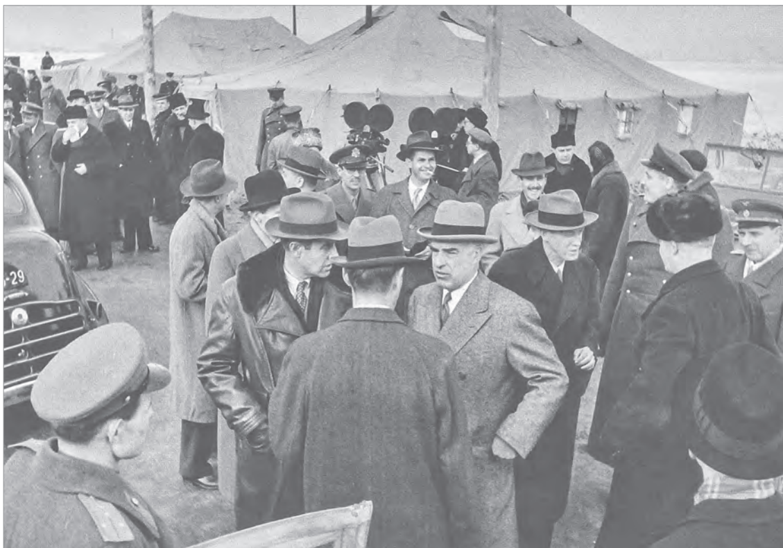
Встреча американской делегации на аэродроме Саки накануне Ялтинской конференции. В центре: А.Гарриман, Э.Стеттинцус, Г.Гопкинс. Февраль 1945 г.

АВЕРЕЛА ГАРРИМАН. ОЛИГАРХ НА ДИПЛОМАТИЧЕСКОЙ СЛУЖБЕ