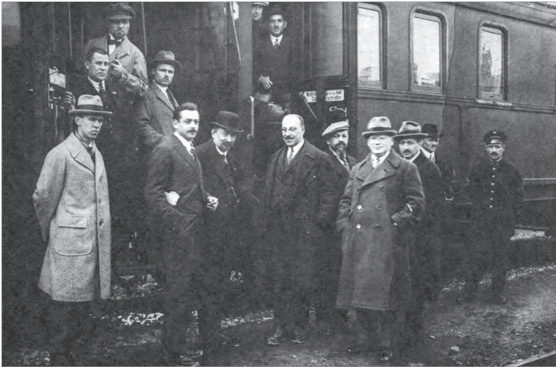
Нарком по иностранным делам РСФСР Г.В.Чичерин и его заместитель М.М.Литвинов с членами советской делегации на вокзале по дороге в Геную. 1922 г.

Вспоминая свое детство, автор статьи не может не рассказать, как в далеком 1964 году увидел во Дворце культуры завода «Серп и Молот» только вышедший на экраны кинофильм «Москва - Генуя», посвященный проведению Генуэзской конференции и заключению Рапальского договора с Германией. Многие из сюжета фильма я, конечно, не понимал, зато на всю жизнь запомнил образ волевого и в то же время глубоко интеллигентного и образованного Георгия Чичерина, созданный замечательным актером Г.А.Беловым. Кто знает, но, может быть, тогда, увидев на экране Чичерина, я впервые заинтересовался дипломатией и международной журналистикой, которой посвятил в дальнейшем всю свою жизнь.