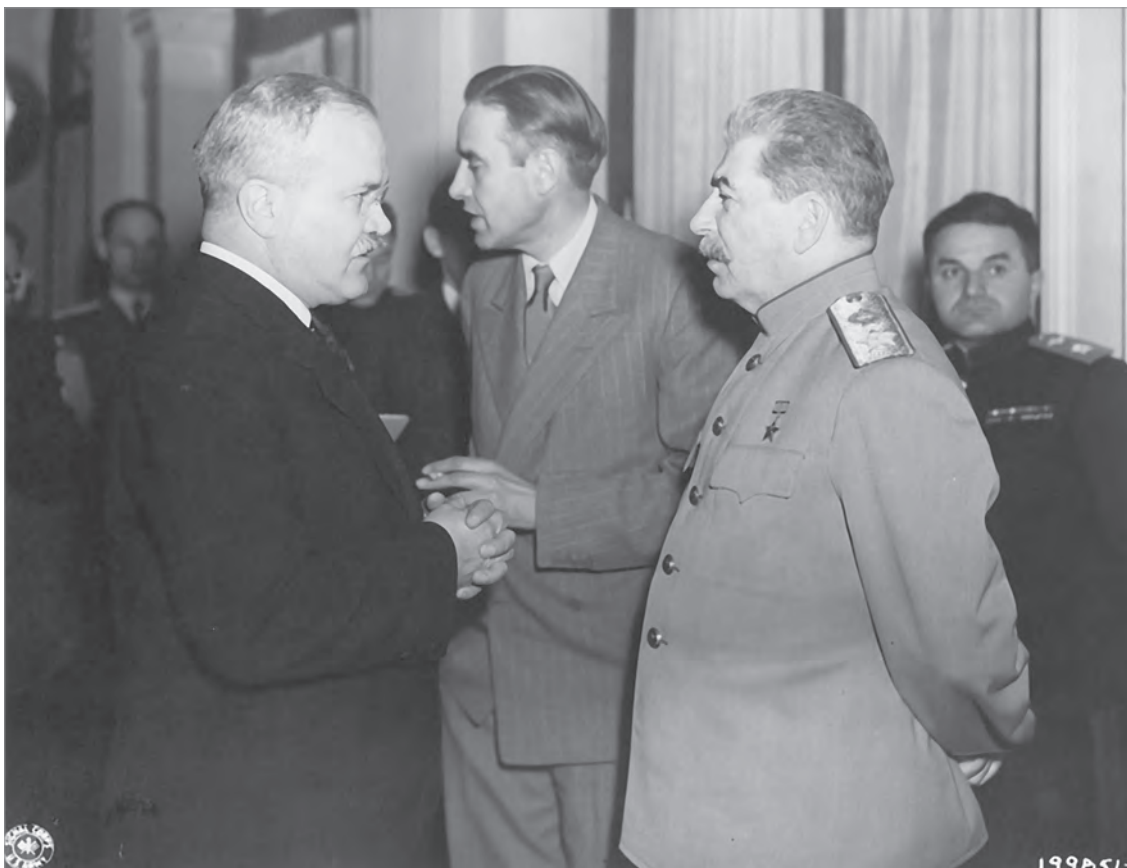
На Крымской конференции. В.М.Молотов, А.Гарриман, И.В.Сталин. Февраль 1945 г.

мессию. Сталин потерял человека, который готов был с ним договариваться на приемлемых условиях, - для интересов СССР это был мощный удар. Аверелл же лишился своего благодетеля, проводника и заступника в мире большой политики. Его собственное будущее в этом мире уже не было гарантировано.