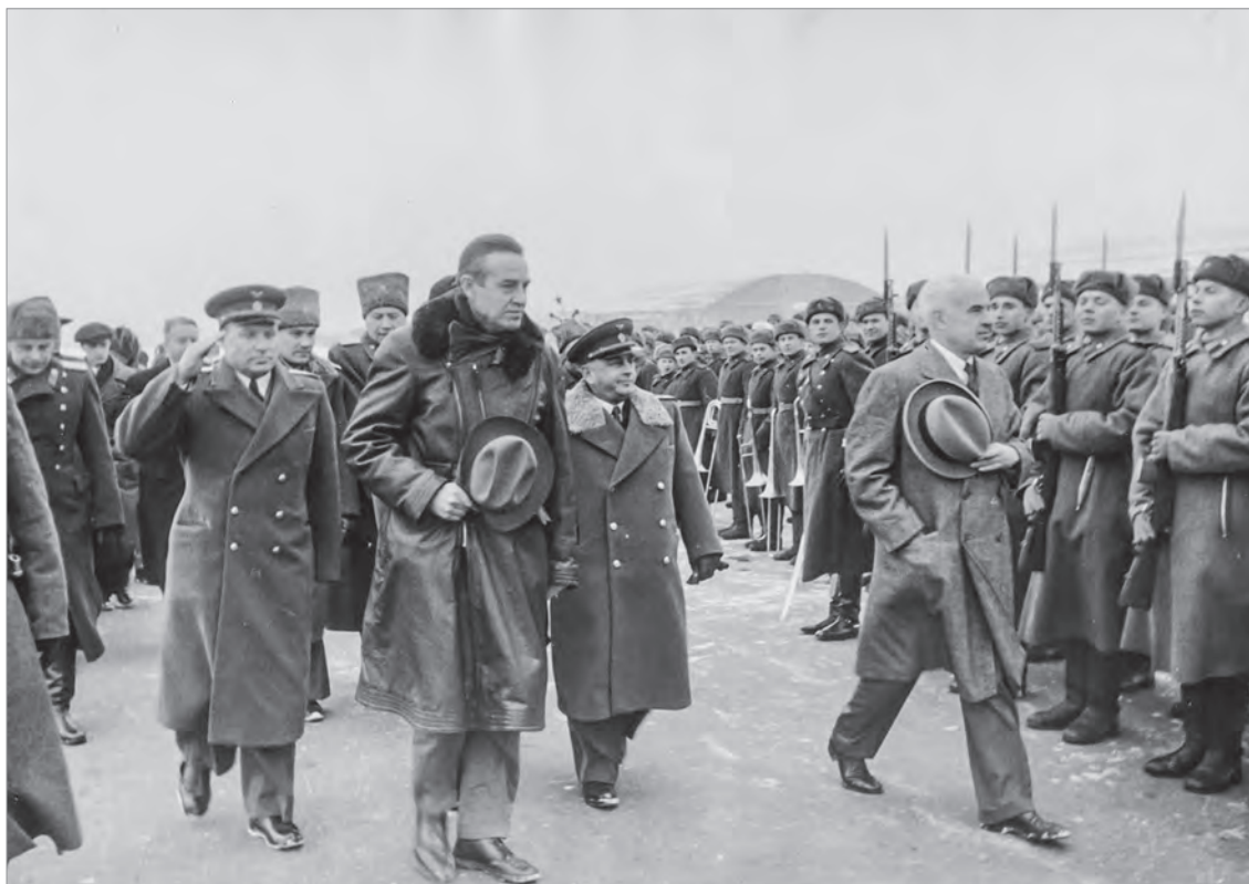
Встреча Э.Стеттинцуса в Москве. А.Гарриман - в центре. 12 февраля 1945 г.

АВЕРЕЛА ГАРРИМАН. ОЛИГАРХ НА ДИПЛОМАТИЧЕСКОЙ СЛУЖБЕ