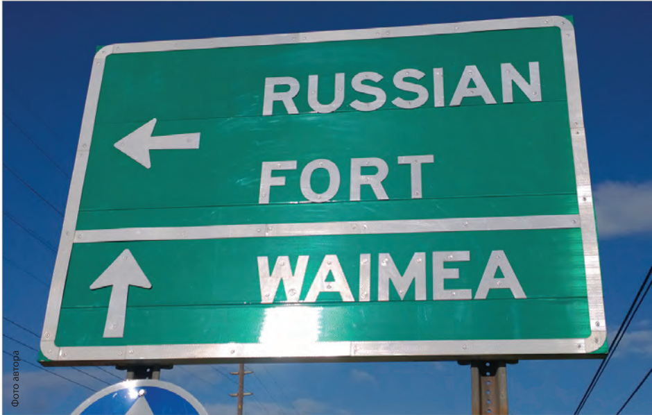
«Русский Форт» - такой знак с удивлением видят туристы, проезжая по южному берегу Кауаи

Российский флаг был спущен, и на его месте развевался уже какой-то иной, непонятный флаг. Шестеро американских матросов схватили Шеффера и затолкали на русский корабль «Кадьяк», стоявший на юго-западе острова, в устье реки Ваймеа, рядом с крепостью Елисавета. Шеффер попытался обойти остров и причалить на севере, в «своем поместье» Ханалеи, но узнал, что двое его верных алеутов, ждавших на берегу, были убиты, и навсегда покинул Кауаи 41 .