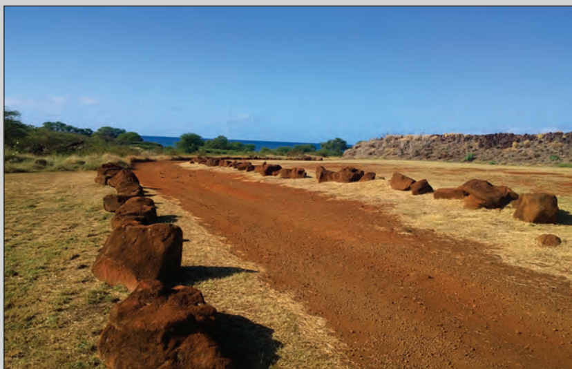
Путь к крепости Елисавета