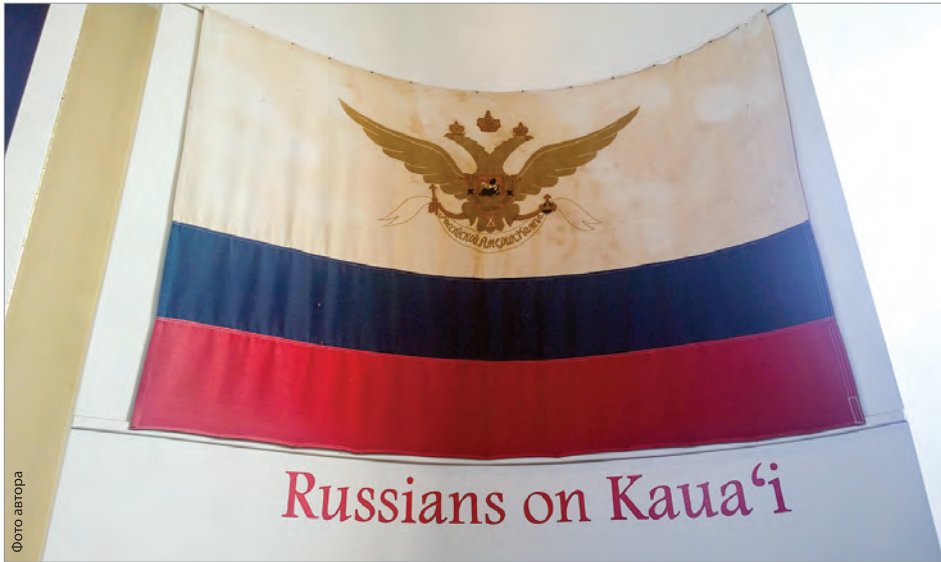
Флаг Российско-Американской компании, выставленный в Музее Кауаи в экспозиции, посвященной «русскому периоду» острова

Но главное слово было за МИД. Сообщая в феврале 1818 года об окончательном решении Александра I по вопросу о Сандвичевых островах, Нессельроде отчеканил: «Государь император изволит полагать, что приобретение сих островов и добровольное их поступление в его покровительство не только не может принести России никакой существенной пользы, но, напротив, во многих отношениях сопряжено с весьма важными неудобствами. И потому Его величеству угодно, чтобы королю Томари, изъявля всю возможную приветливость и желание сохранить с ним приятные сношения, от него помянутого акта не принимать, а только ограничиться постановлением с ним вышеупомянутых благоприятных сношений и действовать к распространению с Сандвичевыми островами торговых оборотов Американской компании, поелику оные сообразны будут сему порядку дел». Министру внутренних дел О.П.Козодавлеву поручалось довести это решение до сведения компании и «дать ей предписание, чтобы она от такового правила не отступала».