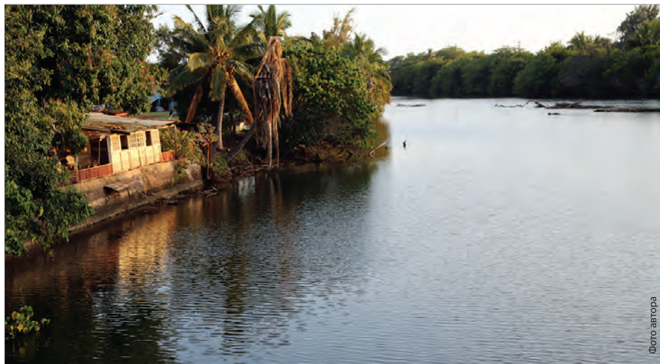
Река Хананепе на острове Кауаи. Во время русского правления на острове она была переименована в Дон

ское озеро». Сохранили архивы и объяснения того, почему император Александр I решил, что такой поворот будет не в интересах России.