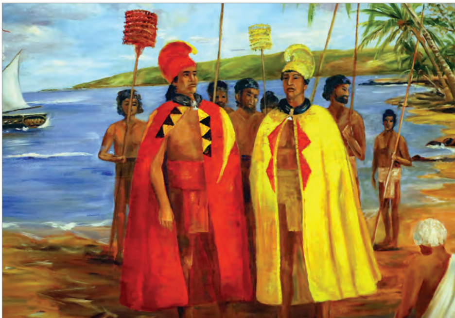
Король Кауаи Каумуалии, которого русские называли «Томари», со своим злейшим врагом - королем Камеамеа. Картина, выставленная в Музее Кауаи

говоренность между двумя королями или нет? Безусловно одно: на момент прибытия на остров русских Кауаи оставался де-факто независимым, Каумуалии продолжал править своим «обособленным королевством», находившимся на крайнем западе Гавайев, словно на отшибе. Конфликт, как бы сейчас сказали, перешел в разряд «замороженных».