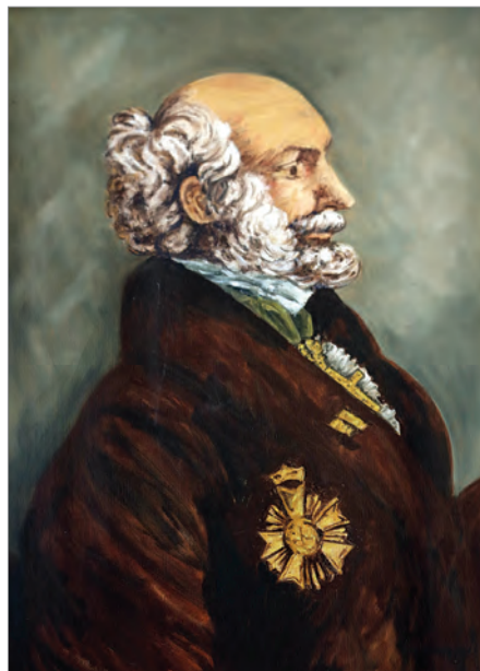
Георг Шеффер. Портрет, выставленный в Музее Кауаи

Но изучение дневниковых записей Шеффера, которые он вел на Кауаи, а также записка, представленная им Александру I, «о выгодах, приобретаемых Россией в случае ее укрепления на Сандвичевых островах», оставляют впечатление о нем как о человеке острого ума и преданного интересам России: «В отношении политическом: доставление надлежащего покровительства российским заморским владениям зависит от приобретения надежного места в южном море. Должна ли Россия стараться вступить вновь в то владение? Сего требует и честь и польза ее. Ей должно занять Атувай со всеми прочими островами. Занятием Сандвичевых островов Россия обеспечивает себе возможность производить ей одной торг мехами на северо-западном берегу и воспрепятствует американцам оным пользоваться, но как сии острова, так и заведения России и торговля ее без оных будут для ней потеряны в сих странах света...».