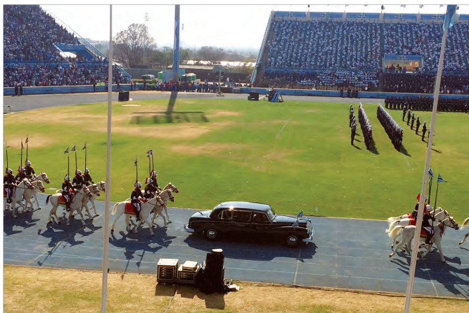
Президент Я.Кхама на раритетном 50-летнем «даймлере»

Представляется, однако, что на новом историческом этапе развития Ботсване и ботсванцам, с учетом постепенного оскудения алмазных и медно-никелевых копей, падения мирового спроса на их основные экспортные товары и, соответственно, наблюдаемого снижения экономического роста по сравнению с прошедшим периодом (в 1966-1999 гг. средний ежегодный рост ВВП составлял свыше 8%, за последние десять лет - 5% ) 9 , придется немало потрудиться для осуществления диверсификации экономики, достижения самообеспечения водой и электроэнергией, искоренения бедности, преодоления значительного имущественного и социального неравенства и высокого для страны (с населением 2,3 млн. человек) уровня безработицы - свыше 20% 10 . Мы же, естественно, желаем нашим ботсванским друзьям успешной реализации поставленных благородных задач и растущего процветания.