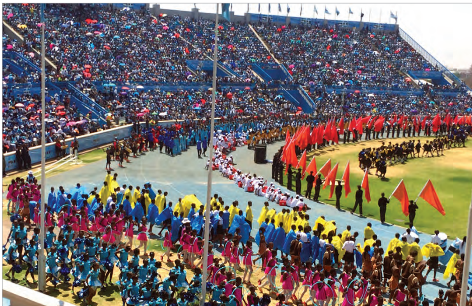
Художественное представление в исполнении артистических и танцевальных коллективов и 7 тыс. школьников, подготовленное под руководством китайских постановщиков и хореографов

В торжественной речи Я.Кхама воздал дань отцам-основателям Республики и их соратникам, подчеркнув впечатляющие успехи и социально-экономические достижения Ботсваны за период независимости. В 1966 году она входила в десятку самых бедных и отсталых стран мира с ВВП в 70 долларов на душу населения, массовой неграмотностью и сплошной бедностью, а в настоящее время, благодаря рачительному использованию минеральных ресурсов, прежде всего алмазов, и умелому управлению, признаваемому международными финансовыми институтами, достигла статуса государства со средним уровнем доходов 7 тыс. долларов 6 .