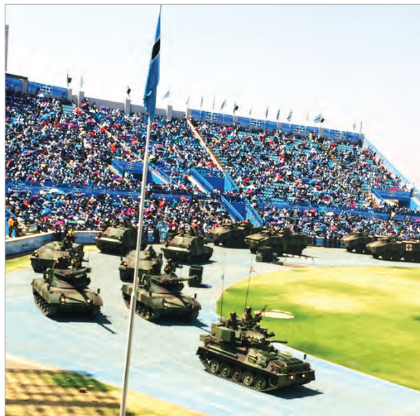
Парад военной техники на Национальном стадионе Ботсваны

Апофеозом торжеств стало яркое художественное представление в исполнении артистов, танцевальных коллективов и 7 тыс. школьников, подготовленное под руководством китайских постановщиков и хореографов.