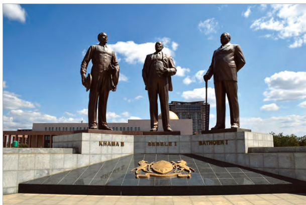
Памятник трем ботсванским вождям в Габороне

Ботсваны Г.Чиепе, подписавшая 6 марта 1970 года в качестве высокого комиссара (посла) в Лондоне ноту о согласии правительства Ботсваны на установление советско-ботсванских дипломатических отношений 3 , среди рубежных событий называет открытие первых алмазных месторождений в Орапе в 1967 году - неиссякаемого источника современного благосостояния страны, создание в 1976 году Центрального банка и национальной валюты Ботсваны - пулы (вместо южноафриканского ранда), в переводе означающей «дождь» и «благо», а также учреждение Университета Ботсваны 4 .