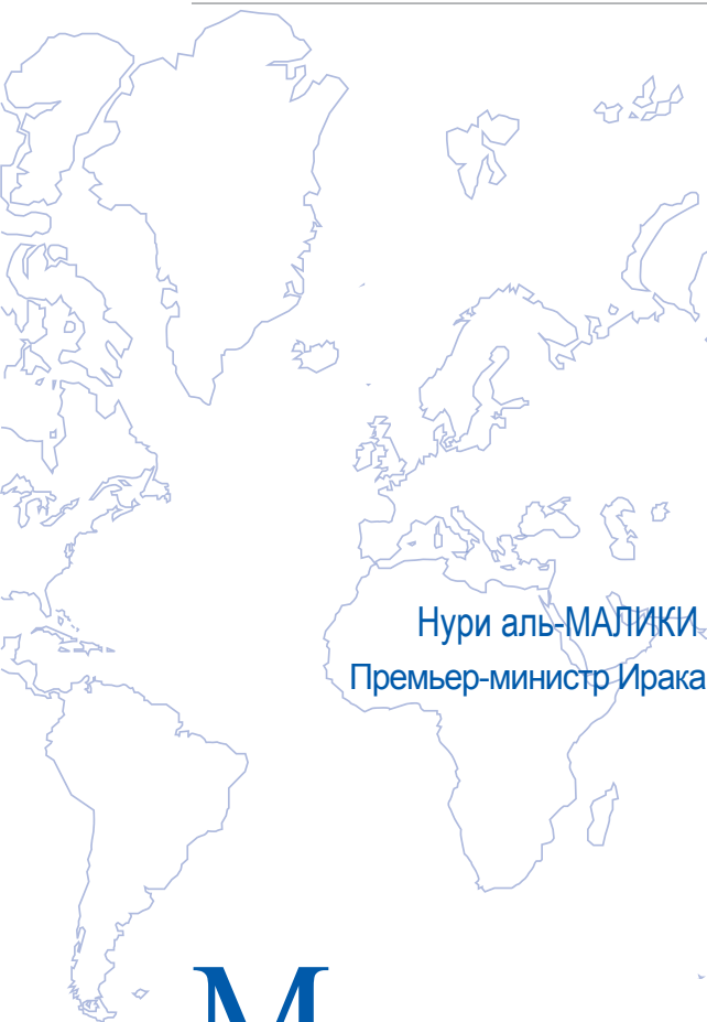
Нури аль-МАЛИКИ Премьер-министр Ирака