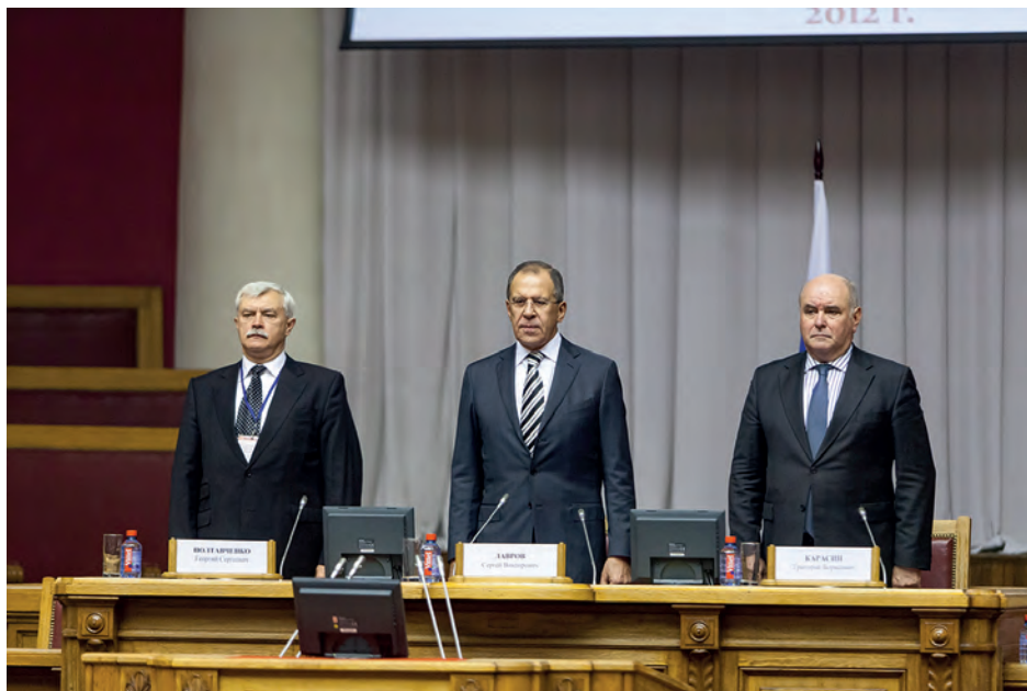
Полтавченко Г.С., губернатор Санкт-Петербурга, Лавров С.В., министр иностранных дел РФ, Карасин Г.Б., статс-секретарь - заместитель министра иностранных дел РФ (слева направо)

страновых координационных советов, объединений и НПО соотечественников, потомки великих россиян, происходящих из известных династий, связанных с историей России.