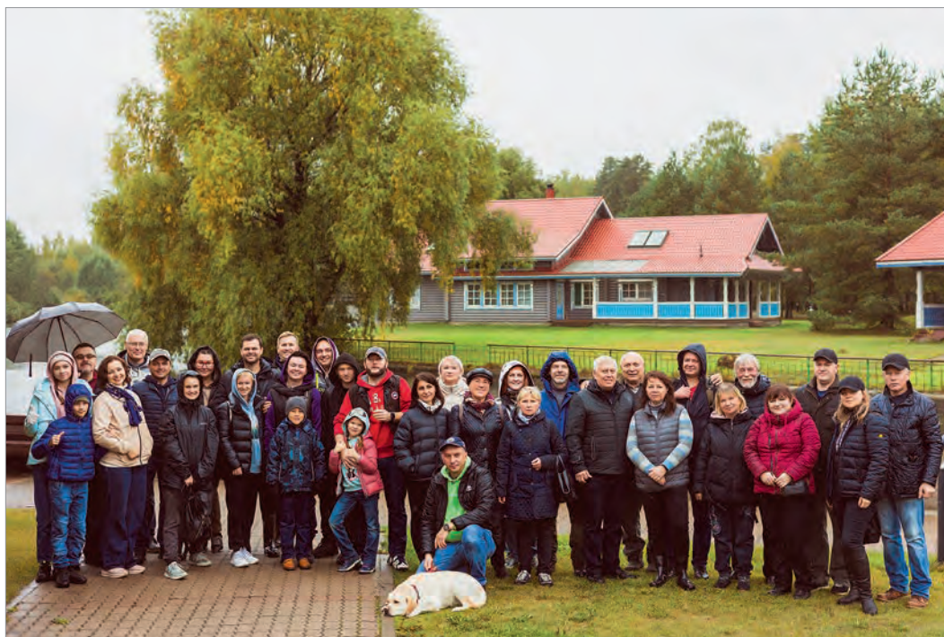
Всероссийская акция «Зеленая Россия» - 2022