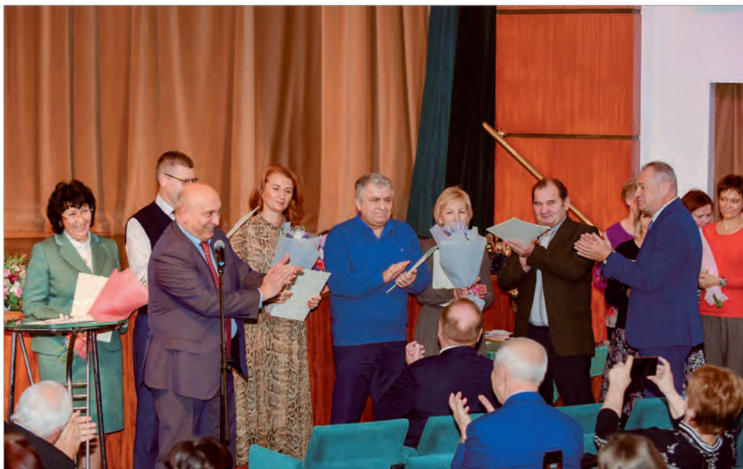
Юбилейный вечер Профсоюзного комитета ГлавУпДК в Культурном центре

Основное наше достижение и главный инструмент работы - Коллективный договор. Этот документ, который на добровольной основе подписывают работодатель и профсоюзная организация, представляющая интересы коллектива, определяет взаимные обязательства сторон. Коллективный договор по своей сути очень важный и значимый документ для коллектива. Это активный документ, который открыт и которым пользуются на протяжении всего периода его действия. Он законодательно существенно раздвигает рамки сферы социальной поддержки работников и членов их семей. Одной из важнейших задач Профсоюзного комитета является сохранение доверия работников к данному документу и работе профкома по его выполнению.