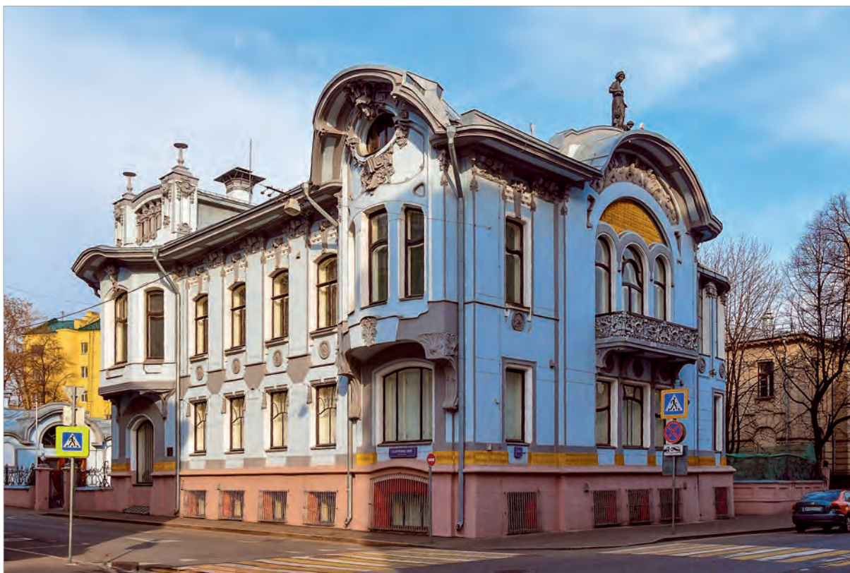
Особняк И.А.Миндовского, архитектор Л.Н.Кекушев.

Третья глава этой серии рассказывает о здании по адресу: г. Москва, Поварская ул., д. 44/2, с. 1 - шедевре модерна авторства архитектора Льва Кекушева.