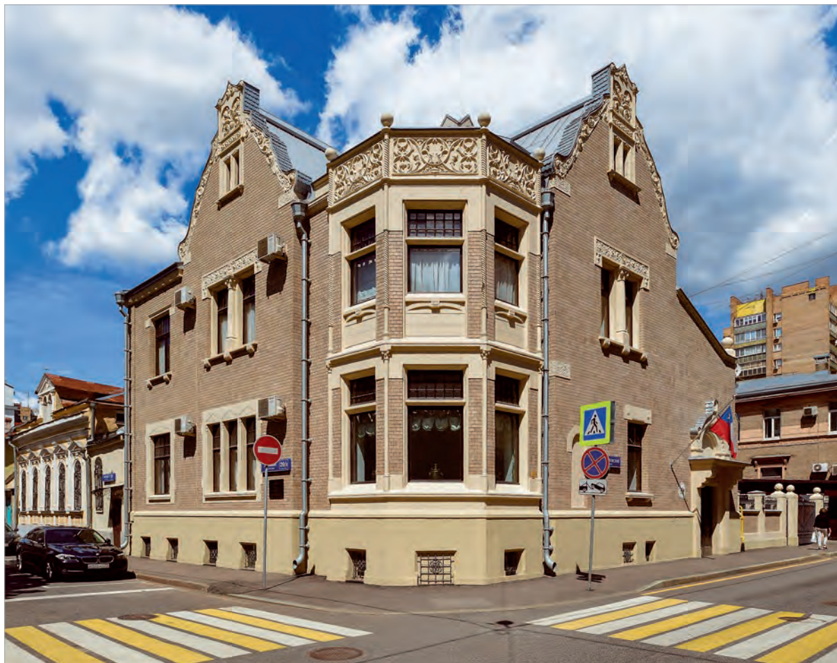
Особняк 1906 г., архитектор Р.И.Клейн.

В 2019 г. ГлавУпДК при МИД России стало лауреатом конкурса Правительства Москвы на лучший проект в области сохранения и популяризации объектов культурного наследия «Московская реставрация» в номинации «За лучшую организацию ремонтно-реставрационных работ».