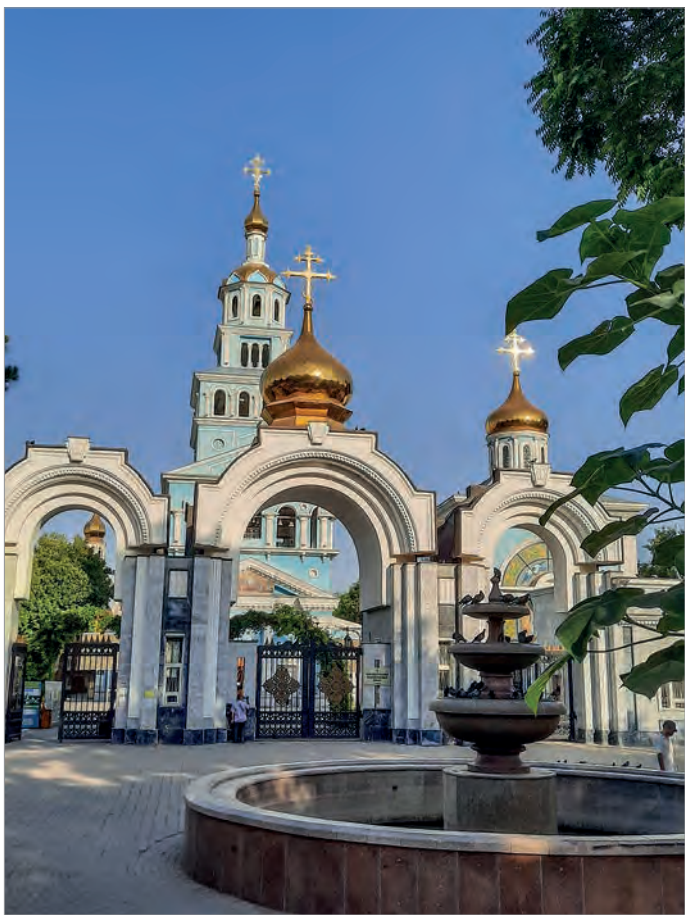
Свято-Успенский кафедральный собор

1879 года храм был освящен в честь великомученика и целителя Пантелеимона. В 1922 году приход перешел в ведение Синода Русской православной церкви. В 1933 году храм был закрыт для богослужения, после чего в здании вплоть до 1945 года на-