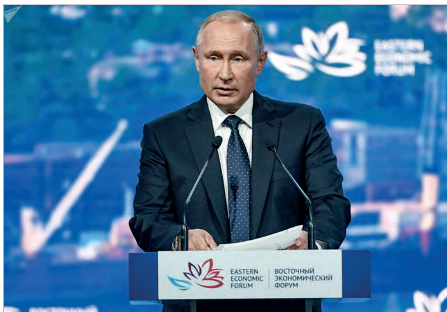
В.В.Путин выступает на VI Восточном экономическом форуме

возможностей. Проявление этой тенденции мы можем видеть на примерах Всеобъемлющего регионального экономического партнерства (ВРЭП) и Всеобъемлющего и прогрессивного соглашения для Транстихоокеанского партнерства в Азиатско-Тихоокеанском регионе (АТР). С переменным успехом ведутся переговоры по Трансатлантическому соглашению о свободной торговле и по зоне свободной торговли (ЗСТ) Евросоюз - АСЕАН.