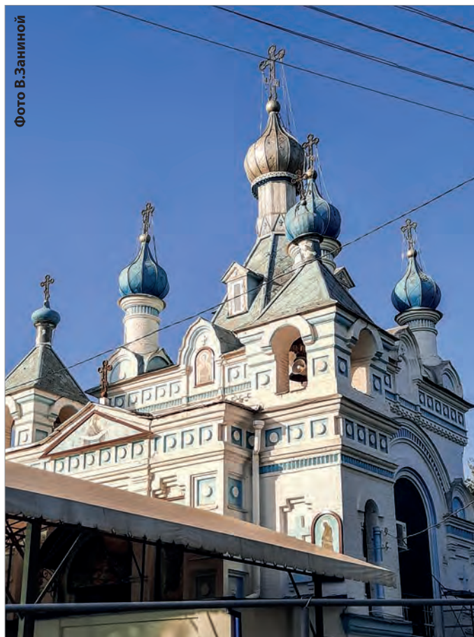
Храм Святого благоверного великого князя Александра Невского

Культурно-историческими памятниками признаны более 30 других православных храмов и монастырей на территории Узбекистана, за которыми осуществляется надлежащий уход, - храм Успения Пресвятой Богородицы в Алмалыке (заложен в 1977 г.), молитвенный дом в честь иконы Божией Матери «Взыскание погибших» в Ангрене (заложен в 1947 г.), молитвенный дом Всех святых в Андижане (1930 г.), молитвенный дом Святого апостола Фомы в Ахангаране (1910 г.), храм Сретения Господня в Бекабаде (построен в 1900 г., снесен в 1948 г., восстановлен в 1992 г.), храм Святого архангела Михаила в Бухаре (1860 г.), молитвенный дом Покрова Пресвятой Богородицы в Денау (1930 г.), храм Святителя Николая, архиепископа Мир Ликийских, чудотворца в Джизаке (1900 г.), Свято-Покровский женский монастырь в Дустабаде (построен в 1916 г., снесен в 1933 г., восстановлен в 1998 г.), храм Святителя Николая, архиепископа Мир Ликийских, чудотворца в Кагане (1968 г.), храм в честь Казанской иконы Божией Матери в Коканде (1908 г.), храм Святого праведного Иоанна Кронштадтского в Кувасае, храм Преподобного Сергия Радонежского в Навои (1991 г.),