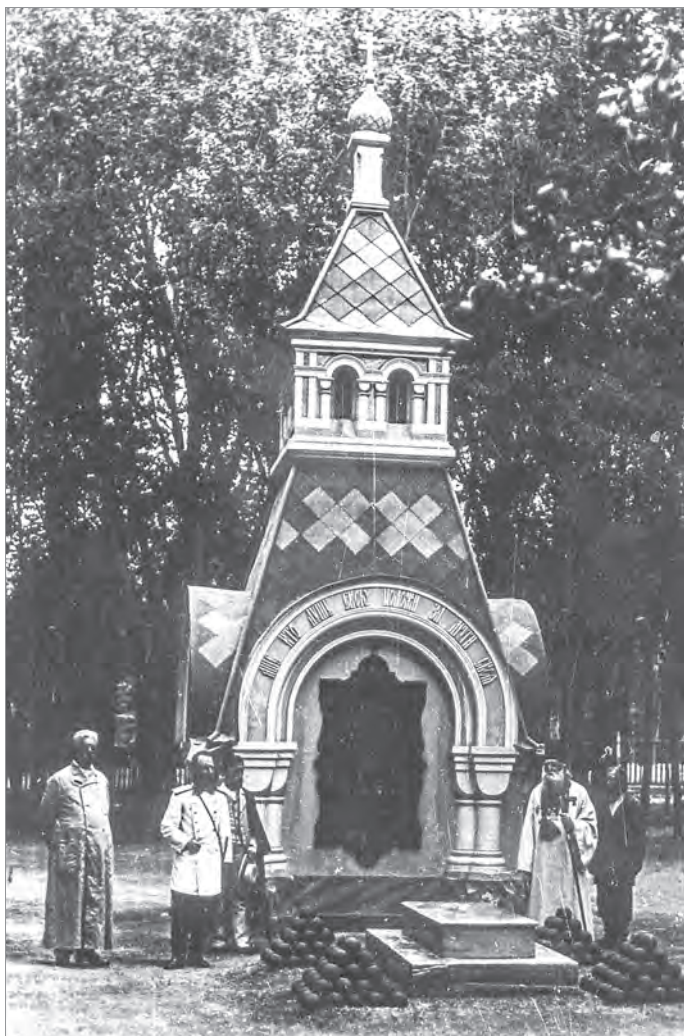
Часовня Святого Георгия Победоносца у Камалонских ворот

Решение о высылке князя было вызвано его аморальным, с точки зрения царской семьи, поведением, в частности за связь с «безродной» американкой Фанни Лир (опубликовавшей впоследствии скандальные мемуары «Роман в царском доме»), по другой версии - за кражу фамильных драгоценностей 1 . За время своей жизни в Ташкенте князь много сделал для развития этого края. Еще до ссылки он успел поучаствовать в нескольких научных экспедициях, которые изучали Приаралье с целью выбора оптимальных путей для прокладки железной дороги из центра России в Туркестан, поэтому сразу после приезда приступил к ирригационным работам в степи, на его средства был прорыт Искандер-арык, значительные территории были обеспечены водоснабжением, после чего там возникли новые поселения земледельцев, выращивающих хлопок. Кроме того, князь пожертвовал из своей коллекции около 2 тыс. книг в Туркестанскую публичную библиотеку (сейчас - Национальная библиотека Узбекистана имени Алишера Навои), на его деньги в столице появились так называемые «дома ветеранов», два городских кинотеатра 2 .