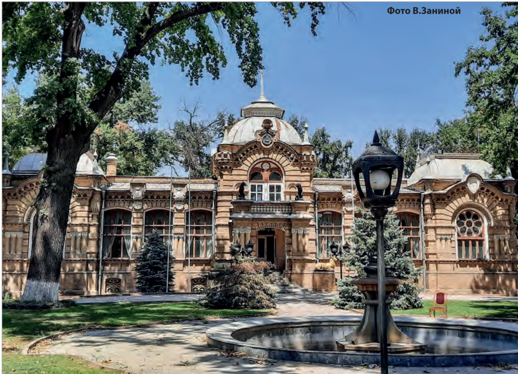
Резиденция князя Н.К.Романова в Ташкенте

И только с приходом к власти Ш.М.Мирзиёева в 2016 году отношение к российскому культурно-историческому наследию кардинально изменилось. Сейчас ни власти страны, ни общественность в целом не подвергают сомнению ценность и уникальность культурно-исторических объектов российского наследия в Узбекистане как неотъемлемой части его истории (некоторые из объектов официально признаны в республике культурно-историческими памятниками), более того, вопросы их сохранения и популяризации находятся под личным контролем руководства страны, благодаря чему на их восстановление выделяются значительные финансовые средства из государственного бюджета.