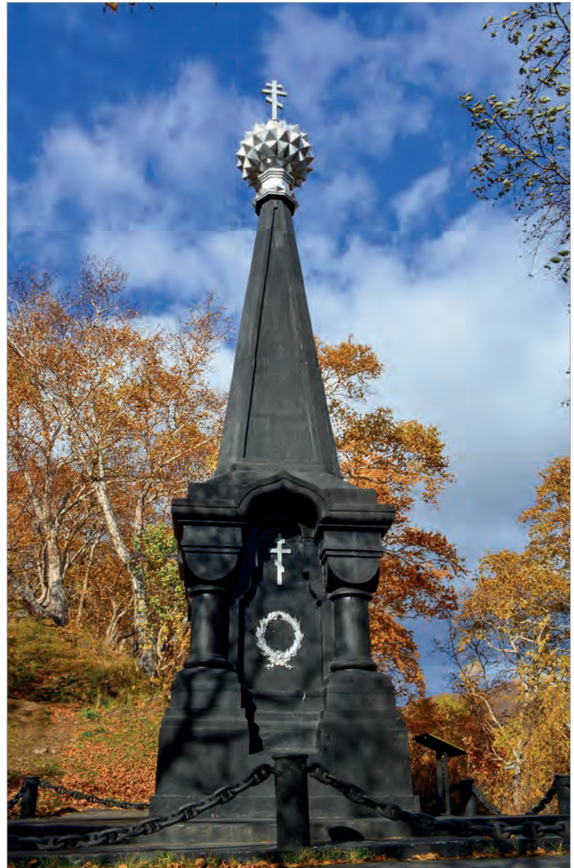
Памятник в Петропавловске

Какая беспардонная высокопарность! Хотели, чтобы соотечественники не вспоминали о тысяче лучших английских дворян, сраженных русской шрапнелью под Балаклавой при бесславно осуществленной конной атаке? И уж тем более об упокоившемся там герцоге Мальборо, могилу которого Сталин гуманно дозволил навестить его потомку, двуликому в отношении к России У.Черчиллю в ходе знаменитой Ялтинской конференции?