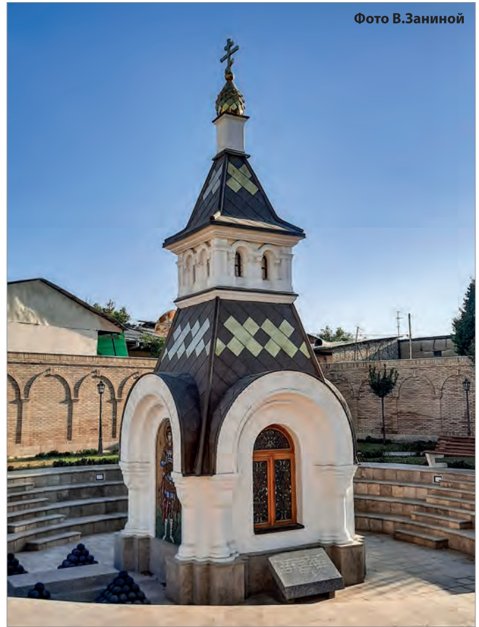
Часовня Святого Георгия Победоносца у Камалонских ворот после реконструкции

Еще одним историческим памятником, восстановленным узбекской стороной, является часовня Святого Георгия Победоносца у Камалонских ворот, возведенная в 1886 году на месте захоронения 24 русских воинов (казаков), погибших при штурме Ташкента под командованием генерала М.Г.Черняева 15 июня 1865 года (находится в центре города). Взятие Ташкента - ключевой эпизод Русско-кокандской войны 1850-1868 годов, положившей начало завоеванию Средней Азии. До распада Российской империи на братской могиле ежегодно в годовщину штурма в присутствии генерал-губернатора Туркестана, священнослужителей и ветеранов боевых действий совершалась панихида по погибшим воинам.