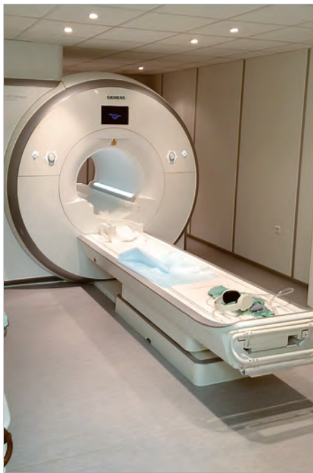
Кабинет МРТ. Клиничко-диагностический центр