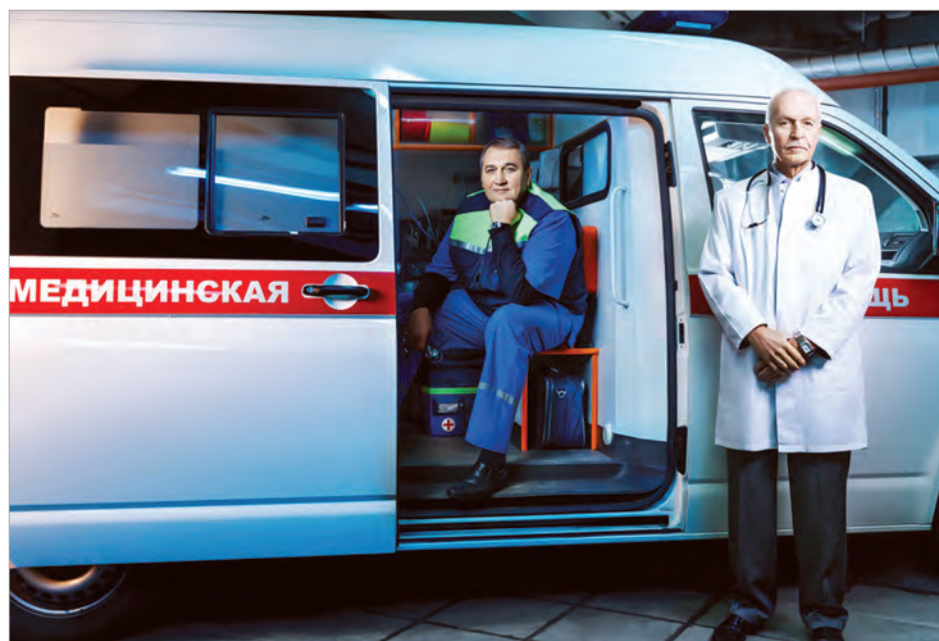
Служба скорой медицинской помощи и помощи на дому

аппарат МРТ экспертного уровня - Siemens MAGNETOM Aera (1,5 T). Новые технические возможности системы обеспечивают высокий диагностический уровень визуализации и позволяют сделать процедуру МР-исследования более комфортной для пациентов.