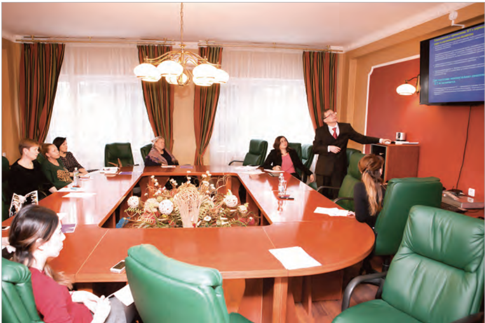
Третья научно-практическая конференция по актуальным проблемам гинекологии в стационаре «Мединцентра»

«Мединцентр» оборудован современной аппаратурой. Так, в клинко-диагностическом центре установлен и запущен в работу новый