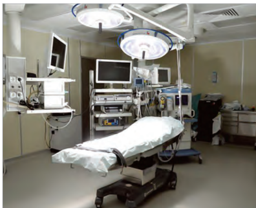
Хирургическое отделение стационара, операционный блок

Пациентам стационара предлагаются одно-, двухместные палаты и палаты повышенной комфортности, а также трехкомнатные палаты для VIP-клиентов. Во всех палатах имеются кондиционер, холодильник, телефон, телевизор, санузел.