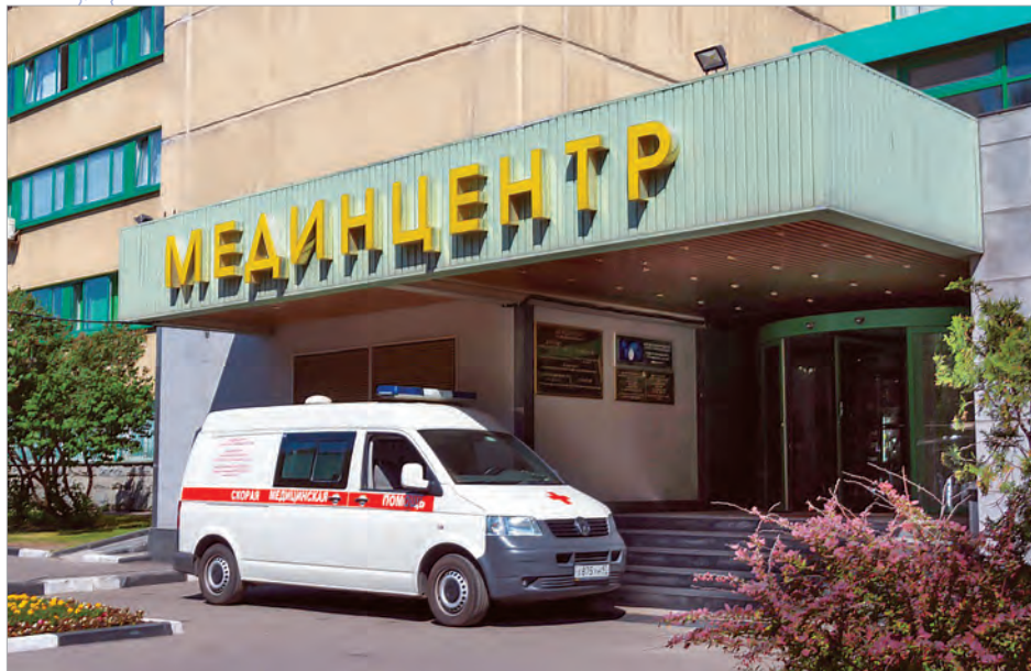
Клинико-диагностический центр по адресу: 4-й Добрынинский пер., д. 4

Ф илиал «Мединцентр» Главного управления по обслуживанию дипломатического корпуса при МИД России - одна из ведущих клиник Москвы с многолетней историей и уникальным опытом оказа-