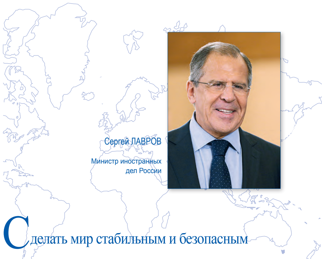
Сергей ЛАВРОВ Министр иностранных дел России