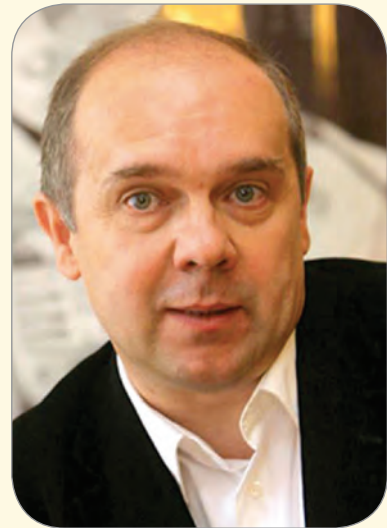
Comentarista del diario húngaro "Magyar Nemzet"