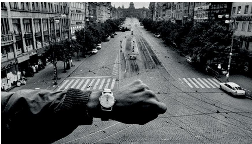
Из фотосерии о Пражской весне. Фотограф Й. Коуделка

Или ты стреляешь, или в тебя стреляют» 15 . По его убеждению, «то, что происходило в Праге в августе 1968-го, - это, конечно, был спектакль. Но одновременно - один из редких моментов истины, когда общество забывает носить маску. В тот момент визуально - это театр, но по своей сути - нет. И это главное» 16 .