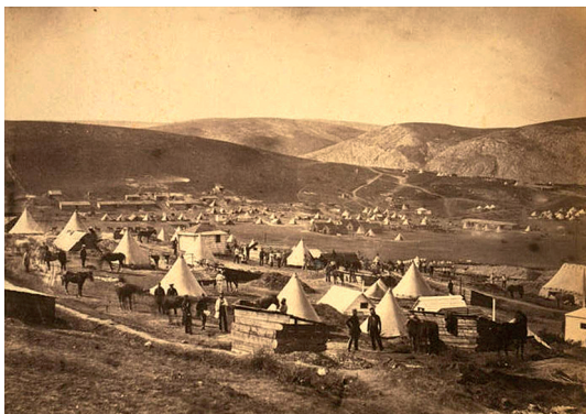
Крымская война. Фотограф Р. Фентон

Что касается Фентона, то он оставался в Крыму до конца июня 1855 года, фотографировал и писал многочисленные подробные письма. Его потрясли грабежи, пьянство и беспорядки в союзных войсках. В то же время в записях можно найти и идиллические описания цветущих лугов и живописных деревень. Что касается фотографических свидетельств, то Фентон делал очень мало снимков того, что можно было бы назвать действием, поскольку его больше привлекали такие объекты, как кучи снарядов, оружие, заваленное тряпьем, и корабли в далеком порту, выглядевшие,