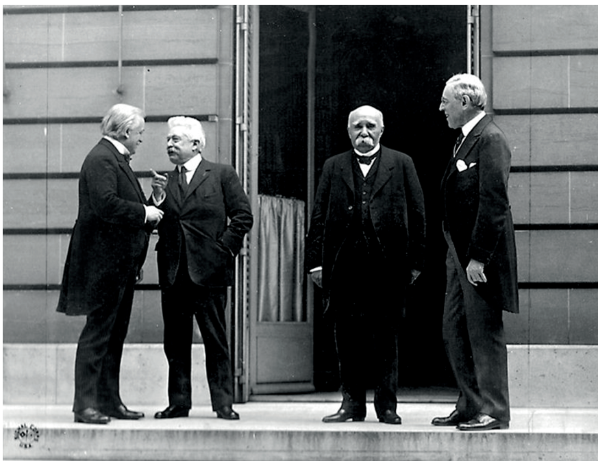
«Большая четверка»: Дэвид Ллойд Джордж, Витторио Орландо, Жорж Клемансо, Вудро Вильсон. Фотограф Э.Н.Джексон

И, согласно докладом Красного Креста, Эрих Соломон умер в газовых камерах Освенцима 7 июля 1944 года 5 . Творческая манера Соломона указывала на возможность с помощью объектива фотокамеры выхватить неожиданный ракурс, который, несомненно, говорил о человеке больше, чем постановочная съемка. Соломон был из числа тех фоторепортеров, которые стремились соединить искусство фотографии с потребностями времени.