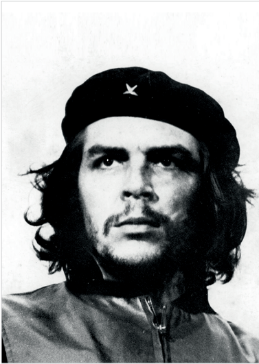
Че Гевара - «Героический партизан».

Корда, как и еще два десятка фотографов, снимавших Фиделя Кастро и его сподвижников, был зачарован молодой энергией участников Сопротивления на маленьком острове в Карибском море, который вскоре стал геополитическим символом свободы. И сейчас подлинные фотоснимки тех времен не развеивают романтический миф о кубинской революции, а заставляют задуматься о том, для чего и как делаются революции. Об этом рассказывает выставка «Куба в революции», организаторы которой решили доказать, что кубинская революция